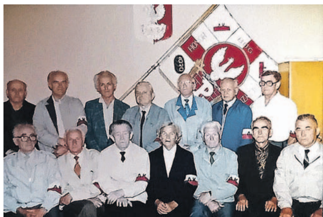
Zarząd Oddziału ZZZAK w 1989 r.