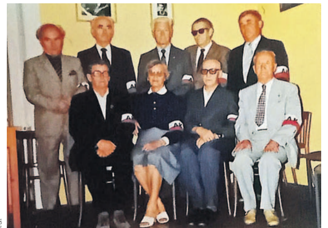
Działacze ŚZZAK w 1991 r.