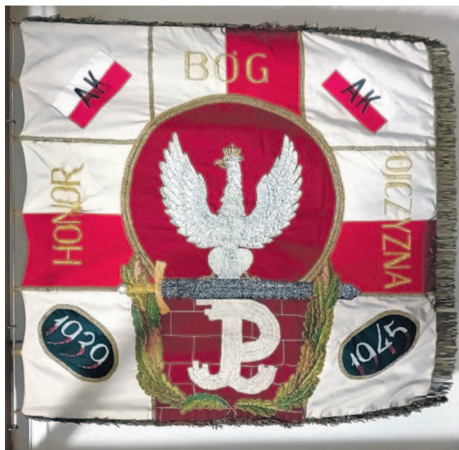
Sztandar koła ŚZZAK

W działalności koła istotne stały się miejsca pamięci, umożliwiające oddawanie hołdu. Jest to m.in. odsłonięta 20 grudnia 1992 r. na gmachu banku przy ul. Kościuszki 4 tablica honorująca ZWZ-AK-NOW. Niespełna rok później przed budynkiem koszar przy ul. Mickiewicza 21 poświęcono obelisk upamiętniający żołnierzy 2 Pułku Strzelców Podhalańskich i ich kontyngentów z Obwodu Sanok AK. 18 listopada 1995 r. w kościele Przemienienia Pańskiego odsłonięto Krzyż „Golgota Wschodu”, a ważną pamiątkę stanowi tablica na murze tej świątyni, poświęcona żołnierzom SZP-ZWZ-AK Obwodu Sanok (z 1986 r.).