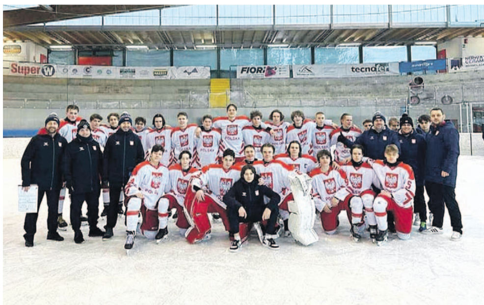
ARCH. REPREZENTACJI POLSKI

Polska – Węgry 3:2 d. Polska – Węgry 3:4