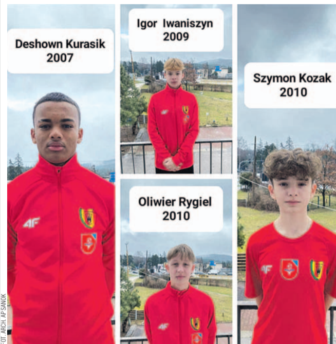
Czterej zawodnicy AP w barwach Korony Kielce

Przed tygodniem wystartowała runda rewanżowa seniorskiej ekstraklasy. Tymczasem do jednego z tamtejszych klubów, a mianowicie Korony Kielce, wybrało się czterech wychowanków Akademii Piłkarskiej.