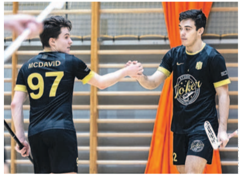
Zawodnicy Jokera wygrali pewnie i wysoko