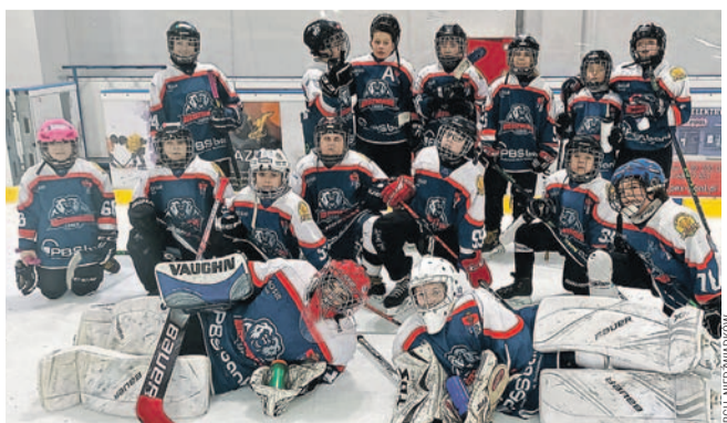
Drużyna żaków młodszych Niedźwiadków

Popisowe mecze drużyn Niedźwiadków – cztery wyjazdy i komplet dwucyfrowych zwycięstw! (es)