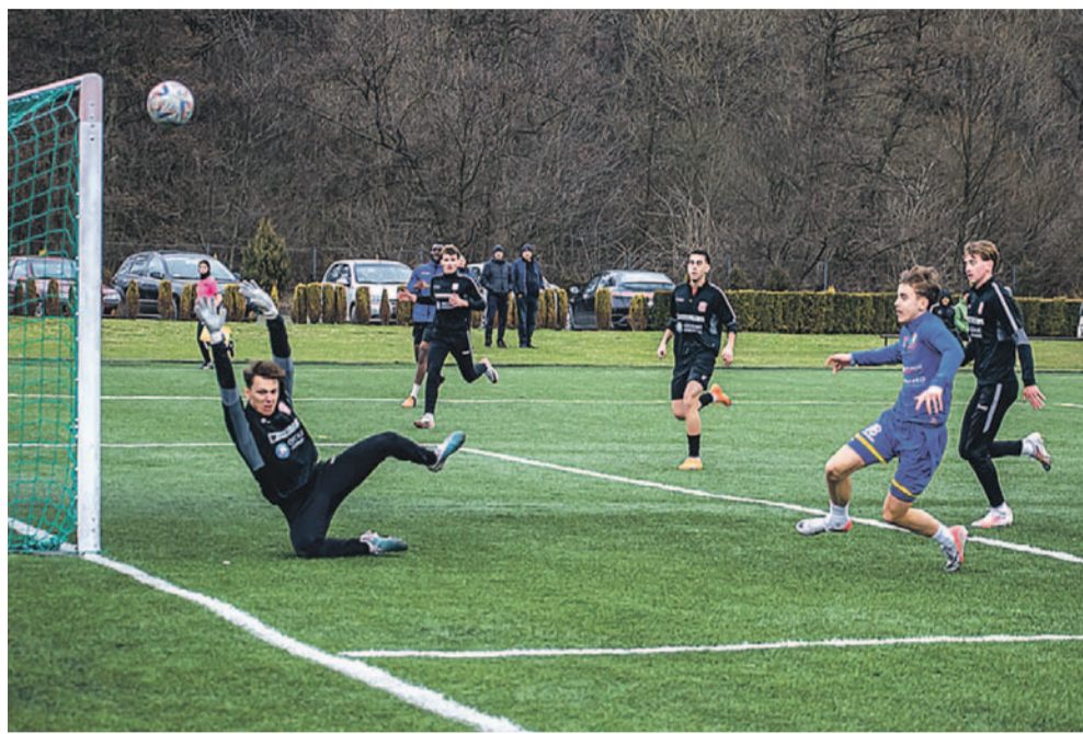
Jedna z akcji bramkowych

W kolejnym meczu kontrolnym stalowcy gościli w Pakoszówce rezerwy Resovii, czyli IV-ligowych rywali. W sierpniu pokonali ich na wyjeździe 2:1.