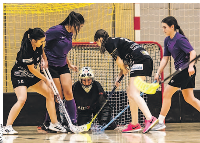
Podbramkowych spięć nie brakowało

ILO – WILKI 4:0 Bramki: Kądziołka 3, Czubek.