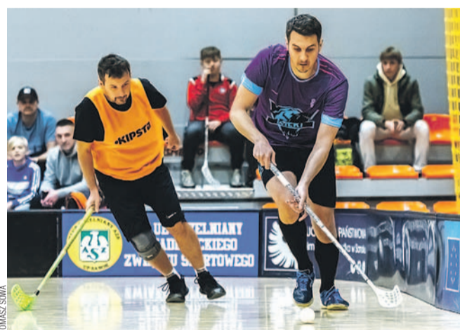
Sezon zasadniczy dobiegł końca, czas na fazę play-off

Czas zatem na play-offy. W ćwierćfinałach Wilki zagrają z Deka Furniture, AZS UP z Pasjonatami, a Epaki.pl z BA. Trzy z tych zespołów dołączą do czekającego już w półfinale Jokera. (bb)