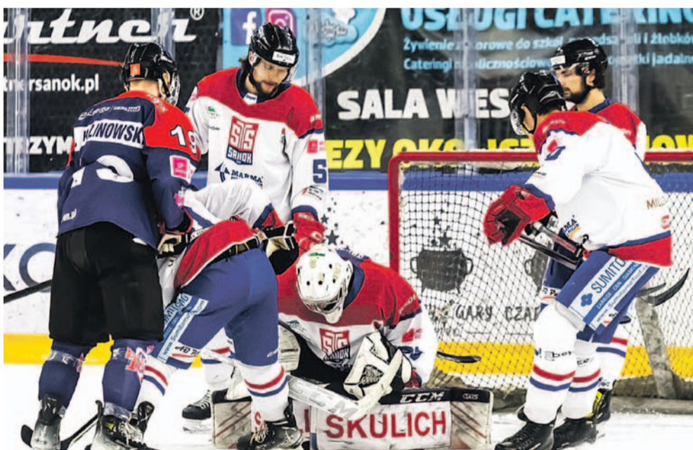
Nasi bramkarze musieli aż siedem razy wyciągać krążek z siatki