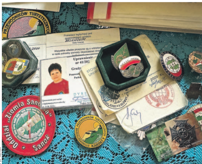
Niektóre z pamiątek bohaterki artykułu