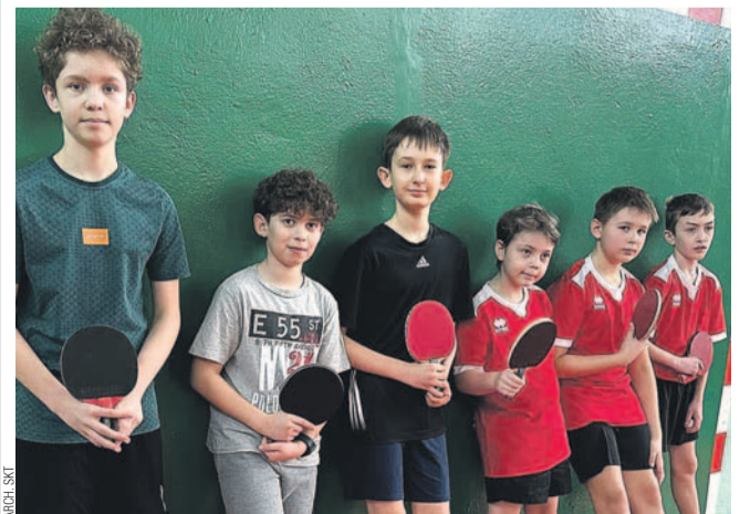
Pingpongiści SP3 (po lewej) stoczyli zaciętą walkę z SP9 (z prawej)

W decydującym pojedynku zwycięstwo odnieśli pingpongiści SP3, rewanżując się SP9 za porażkę grupową. Najlepsze drużyny uzyskały awans do zmagania rejonowych.