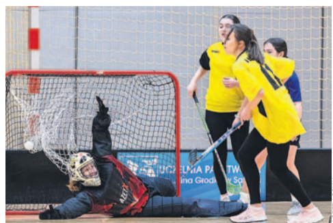
W meczu liceów piłeczka co rusz wpadała do siatki