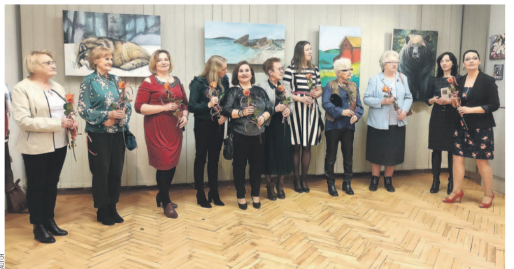
Spotkanie członków Klubu Plastyka

Ostatni weekend obfitował w spotkania związane z twórczością. Sobota stała pod znakiem malarstwa i pirografii w Osiedlowym Domu „Puchatek”. Swoje prace zaprezentowały osoby zrzeszone w Klubie Plastyka.