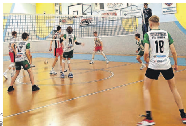
Kadr z meczu młodzików TSV

TSV SANOK – KPS I NOWA DĘBA 0:2 (-24, -13)