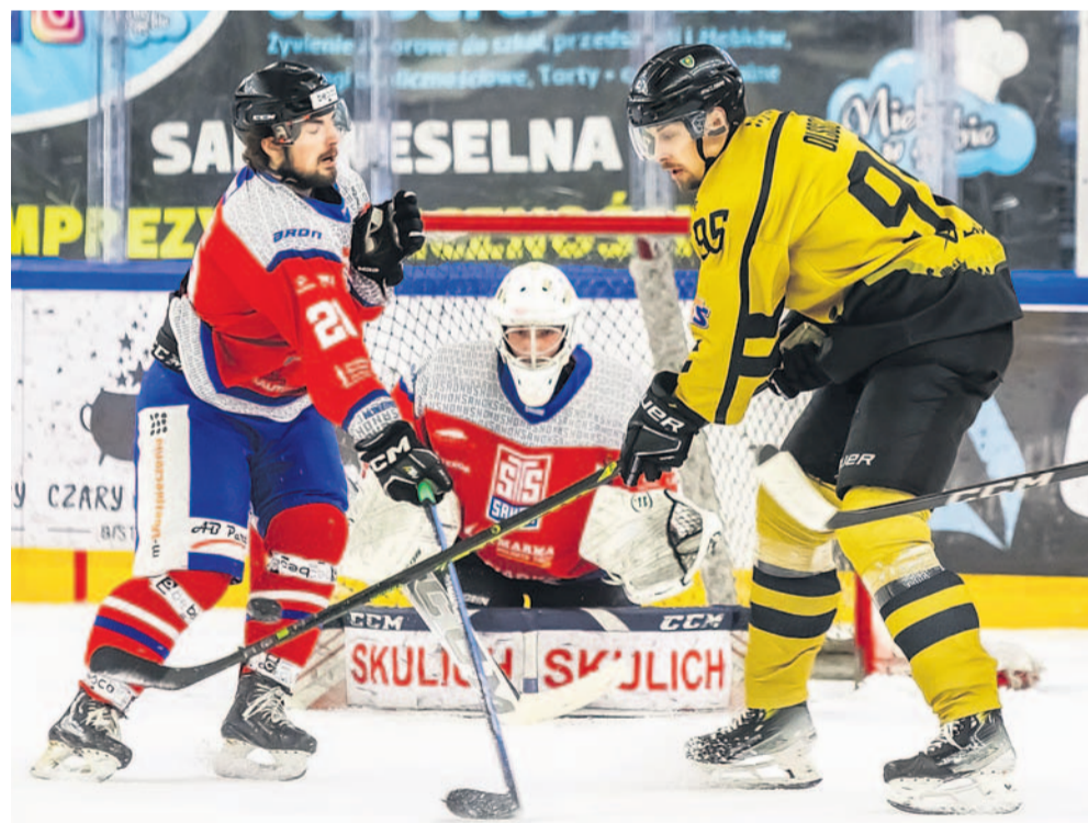
Walka pod bramką STS-u