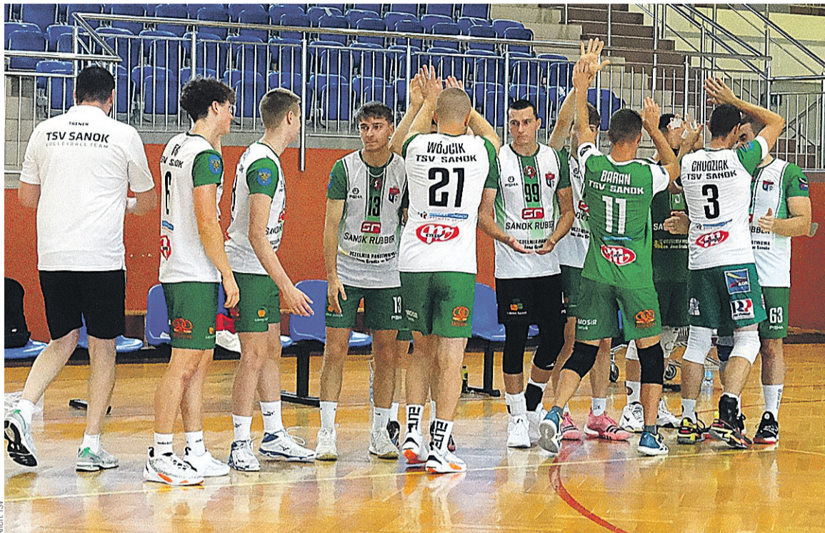
Siatkarze TSV przegrali z zajmującym niższe miejsce Żaglem, jednak wyjazdowy punkt trzeba docenić