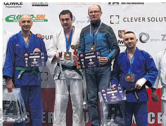
Reprezentanci Pantery (niebieskie stroje) na podium w Gliwicach

Judo to nie tylko sport dla młodych. To dyscyplina, którą można uprawiać w każdym wieku. Wyniki turnieju pokazują, że zarówno młodszy, jak i starsi zawodnicy mają szansę osiągnąć sukcesy i czerpać radość z uprawiania tej szlachetnej sztuki walki. Gratulujemy wszystkim uczestnikom za zaangażowanie i osiągnięte rezultaty, które wpisują się w historię sanockiego judo – czytamy na stronie fb Pantery.