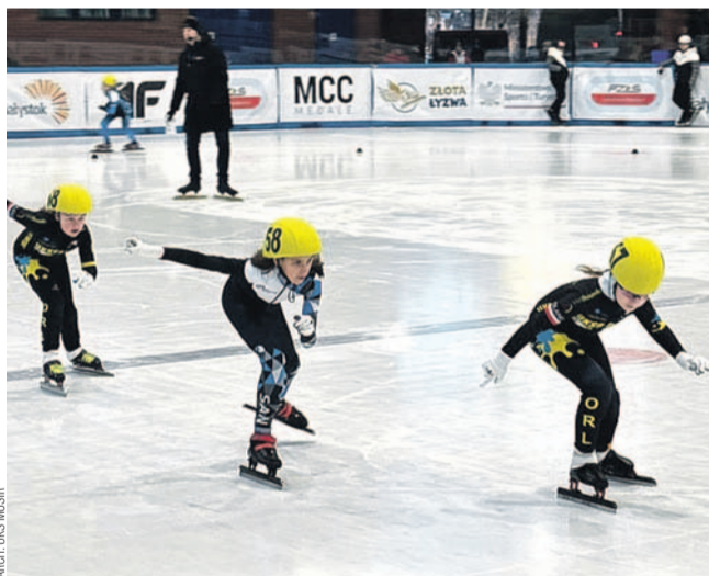
Młodsze zawodniczki zakończyły już sezon

Przejdźmy do klasyfikacji łącznych sezonu 2023/24. W juniorkach E nasze najlepsze short-trackistki zakończyły rywalizację z identycznym bilansem 360 punktów, jednak wygrany wielobój finałowych zawodów zdecydował o końcowym zwycięstwie Strzyżowskiej. Abako musiały zadowolić się 2. miejscem.