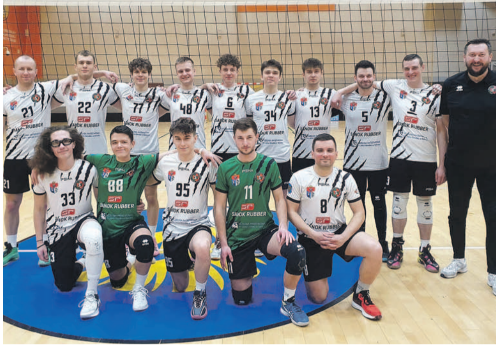
Siatkarze TSV zakończyli sezon w niezłych humorach po wygranym meczu z SPS-em Pruchnik