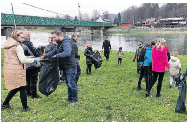
Członkowie Łączy Nas Sanok w akcji

Operacja Czysta Rzeka to świetny przykład współpracy różnych środowisk na rzecz ochrony przyrody. Współdziałanie Fundacji im. Mariana Pankowskiego, firmy Transprzet, szkół i lokalnej społeczności pokazuje, że razem można zdziałać wiele dobrego.