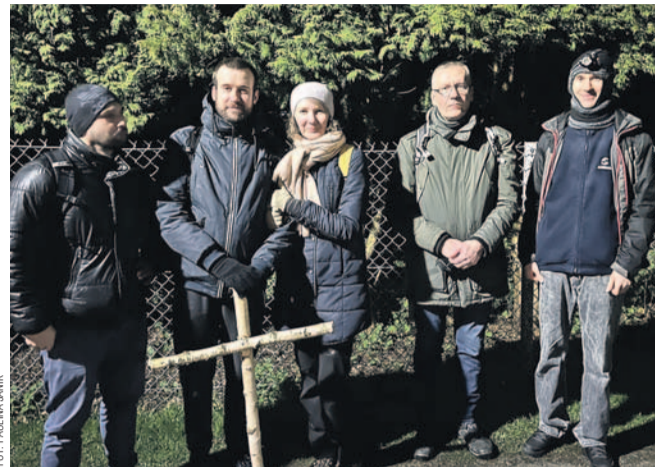
Pielgrzymowano samotnie bądź w małych grupach

Przez ulice miasta przeszło blisko 180 pielgrzymów. Wyruszyli z Kapliczki pw. św. Maksymiliana na 11 tras Ekstremalnej Drogi Krzyżowej.