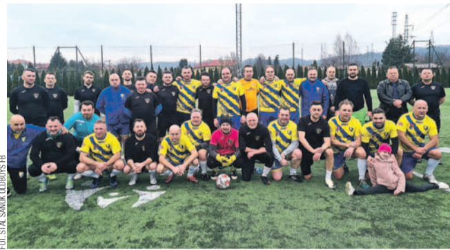
Pamiątkowe zdjęcie drużyn po meczu

Początek wiosny to także okazja do wznowienia aktywności piłkarskiej na świeżym powietrzu przez byłych już futbolistów.