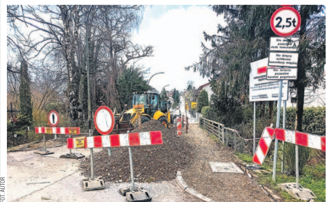
Prace remontowe na moście i ul. Głowackiego