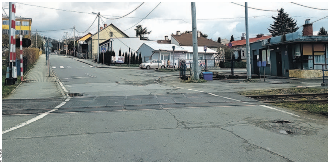
Ul. Sienkiewicza, którą Probst uciekał z gestapo w stronę przystanku kolejowego, widocznego po prawej (2024 r.)