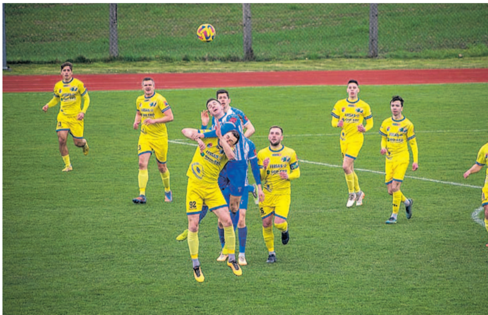
Stalowcy nie dali szans rywalom na ich terenie

Drugie z rzędu wiosenne zwycięstwo stalowców – tym razem wyjazdowe. Cieszyć mogą nie tylko trzy punkty, ale i skuteczność bramkowa.