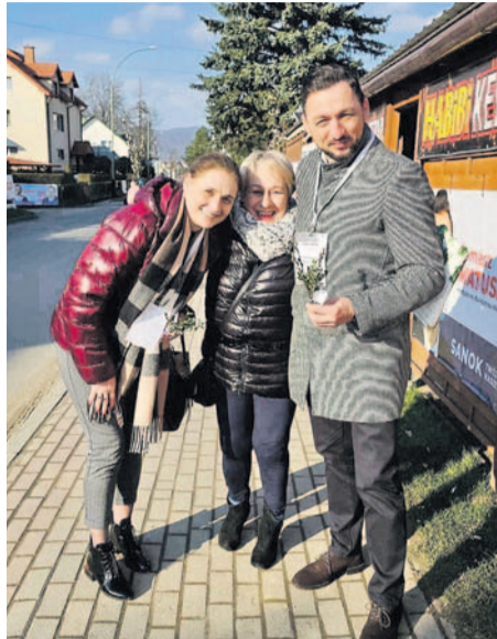
Wielkanocne spotkania z mieszkańcami