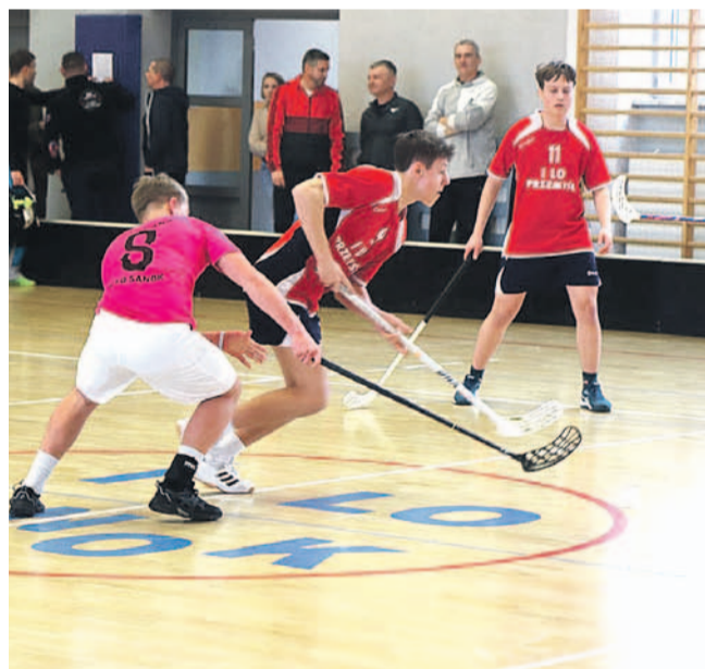
Drużyna ILO nie dała szans rywalom