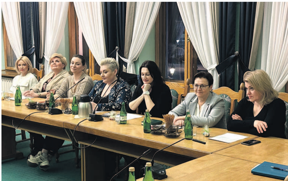
Pierwsze posiedzenie Rady Kobiet

W Sali Herbowej Urzędu Miasta odbyło się pierwsze posiedzenie Rady Kobiet. W jej skład wchodzi osoby reprezentujące różne środowiska i organizacje, a ich wspólnym celem jest działanie na rzecz równouprawnienia i poprawy jakości życia kobiet w Sanoku.