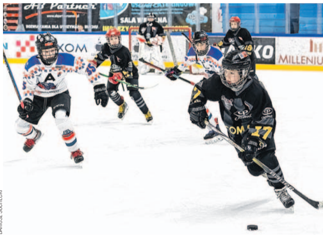
Mimo wygranej z Cracovią gracze Niedźwiadków nie wyszli z grupy

UKS NIEDŹWIADKI MOSiR SANOK – CRACOVIA KRAKÓW 2:1 (0:1, 1:0, 1:0)