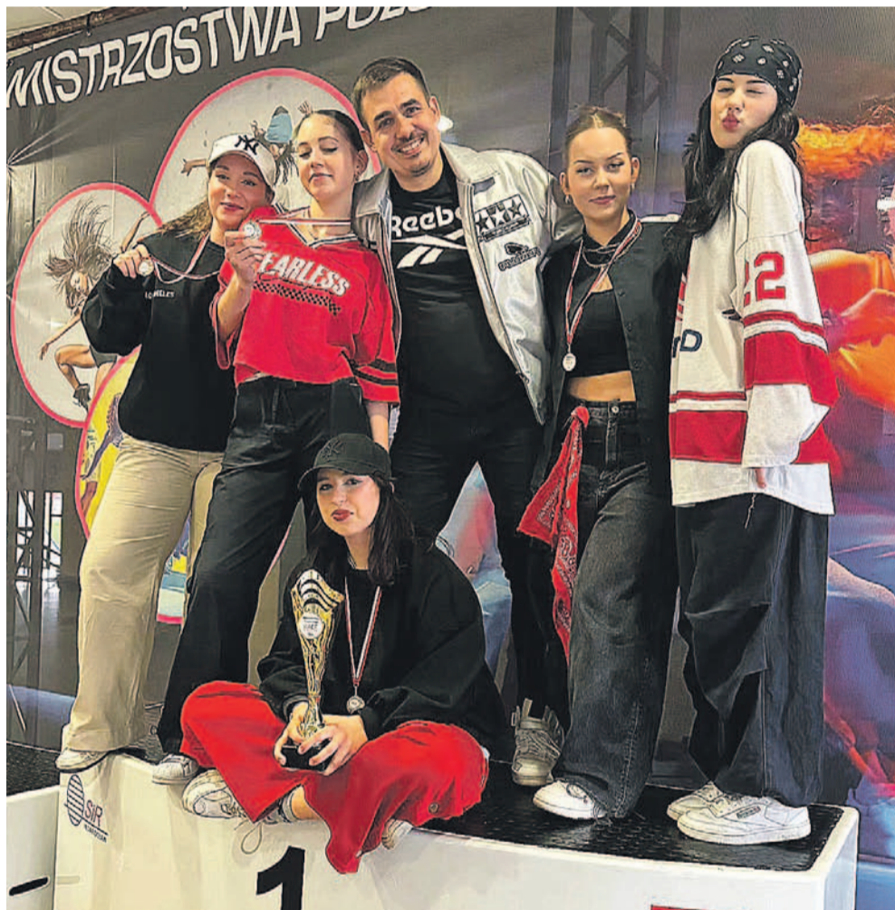
Zenith Crew na podium