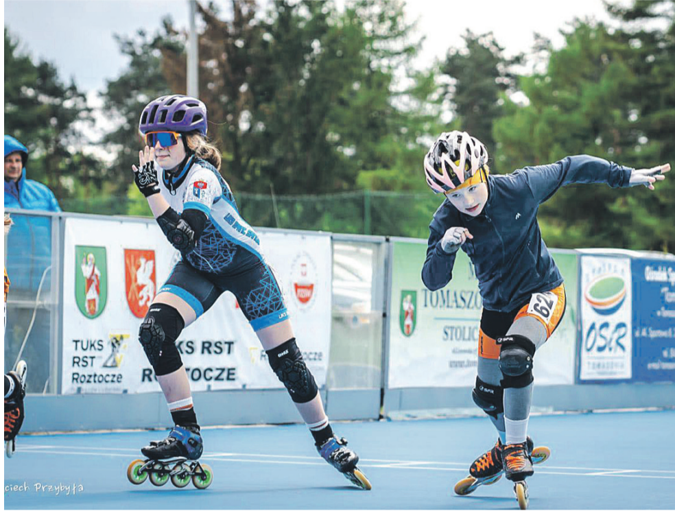
Nowy sezon wrotkarski nabiera tempa