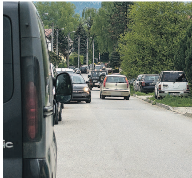
Ruch zwiększył się w związku z remontem sąsiedniej ulicy

– Propozycja mieszkańca zostanie skonsultowana z Radą Dzielnicy Zatorze. Przypominę, że kilka lat temu mieliśmy podobny problem na ul. Głowackiego. Wówczas wśród samych mieszkańców pojawił się spór, czy wprowadzić tam