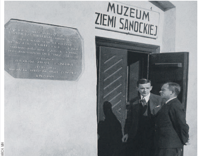
Wejście do Muzeum Ziemi Sanockiej (1934 r.)

– etnograficzna: prezentująca kulturę ludową Podkarpacia, z bogatą kolekcją strojów i przedmiotów związanych z obrzędami i rzemiosłem,