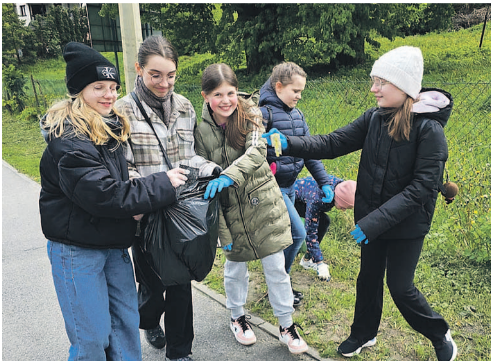
Uczniowie w trakcie Dnia Ziemi

Każdego roku wiele organizacji, stowarzyszeń i placówek oświatowych angażuje się w obchody Dnia Ziemi. Do akcji dołączyli również uczniowie „Jedynki”, którzy na różne sposoby włączyli się do świętowania.