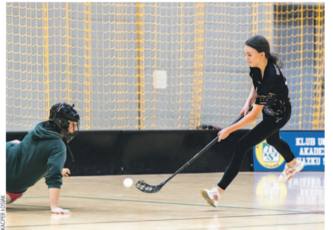
Unihokeistki Wilków awansowały do finału, w którym zagrają z ILO