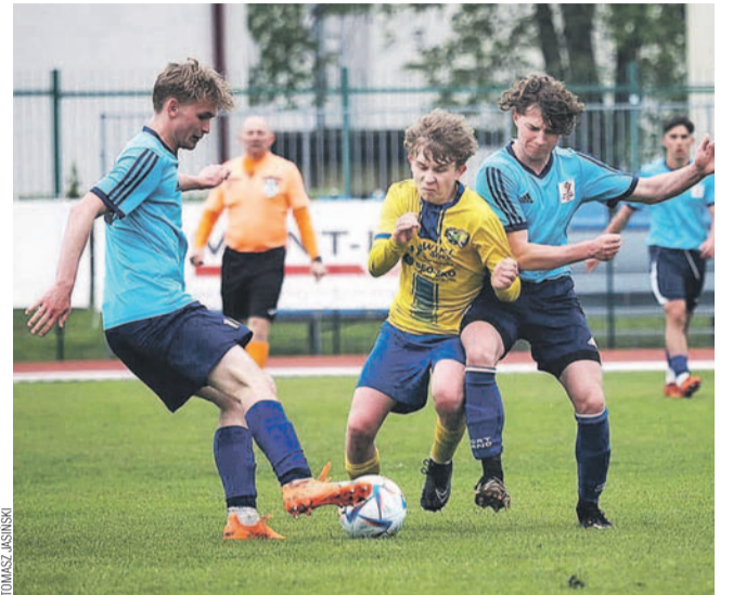
Scena z meczu Ekoball – Karpaty

Na czoło ostatnich kolejek wysunęły się dwa pojedynki derby. Oba na swoją korzyść rozstrzygnęły drużyny Ekoballu. Juniorzy starsi zwyciężyli nieznacznie krosnian, natomiast trampkarze starsi nie dali szans Akademii Piłkarskiej.