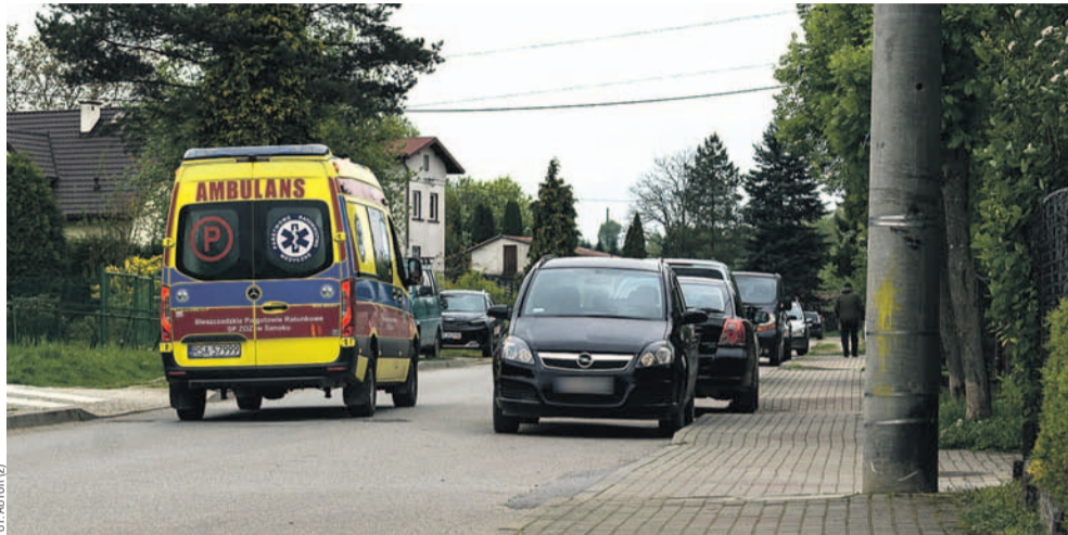
Jeden pas jezdni na ul. Płowieckiej jest zastawiony zaparkowanymi autami