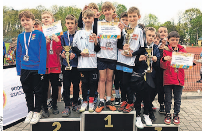
Chłopcy z SP9