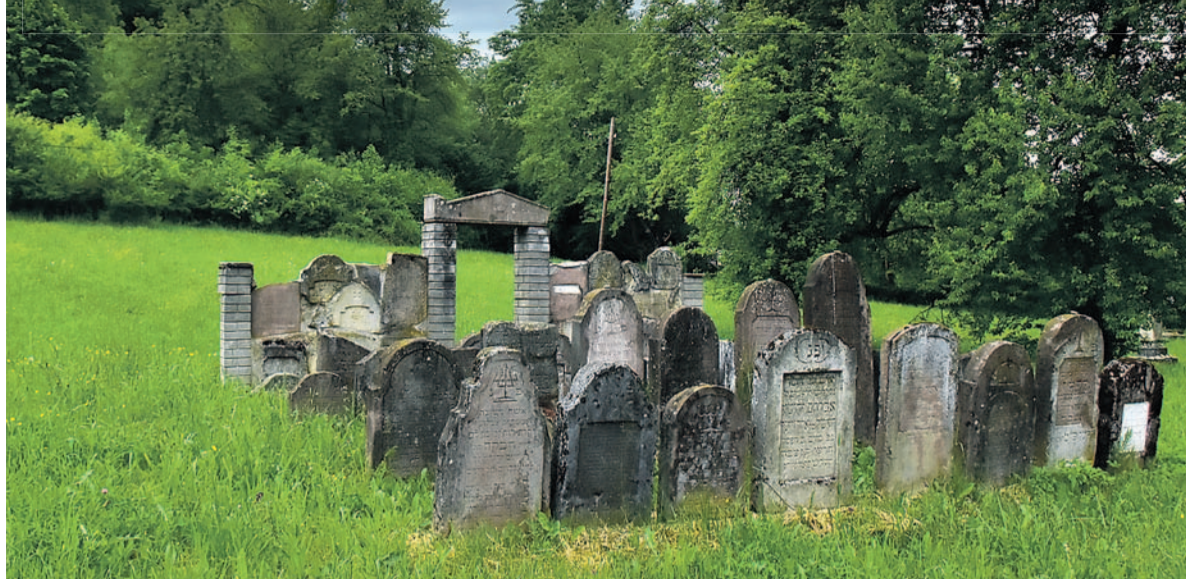
Nowy cmentarz żydowski przy obecnej ulicy Głogowej – miejsce egzekucji