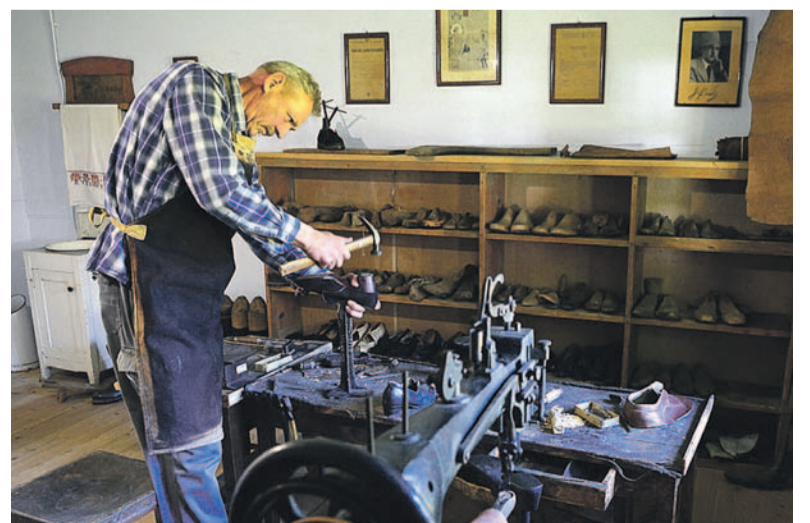
Szewc to jeden z ginących zawodów