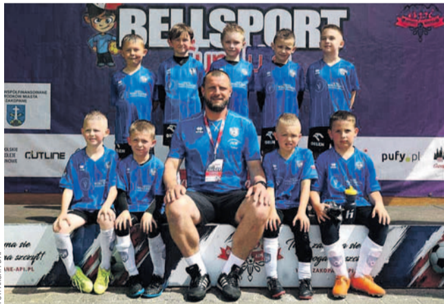
Drużyna AP w Zakopanem

w turniejowej stawce. Wyprzedzili m.in. litewskie ekipy z Wilna i Kowna, a także rodzimych przedstawicieli Zagłębia Sosnowiec czy Hutnika Kraków. W turnieju triumfowali Francuzi z OGG Nice.