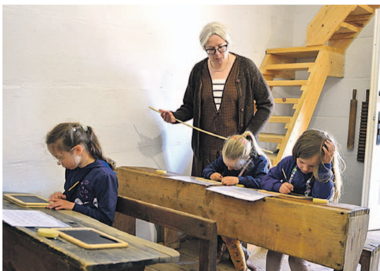
Na zajęciach kaligrafii panował klimat dawnej szkoły

Na scenie plenerowej koncertowali Trio Kremenaros, Przeworska Kapela Podwórkowa Beka oraz Regionalny Zespół Pieśni i Tańca Markowianie.