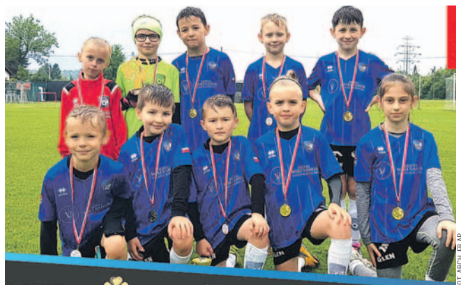
Drużyna AP w Jasle

Tymczasem kadra AP z rocznika 2015 wybrała się do Jasła, biorąc udział w turnieju charytatywnym, zorganizowanym przez miejscowy Klub 6. Dochód z tej imprezy przeznaczono na leczenie małego Ksawerego.