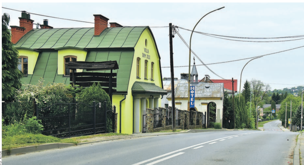
Ulica Juliusza Słowackiego – trakt którym prowadzono Friedów na egzekucje. Po lewej Villa