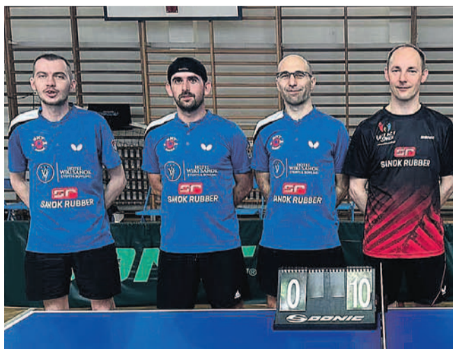
Trzeci zespół SKT zapewnił sobie awans do IV ligi