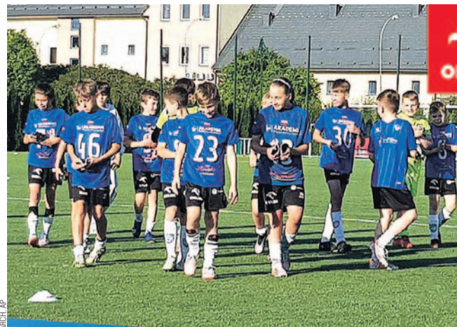
Młodzicy młodszy AP po meczu z Chemikiem