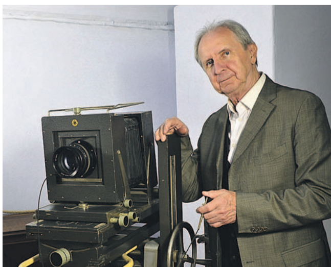
kael Prezentacja dagerotypu