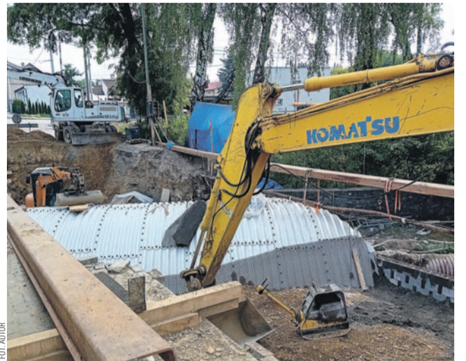
Aktualny stan prac

Z uwagi na podjęty remont od 18 marca zamknięty pozostaje most nad Potokiem Płowieckim, będący częścią ulicy Głowackiego. Jak się okazało, prace potrwały dłużej niż to planowano.