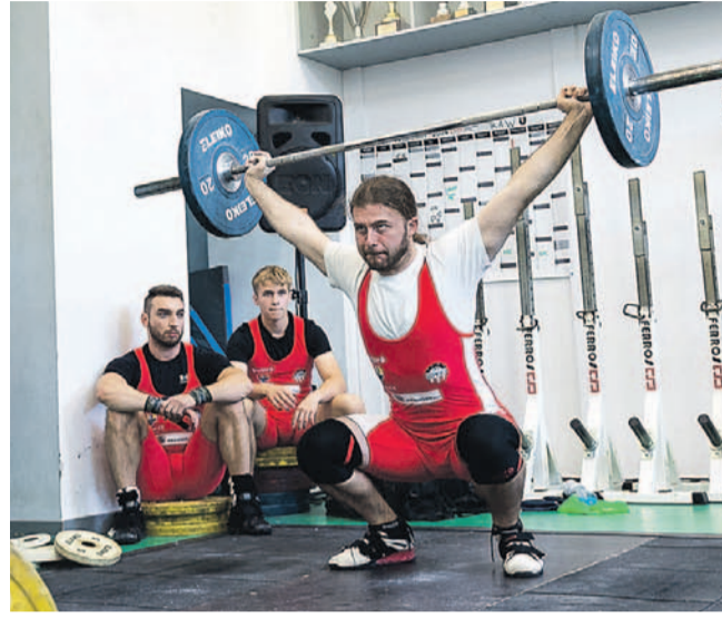
Zawody na siłowni stadionu „Wierchy” dostarczyły sporo emocji

Dobiegł końca sezon rywalizacji ligowej. Jedne z finałowych zawodów rozegrano na siłowni stadionu „Wierchy”, gdzie walczyły cztery kluby, w tym oczywiście sztangiści Gryfu. Ostatecznie drużyna gospodarzy zajęła 5. miejsce w tabeli II ligi.