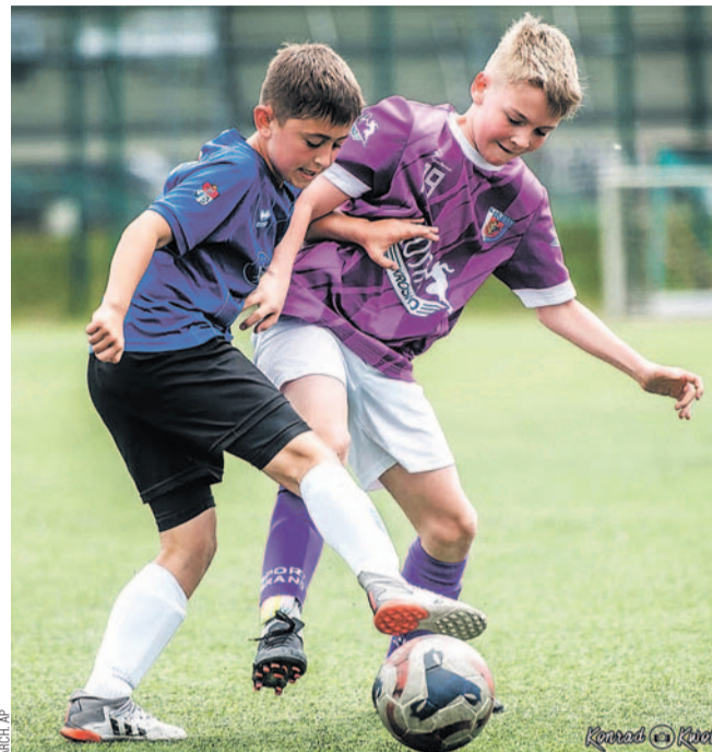
Mecz młodzików młodszych AP z Karpatami