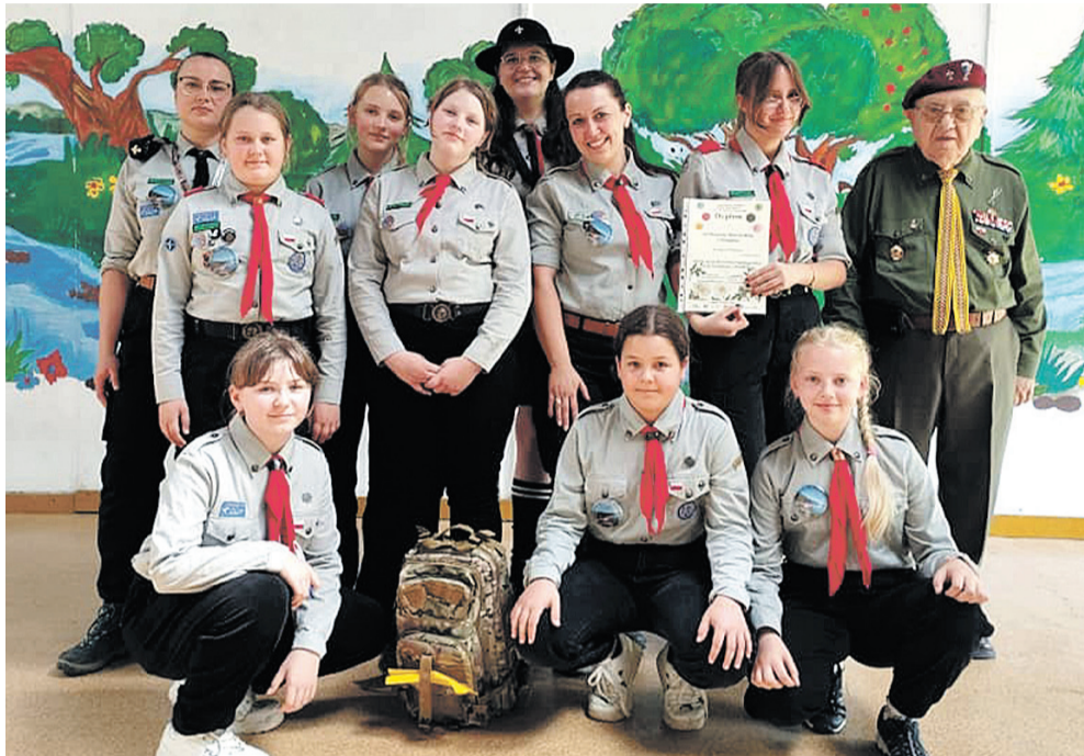
Sanoccy harcerze na zlocie

Reprezentanci Hufca ZHP Ziemi Sanockiej uczestniczyli w XXXV edycji Harcerskiej Ogólnopolskiej Akcji Ekologicznej „Florek”. Zlot tradycyjnie już został zorganizowany w Bazie Berdo w Myczkowcach.