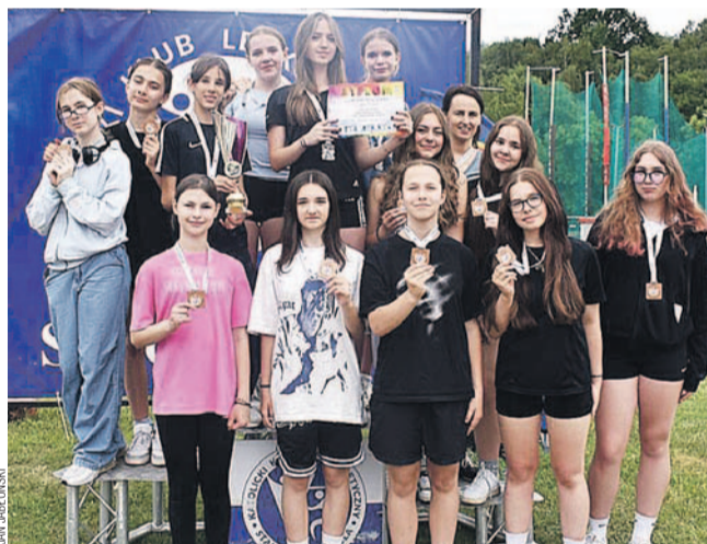
Dziewczyny z SP1 z nauczycielką

W kategorii Igrzysk Młodzieży Szkolnej na najniższym stopniu podium stanęły reprezentantki SP1, gromadząc 866 pkt. Spora w tym zasługa zawodniczek Komunalnych, które uzyskały najlepsze wyniki indywidualne w następujących konkurencjach: