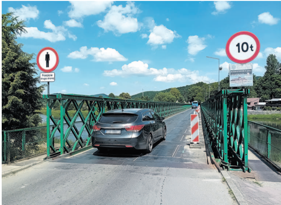
Ruch na Moście Białogórskim

Do redakcji zgłosili się mieszkańcy na co dzień żyjący po prawej stronie Sanu (Biała Góra i Międzybrodzie), zwracając naszą uwagę na rosnące natężenie ruchu drogowego w odcinku Mostu Białogórskiego oraz niekiedy niewłaściwe zachowania kierujących pojazdami.