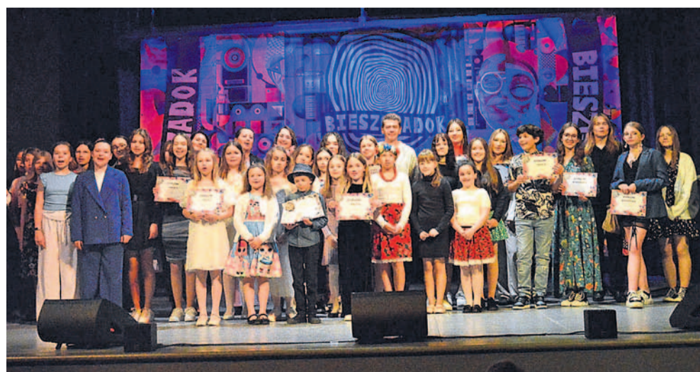
W „Bieszczadoku” wzięło udział blisko 50 solistów