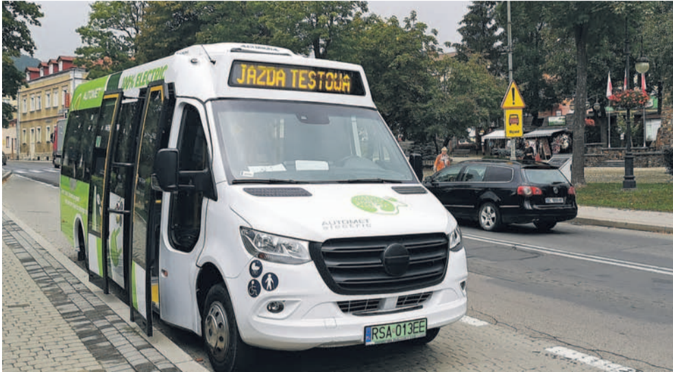
Mikrobus Automet Electric

Od pewnego czasu w kraju trwa głośnie dyskusja na temat wykorzystywania zwierzęcej siły pociągowej do transportowania turystów na Morskie Oko pod Tatrami. Niewykluczone, że rozstrzygnięcie tego problemu może mieć finał bezpośrednio związany z naszym miastem.