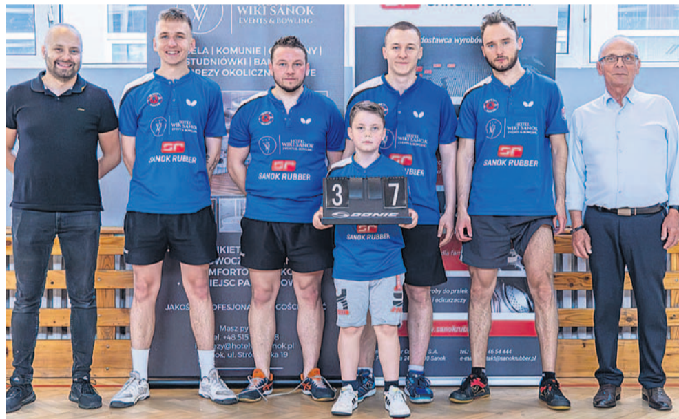
Wysokie zwycięstwo napawało optymizmem przed rewanżem

Zarząd klubu cieszy wysoką frekwencją kibiców (ponad 100 osób).