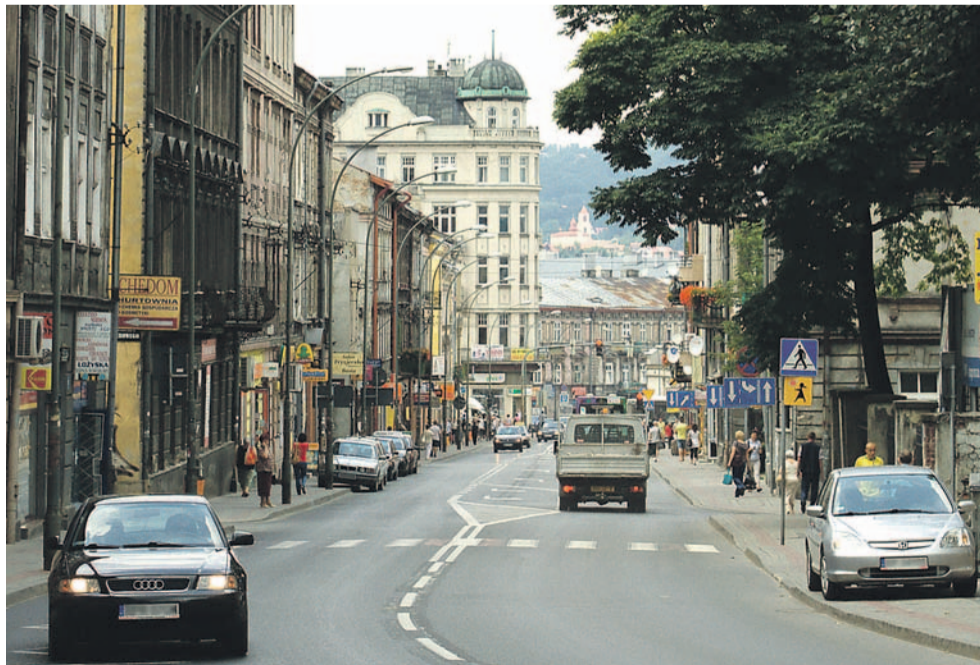
Ulica Juliusza Słowackiego w Przemyślu (2011 r.)