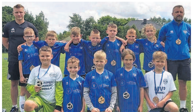
Drużyna AP w Nisku