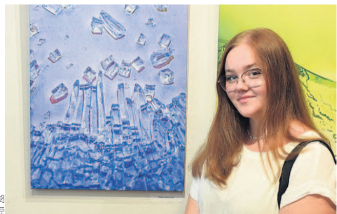
W SDK-u wystawiono fotografie inspirowane stylem W. Szulca

W Sanockim Domu Kultury można podziwiać wystawę fotograficzną „Zainspirowani”. Prace wzorowane zdjęciami Władysława Szulca wykonali uczniowie Zespołu Szkół nr 5 z kierunku technik fotografii i multimedii oraz słuchacze Policealnego Studium Animatorów Kultury w Krośnie.