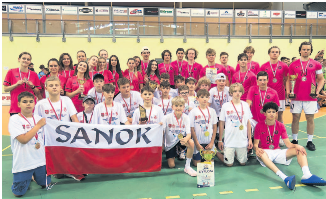
Sanockie szkoły ponownie z medalami

W Igrzyskach Młodzieży Szkolnej ich starsi koledzy fazę grupową przeszli bez utraty gola. Być może w finale udałoby się nawiązać bliższy kontakt z Nowym Targiem, gdyby nie niedyspozycja dwóch ważnych graczy.