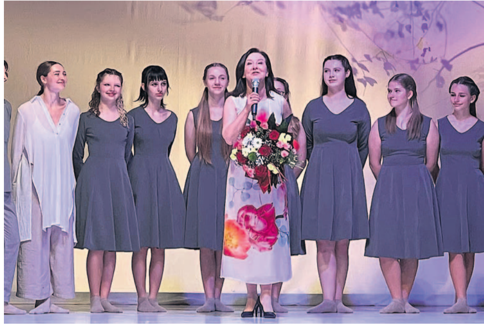
Jubileuszowy występ PRO.GRES-u

Grupa Tańca Współczesnego PRO.GRES obchodziła jubileusz 30-lecia. Z tej okazji artyści wystąpili w Sanockim Domu Kultury, prezentując specjalny spektakl „Obrazki z przeszłości”, zawierający odniesienia do historii zespołu, ale też zupełnie nowe choreografie.