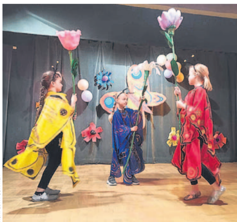
ARCH. ODK PUCHATEK