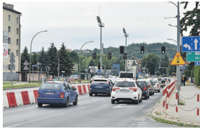
Poza godzinami szczytu ruch samochodów był dość płynny

Skrajne podpory, czyli tzw. „przyczółki”, cieszą już oczy mieszkańców, rośnie też pylon, będący najważniejszym elementem konstrukcyjnym obiektu. Ale to nie cały zakres realizowanych obecnie robót, bo drugi z wykonawców, odpowiedzialna za sprawy drogowe firma Strabag, prowadzi prace mniej widoczne – przebudowę sieci gazowej, elektrycznej i ciepłowniczej. Ostatnio nastąpiło wejście w pas drogowy ul. Królowej Bony, czego powodem była przebudowa linii energetycznej średniego napięcia, związana z powstaniem ronda.