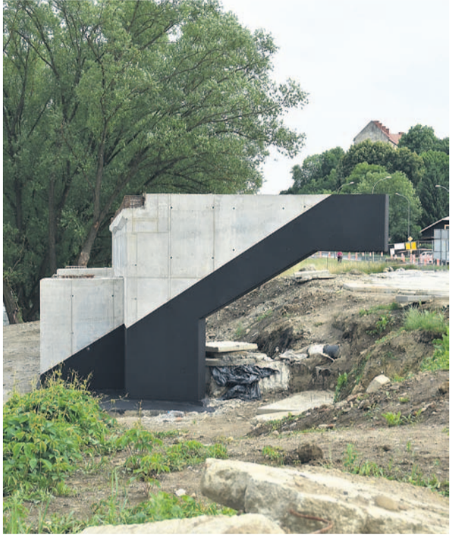
Jedna z podpór budowanego mostu (od strony centrum miasta)

Najdroższa inwestycja w historii miasta zaczyna nabierać realnych kształtów. Widać już podpory mostu, trwają też prace przy posadowieniu tzw. pylonu. Niestety, zgodnie z wcześniejszymi zapowiedziami rozpoczęły się również utrudnienia dla kierowców.