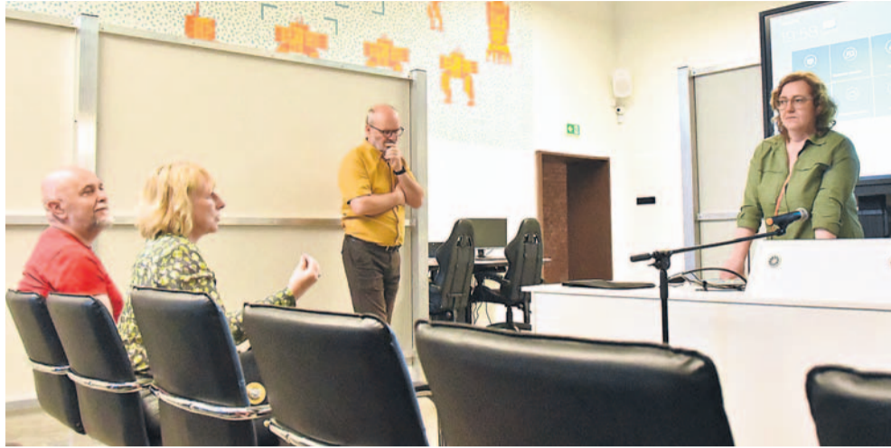
Po prelekcji wywiązała się ożywiona dyskusja