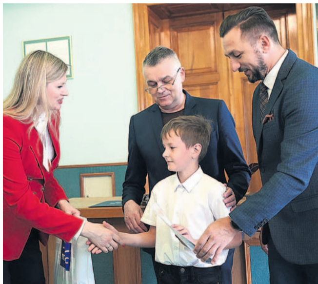
Gratulacje dla jednego z laureatów konkursu „O Pióro Burmistrza”