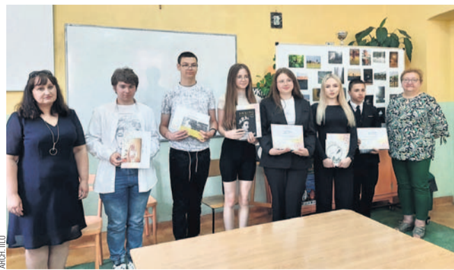
Uczestnicy konkursu wraz z organizatorkami

Prace konkursu fotograficznego „Pod urokiem chwili...” oceniało nie tylko jury, mogli