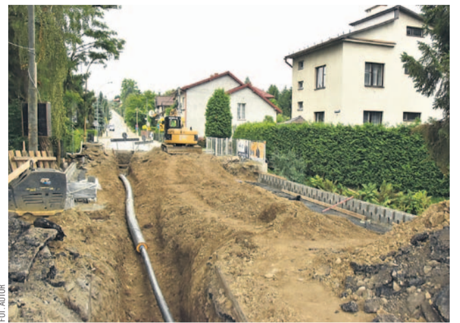
Aktualny stan przeprawy na ul. Bartosza Głowackiego

Wracamy do tematu postępu prac na moście nad Potokiem Płowieckim, będącym częścią ulicy Głowackiego. W ostatnich dniach pojawiły się bowiem głosy o rzekomym ponownym opóźnieniu inwestycji.