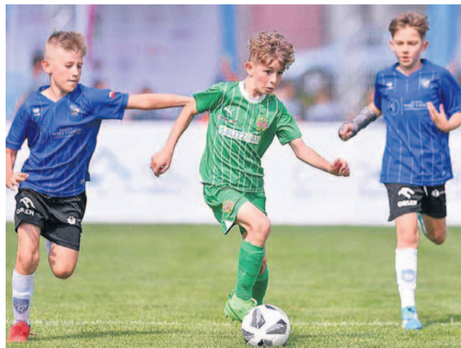
Zawodnicy AP w meczu z Rapidem Wiedeń

Reprezentacja AP U-10 uczestniczyła w XIII Międzynarodowym Turnieju Sokolika w Starym Sączu. W rywalizacji brały udział zespoły z całej Europy.