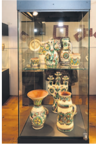
Ekspozycje z Sanoka w Krakowie

W swych wielowiekowych murach nasz zamek kryje m.in. bogate zbiory archeologiczne, historyczne, sztukę sakralną, malarstwo i twórczość Zdzisława Beksińskiego. Turyści przyjeżdżający do Sanoka mogą godzinami oglądać świetne wystawy.