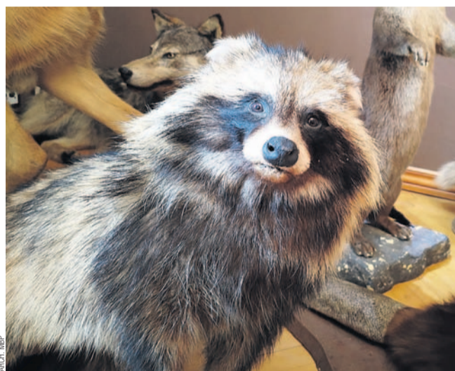
Jedno ze spreparowanych zwierząt

„Republika marzeń. Biblioteka ośrodkiem aktywizacji społeczności lokalnych” w programie BLISKO (2023-2024), dofinansowanym ze środków Ministra Kultury i Dziedzictwa Narodowego, w ramach realizacji Narodowego Programu Rozwoju Czytelnictwa 2.0 na lata 2021-2025, Kierunek interwencji 4.1.