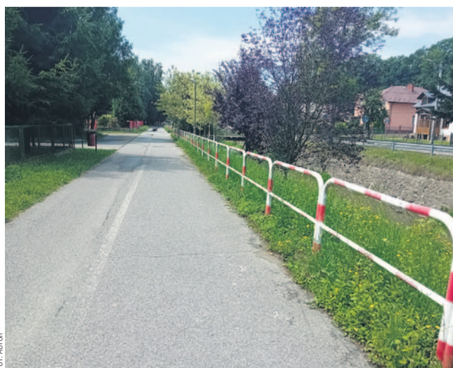
Fragment ścieżki z zatartym oznaczeniem

stów, uległa praktycznie zupełnie zatarciu. Wobec tego obecnie nie wiadomo kto z użytkowników jest uprawniony do korzystania z danego