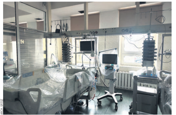
Zestaw pomp infuzyjnych otrzymanych przez szpital w ubiegłym roku