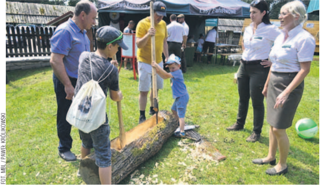
Jedna z atrakcji „Leśnego pikniku”

W tym roku 100-lecie istnienia obchodzą Lasy Państwowe, powołane w 1924 r. Z tej okazji organizowane są różnego rodzaju imprezy. Jedną z tych, która odbyła się na terenie Sanoka, były zawody drwali. Z kolei następnego dnia w skansenie zaplanowano Leśny Piknik, na którym nie zabrakło atrakcji dla dzieci i dorosłych.