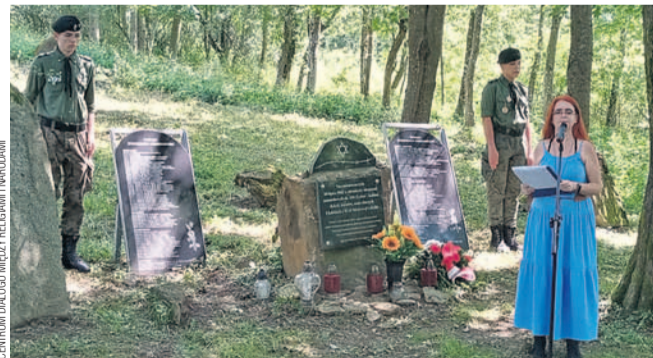
Uroczystości na terenie kirkutu w Woli Michowej

W Woli Michowej upamiętniono ofiary masowego mordu z 1942 roku, podczas którego nazistowscy Niemcy eksterminowali około 150 osób narodowości żydowskiej. Uroczystości miały miejsce na terenie kirkutu, a włączyło się w nie kilka organizacji.