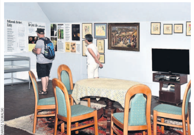
Wystawa poświęcona Januszowi Szuberowi

Miejska Biblioteka Publiczna i Muzeum Historyczne zapraszają na wystawę poświęconą poecie Januszowi Szuberowi. Na poddaszu Zamku Królewskiego obejrzeć można liczne pamiątki z nim związane.