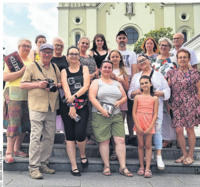
Grupa Urban Sketchers świętuje pierwsze urodziny

Lokalna grupa Urban Sketchers świętowała pierwsze urodziny na placu św. Michała. Nie mogło zabraknąć tortu i rzecz jasna warsztatów rysunkowych. Wręczono też nagrody i wyróżnienia za konkurs „Lato”.