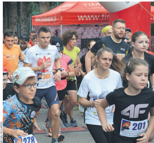
Start ubiegłorocznej edycji

Nie zwlekaj! Zapisz się już dziś. Wypełnij formularz, który znajdziesz na stronie biegu w portalu timekeeper, w wykazie zawodów. Regulamin dostępny na witrynie internetowej organizatora: maksymilian.przemyska.pl/bieg/. Polecamy też śledzić fanpage na facebooku.