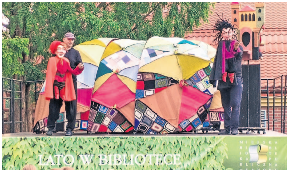
Przedstawienie w ogrodzie przy bibliotece

W ogrodzie przy bibliotece odbył się spektakl dla dzieci pt. „Mama bohatera”, wystawiony przez katowicki Teatr „Gry i Ludzie”. To już kolejna wizyta tej trupy aktorskiej w naszym mieście.