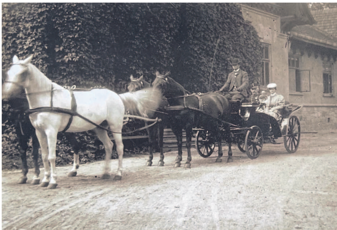
Bryczka przed dworem