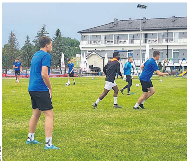
Nowy skład Wiki oparty będzie głównie na młodzieży AP