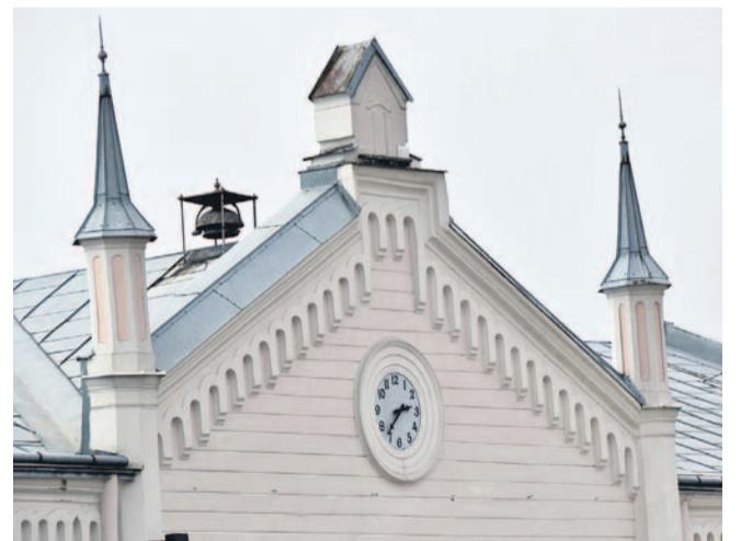
Zegar na ratuszu z „zamrożonymi” latem wskazówkami

Od wielu już dni osoby zerkające w stronę zegara na starym ratuszu przy rynku nie mogą uzyskać informacji, którą to urządzenie powinno podawać.