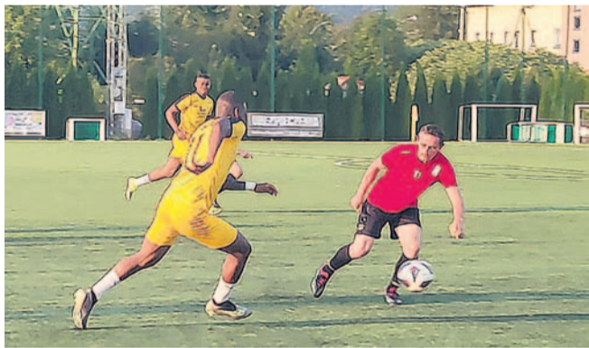
Wiki (żółte stroje) pokonało Pakoszówkę

Przeorganizowany zespół Wiki rozegrał pierwszy mecz kontrolny. Przeciwko młodzieżowym graczom stanęła doświadczona ekipa Pakoszówki. Górą byli zawodnicy dopiero wkraczający w świat dorosłej piłki.