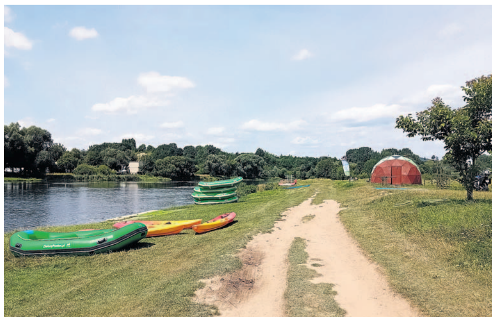
Nabrzeże Sanu zajęte przez sprzęt do spływu