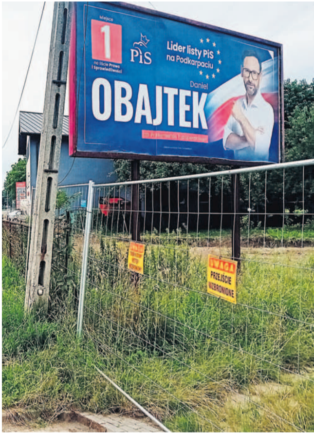
Billboard wyborczy przy ul. Królowej Bony

Z drugiej strony § 6a przewiduje, że wspomniany obowiązek nie dotyczy sytuacji, w której materiały znajdują się na nieruchomościach, obiektach lub urządzeniach niebędących własnością Skarbu Państwa, państwowych osób prawnych, jednostek samorządu terytorialnego, ich związków lub stowarzy-