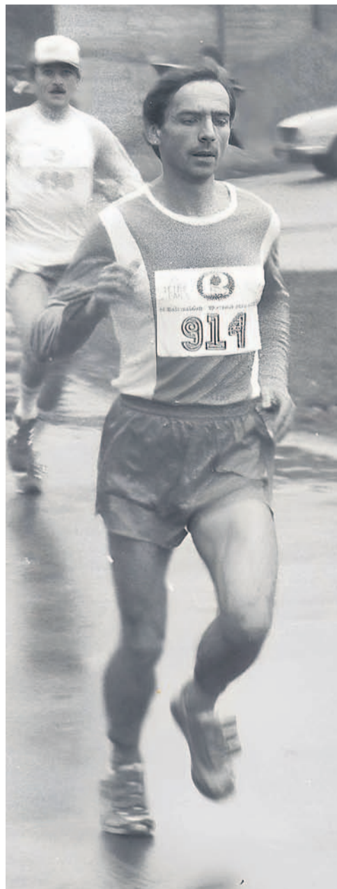
Na zawodach w słynnych Pumach na rzepey