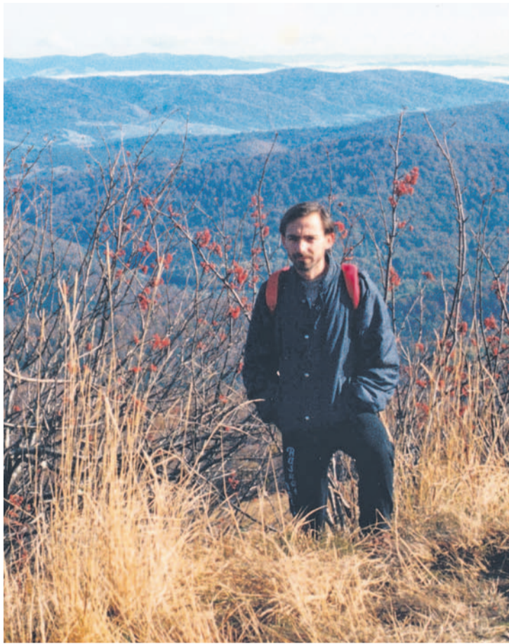
Jego drugą pasją były górskie wędrówki, tu w Bieszczadach