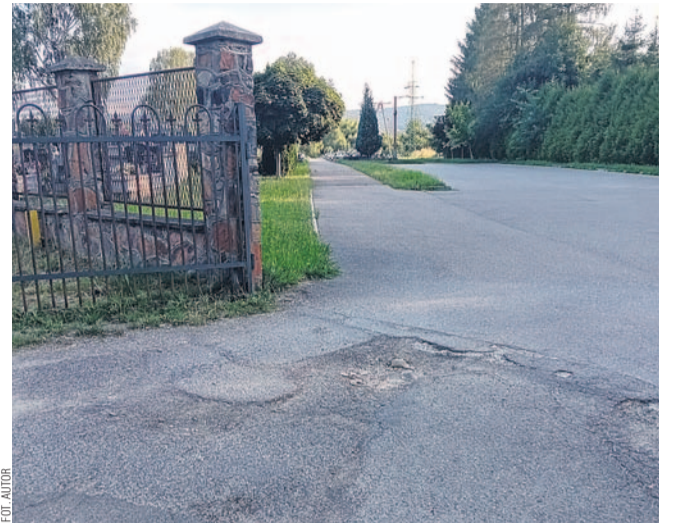
Wjazd na teren cmentarza przy ul. Lipińskiego