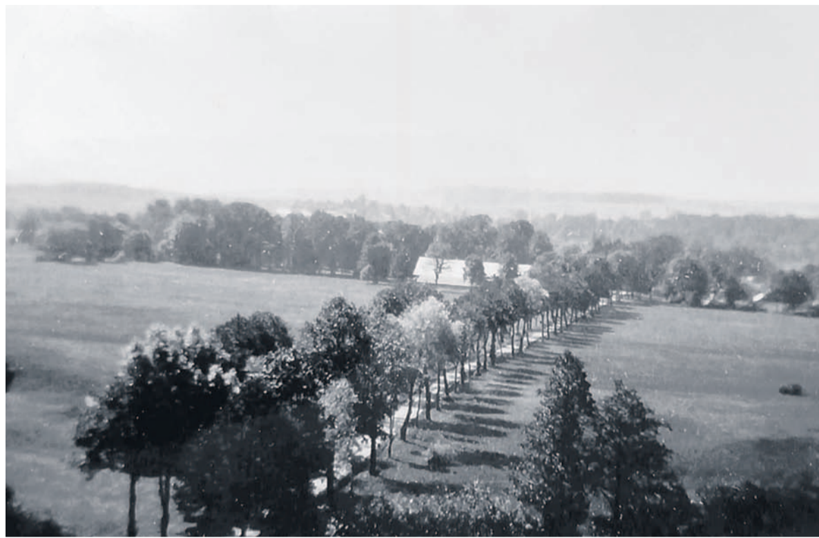
Aleja dojazdowa do dworu

Dziś przejdziemy do finalnego omówienia zabudowań oraz infrastruktury majątku w najnowszych czasach aż do współczesności oraz planów na przyszłość.