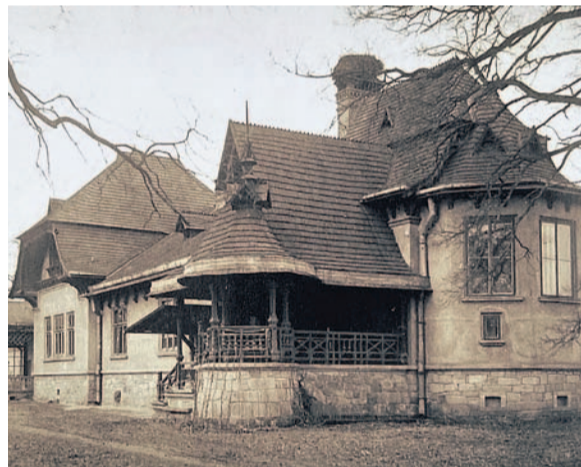
Budynek dworski od strony północnej (w przeszłości) i stan zabudowań wiosną 2024 r.