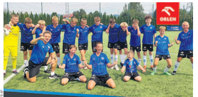
Trampkarze młodzi AP

Powoli rozpoczyna się sezon drużyn stanowiących zaplecze sanockich klubów. Póki co zanotowano następujące wyniki.