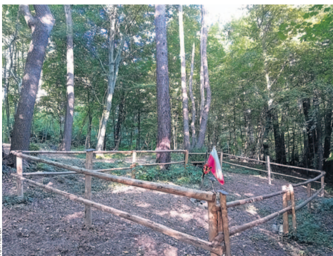
Miejsce pamięci w Olchowcach – teren poszukiwań

Przyjmuje się, że wśród zamordowanych w Olchowcach byli zarówno cywile, jak i członkowie organizacji kon-