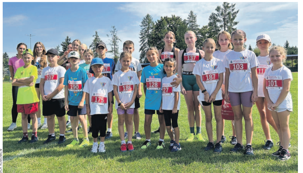
Reprezentacja Komunalnych w Brzozowie