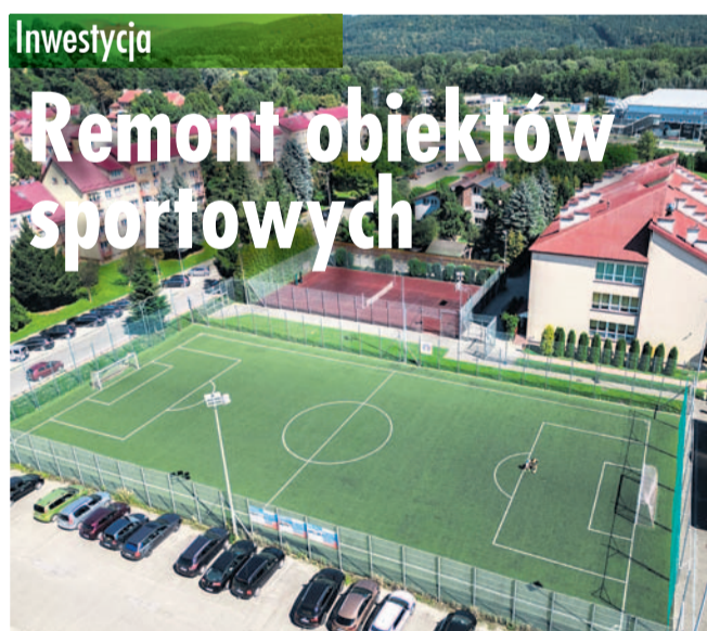
„Orlik” przy SP1

Miasto poprawi stan dwóch „orlików”. Stanie się to dzięki władzom centralnym, które pokryją połowę kosztów prac.