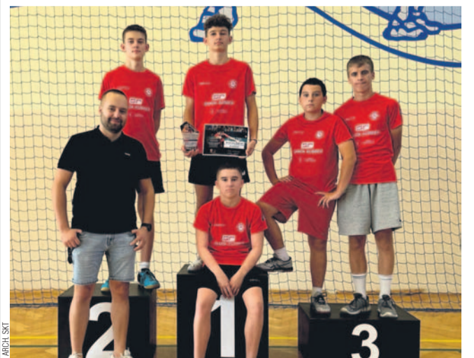
SKT na turnieju w Błażowej