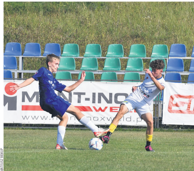
Mecz stalowców z łańcucką imienniczką

Bramki: Karnas 5 (4, 6, 45, 54, 55), Świder 5 (15, 18, 44, 47, 60), Piszko 2 (17, 58), Janiec (39), Furdak (70).