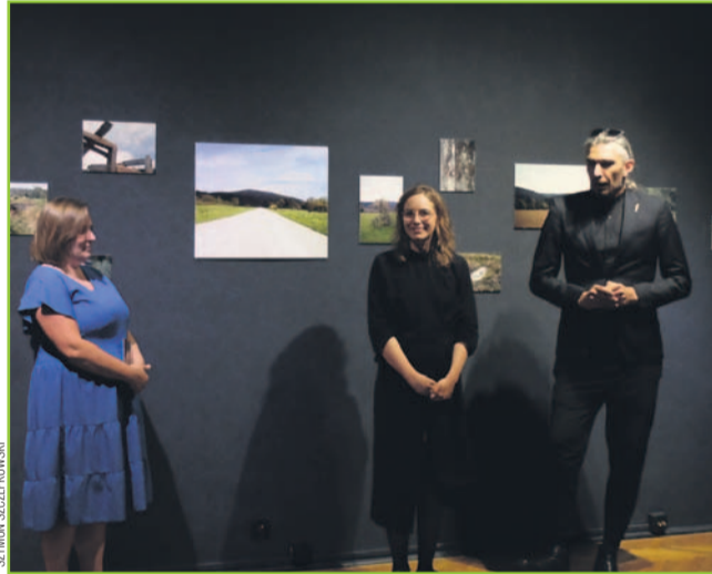
Po prawej bohaterowie wystawy w BWA Galerii Sanockiej

Stworzony został zapis przeszłości, śladów ludzi w tęt-