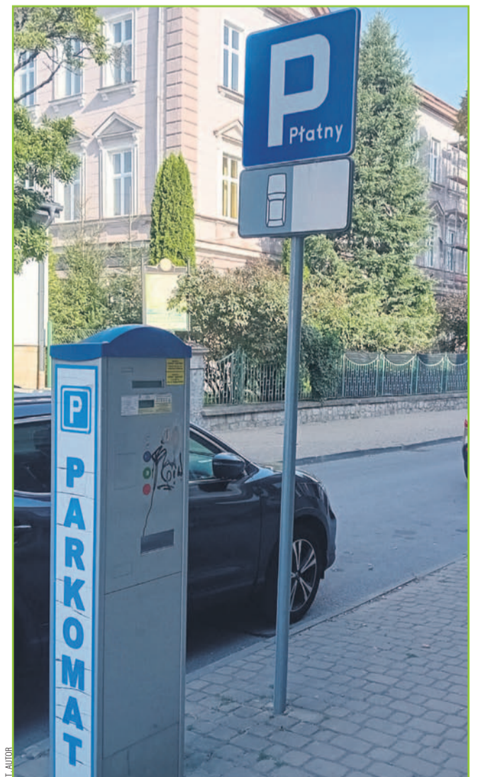
Strefa Płatnego Parkowania przy ul. Jana III Sobieskiego