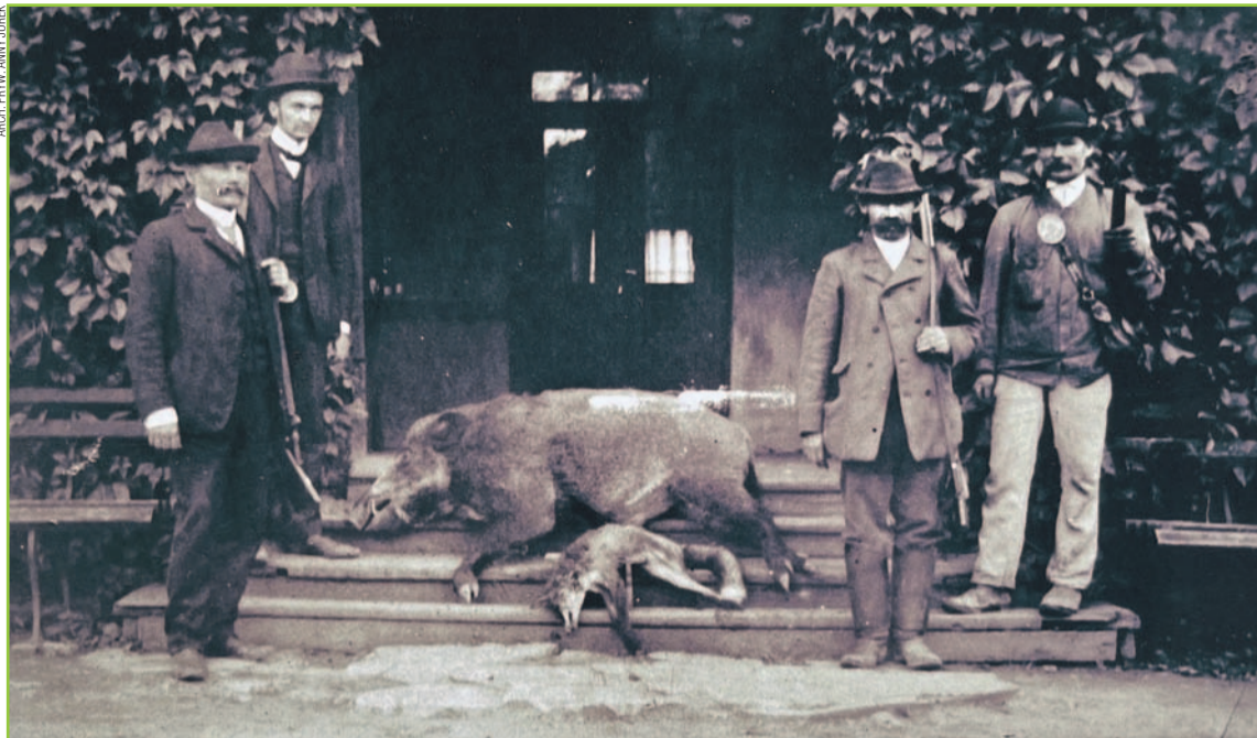
Uczestnicy polowania przy dworze