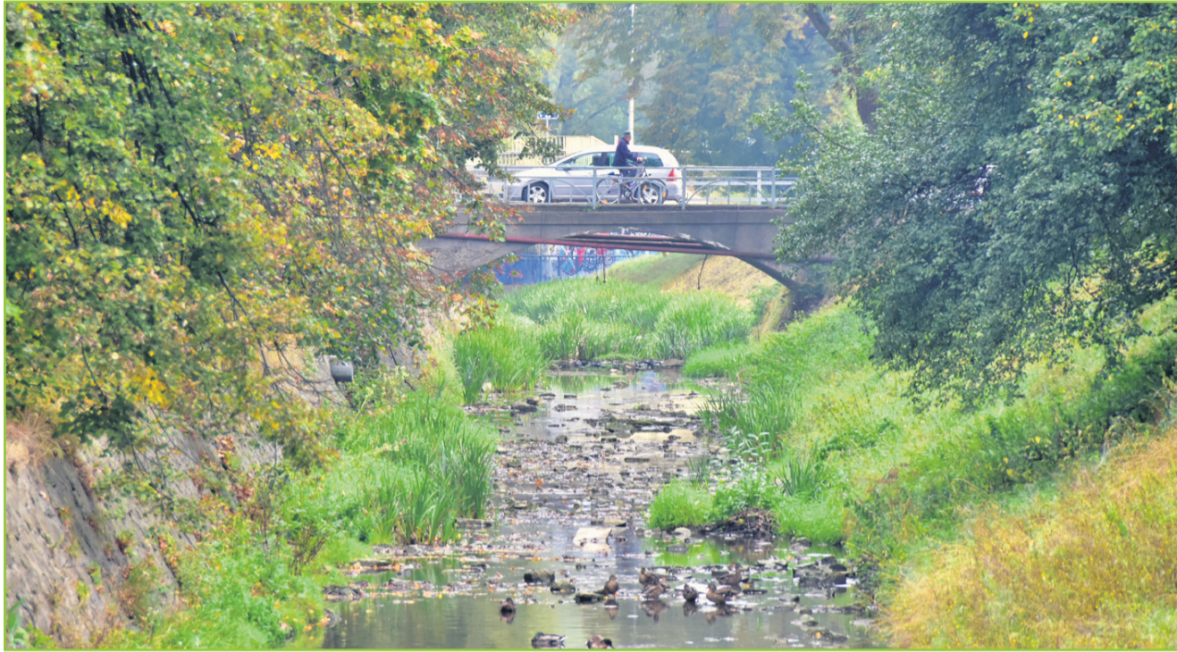
Potok Płowiecki przy ul. Podgórze