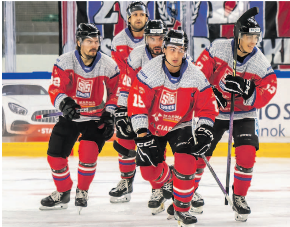
Hokeiści Texom STS-u już dziś rozpoczyna nowy sezon rozgrywek THL

Rusza nowy sezon Tauron Hokej Ligi, oczywiście z udziałem drużyny STS-u, której sponsorem tytularnym została firma Texom. Trudno z góry wyrokować, jakie będą to rozgrywki dla naszego zespołu, choć kończący cykl sparingów mecz z Podhalem Nowy Targ dał kibicom sporą dawkę optymizmu. Pierwsze odpowiedzi poznamy już w najbliższy weekend – dzisiaj sanoczanin rozpoczyna walkę o punkty wyjazdowym spotkaniem z GKS Katowice, a w niedzielę domowy pojedynek z GKS Tychy. Poniżej pełny terminarz gier STS-u w sezonie zasadniczym.