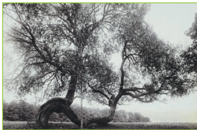
Drzewo w parku