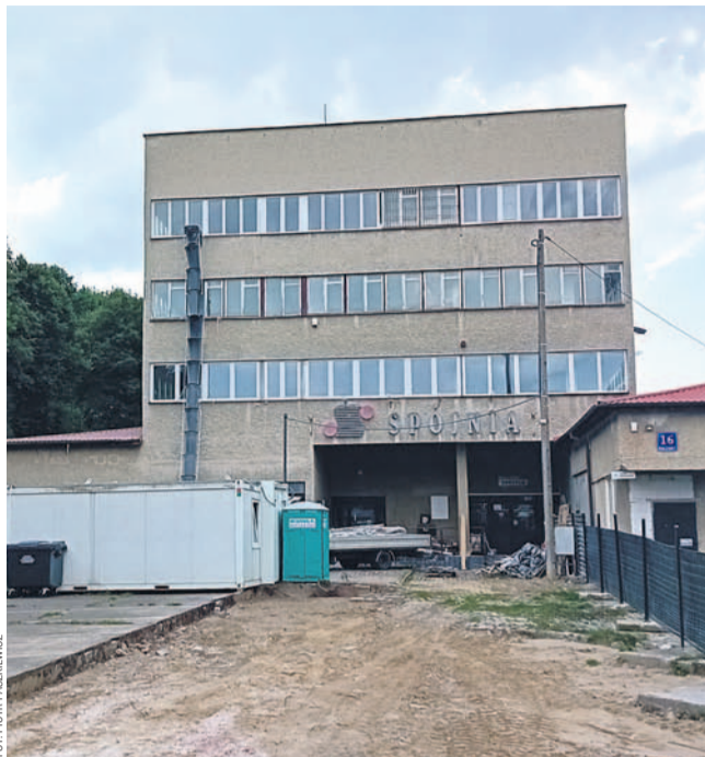
Stan budowy pod koniec sierpnia