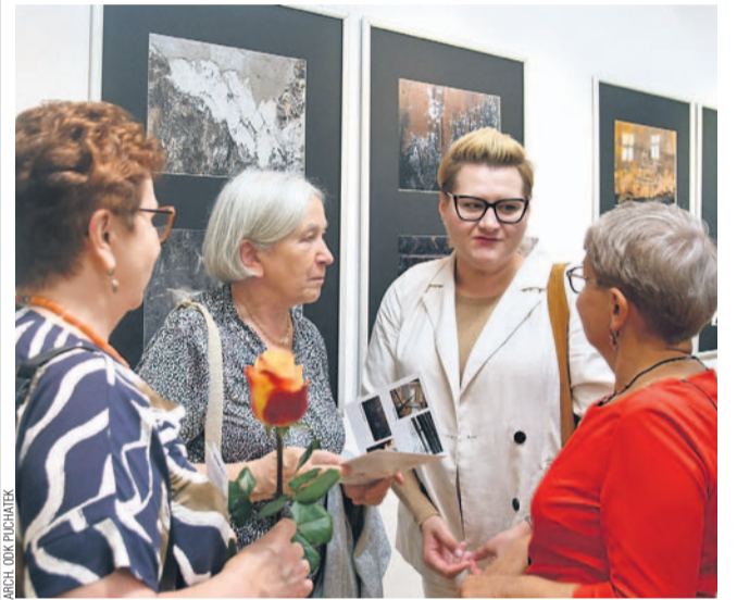
Kadr z wystawy

Wystawa w „Puchatku” czynna będzie do 11 października (w godzinach 14-19).