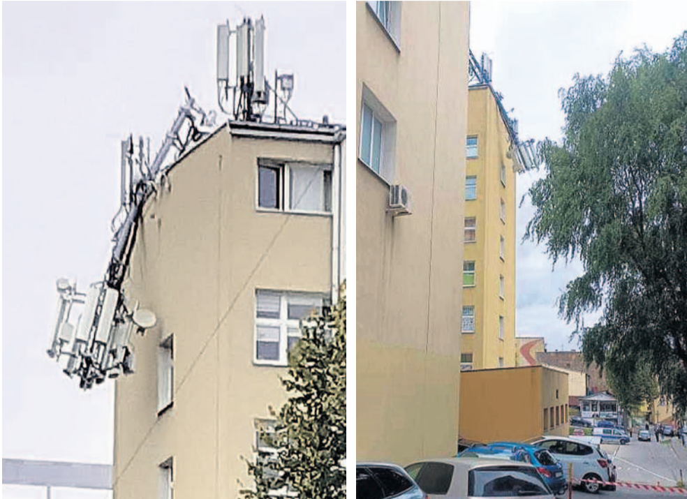
Budynek przy ul. Kościuszki 23

We wtorek doszło do niecodziennego przypadku technicznego. Otóż przewróceniu uległ maszt stojący dotąd na wielopiętrowym budynku przy ul. Kościuszki 23.