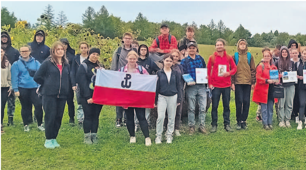
Uczestnicy po zakończeniu rajdu

Przed tygodniem odbyły się wydarzenia przywołujące podjęcie i zakończenie polskiej działalności podziemnej w trakcie II wojny światowej.