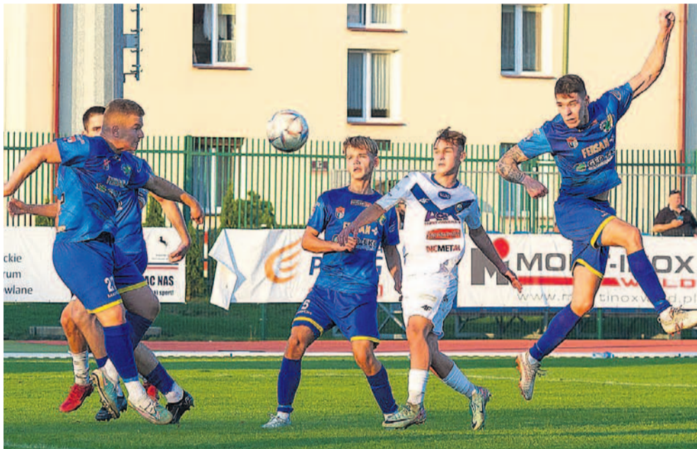
Stalowcy doznali zaskakującej porażki na własnym boisku

Tydzień po zwycięstwie 3:0 w Kamieniu – analogiczna porażka u siebie, do tego z niższym notowanym rywalem. O wyniku zdecydowały głównie trzy rzuty karne dla gości, podyktowane w ciągu... 5 minut. To chyba jakiś rekord Guinnessa.