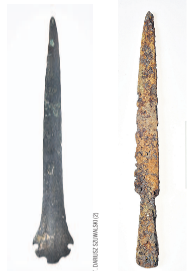
Sztylet z epoki brązu

Trzech członków Stowarzyszenia Eksploracyjno-Historycznego Galicja zostało uhonorowanych przez nasze muzeum. Dzięki nim do zbiorów placówki trafiły niezwykle cenne zabytki archeologiczne. Należy podkreślić, że zostały pozyskane w trakcie legalnie prowadzonych poszukiwań na terenie Bieszczadów.