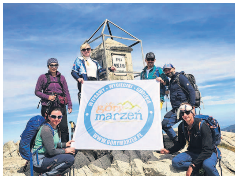
Szczyt Musaly – najwyższy w Bułgarii

Na przeciwnym biegunie do nich, występujących m.in. w krajach Beneluksu, Bałtyckich czy Mołdawii, leży siedmiotysięcznik Chan Tengri. Położony jest u zbiegu granic trzech państw: Kirgistanu, Kazachstanu i Chin. Na mapie fizycznej jest to już Azja, ale uwzględniając mapę polityczną, pozostajemy w Europie – i to jest właśnie element wersji rozszerzonej (podobnie jest z rosyjskim