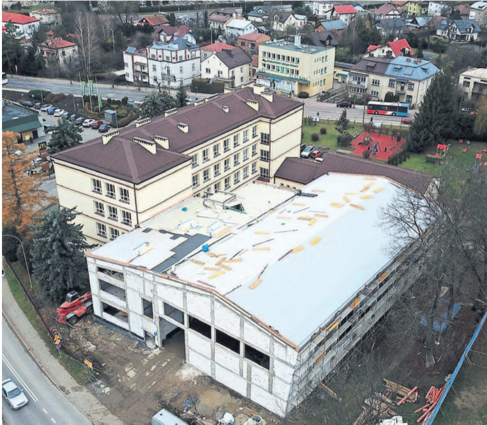
Dyrektor szacuje zaawansowanie prac na 70%

Trwa budowa hali sportowej i modernizacja Szkoły Podstawowej nr 2 im. Św. Kingi. Najważniejsza w ostatnich latach inwestycja w oświatę rośnie w oczach. Uczniowie powinni rozpocząć zajęcia w nowym obiekcie w przyszłym roku.