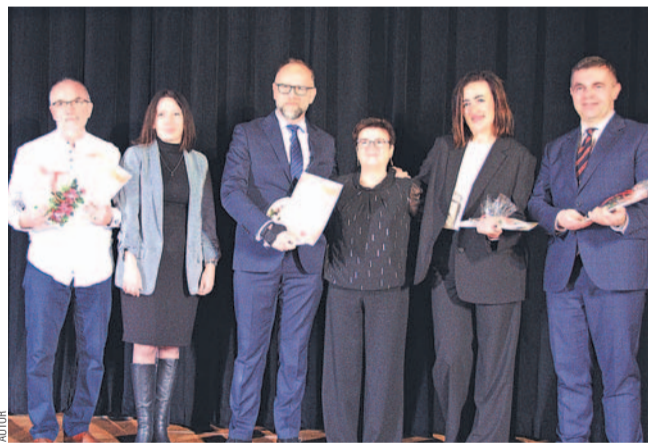
Honorowi Wolontariusze wraz z prezes PCW (w środku)