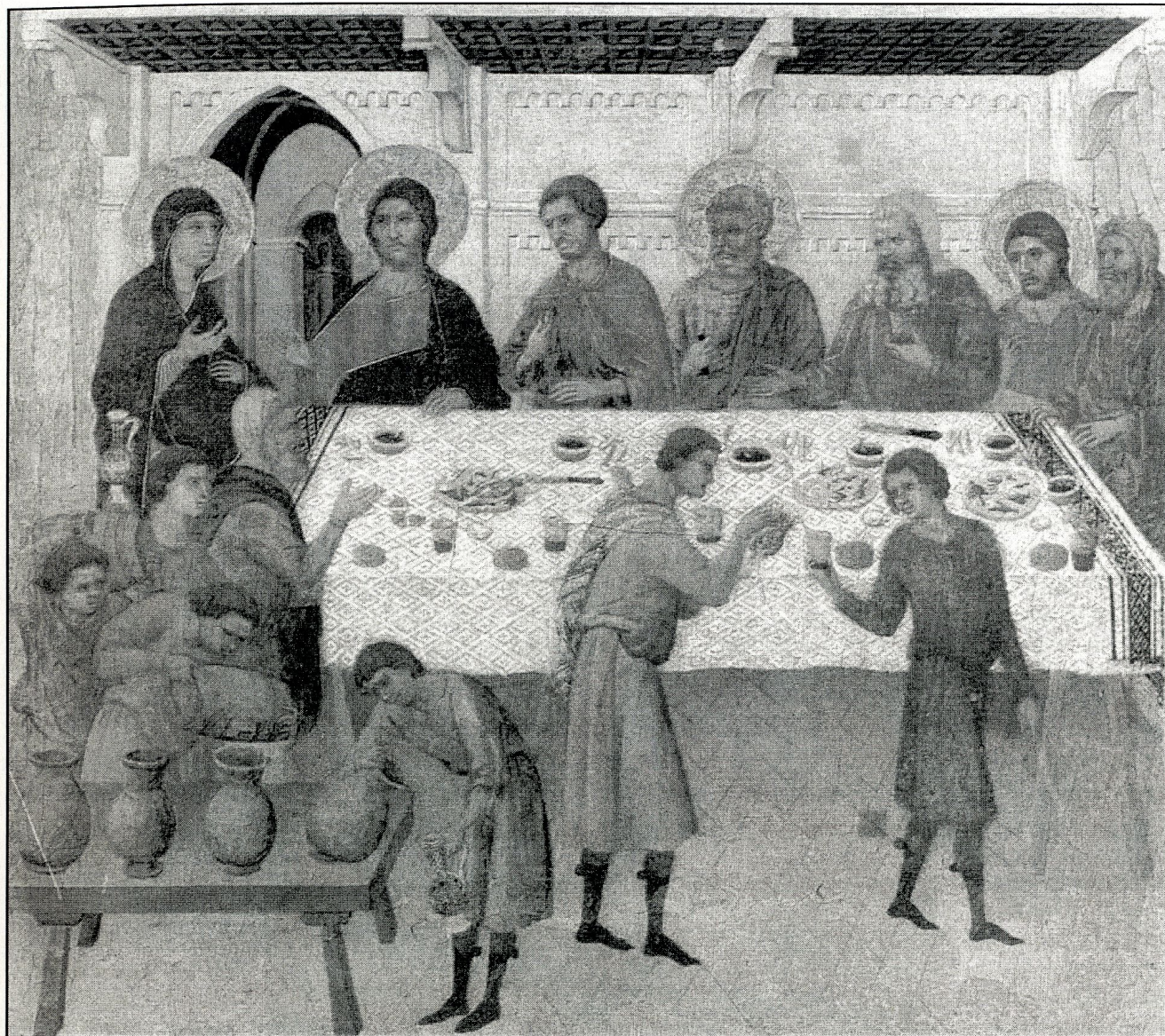
Duccio di Buonisegna, Wesele w Kanie, fragment ołtarza „Maesta”, Muzeum Katedralne w Sienie, 1308 – 11 r.

o swoje miejsce, swoje prawa, o swój kąt. Nikt nie chciał ustąpić. Pogoń za pieniądzem, za świętym spokojem, za tym co oferuje ten świat, spowodowała, że przed 10 laty, po 20 latach małżeństwa, dopadł na kryzys. Gigantyczny”