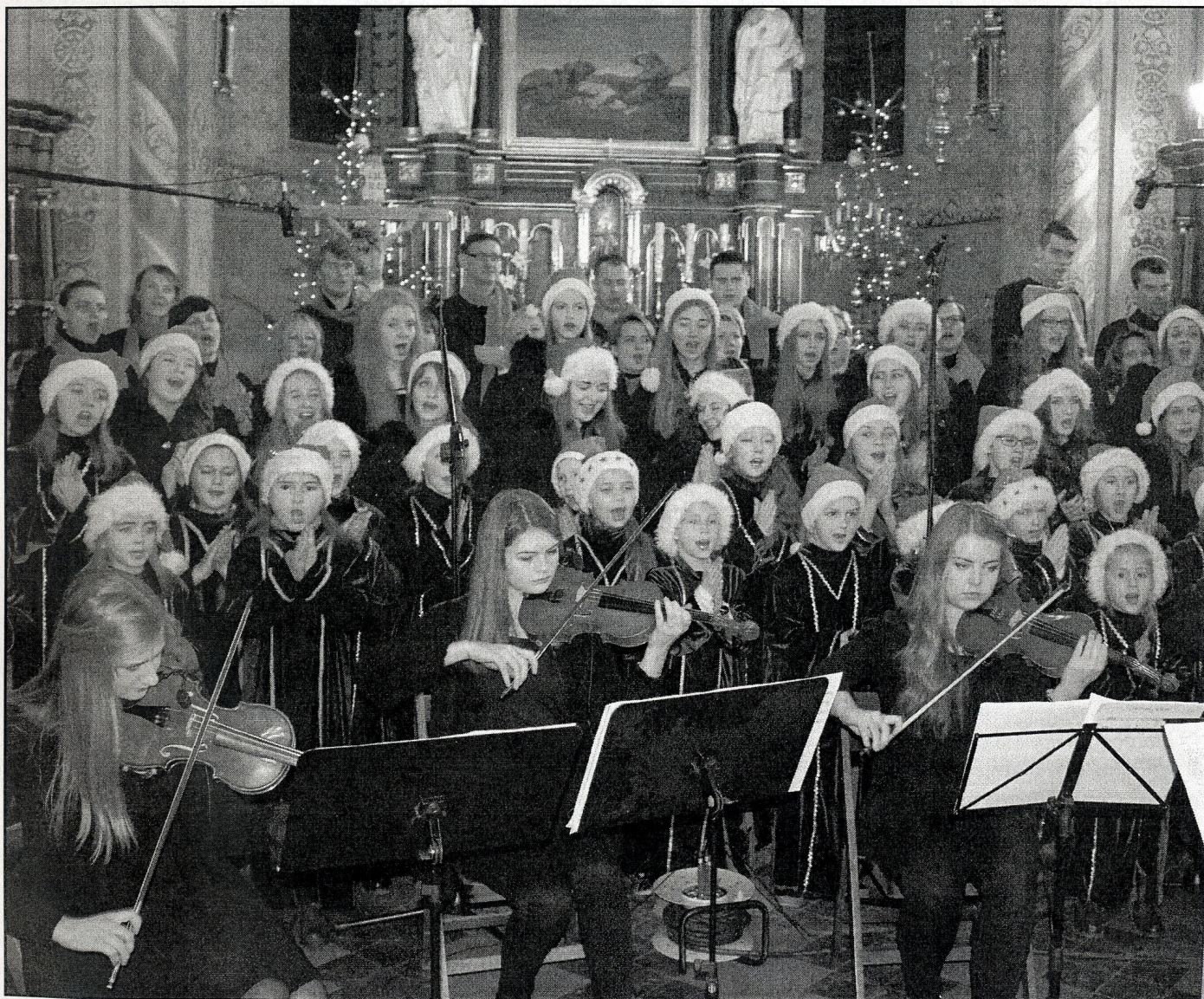
Kolędują połączone zespoły: „Souliki”, „Soul” i „Sonores” przy akompaniamencie kwartetu smyczkowego