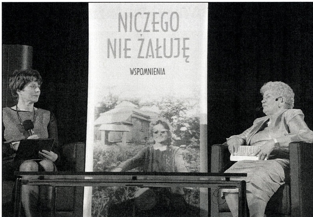
Bohaterka wieczoru jest dobrze znana sanoczanom. Sprawdziła się w roli niezawodnej księgowej, starościny i propagatorki wolontariatu.

nicy. Ten moment z niejednych oczu wycisnął łzy wzruszenia.