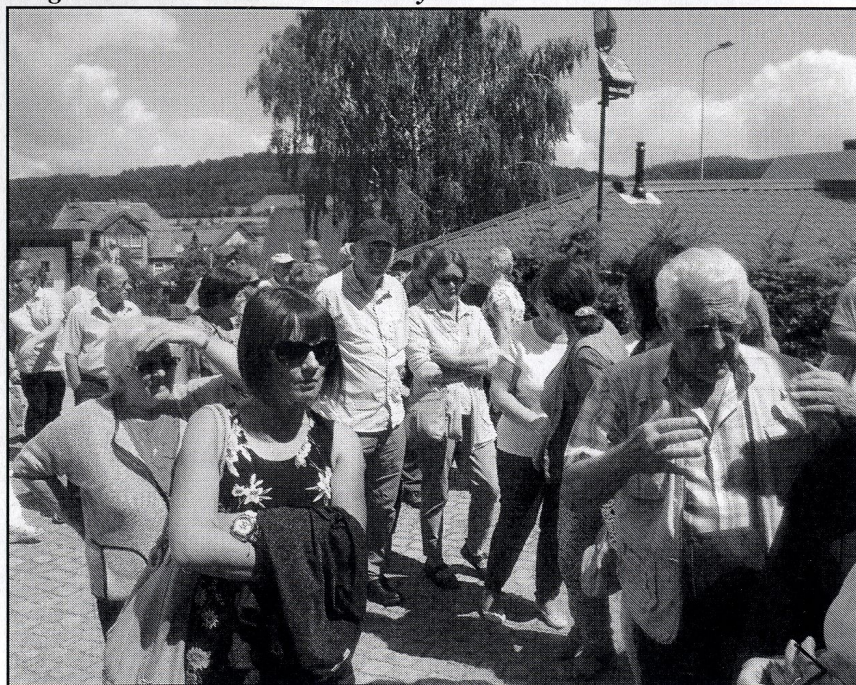
Nasza grupa w kolejce do Kaplicy