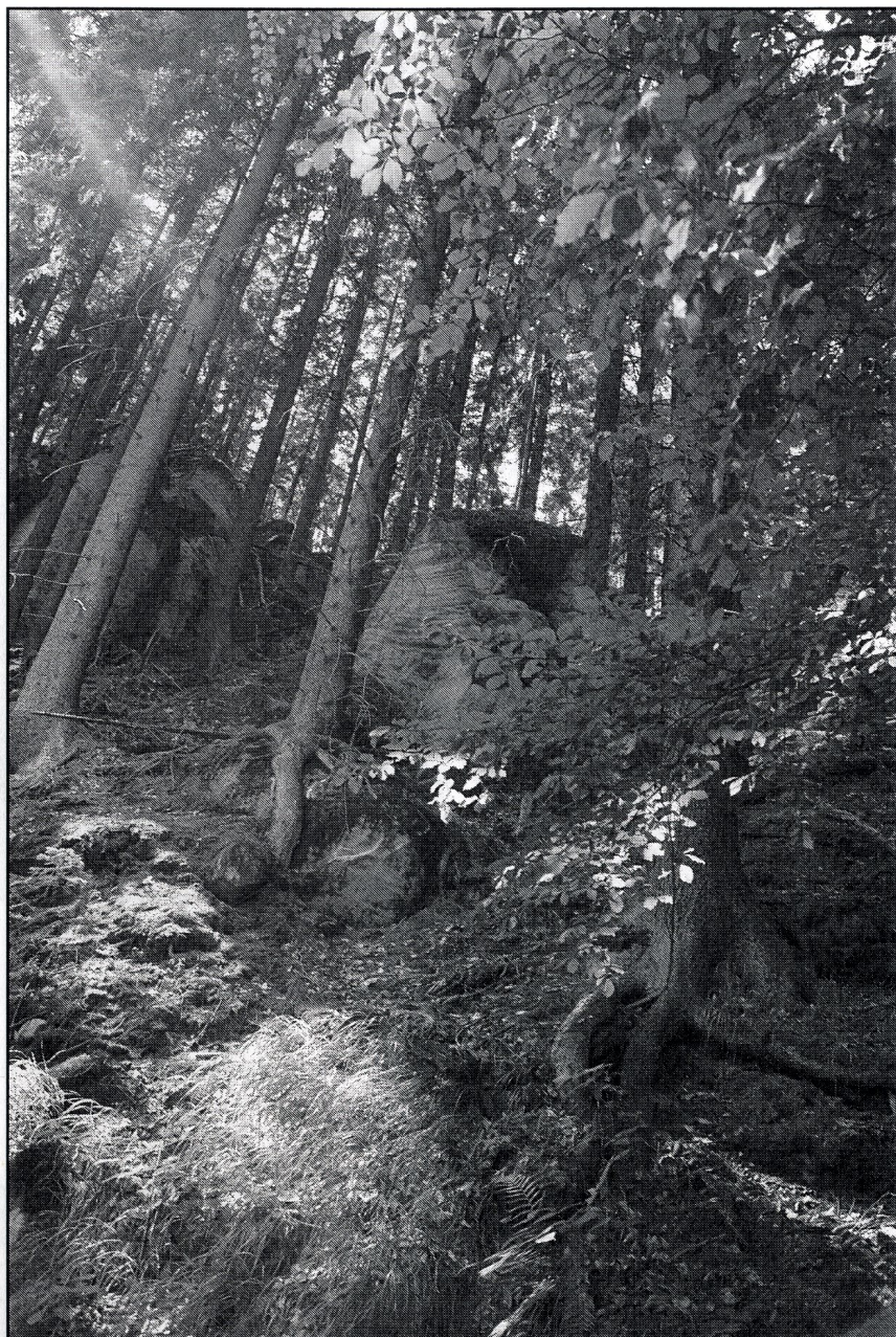
Fragment Parku Narod. Gór Stołowych