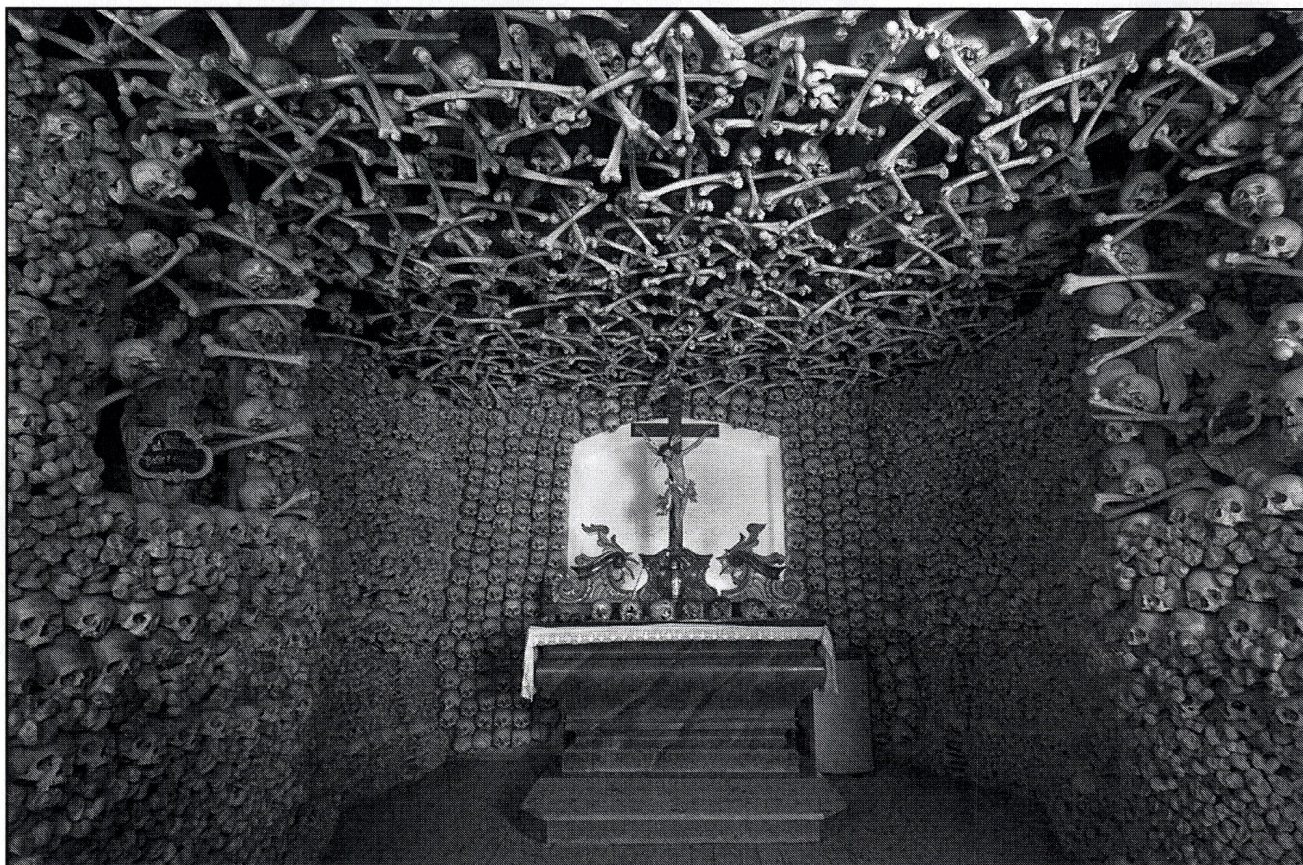
Wnętrze Kaplicy Czaszek

stoi dzwonnica, zbudowana w 1603 r. jako baszta o przeznaczeniu wojskowym.