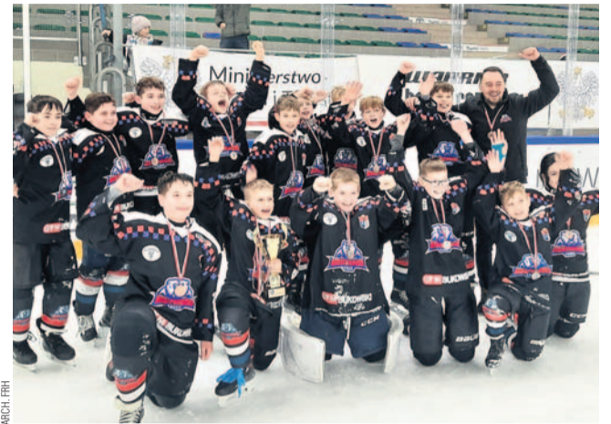
Drużyna Niedźwiadków wywalczyła 3. miejsce

wiadki, zajmując 3. pozycję. Zwyciężył zespół Patriot Winnica z Ukrainy, w finale pokonując 3:2 łotewski HK Prizma.