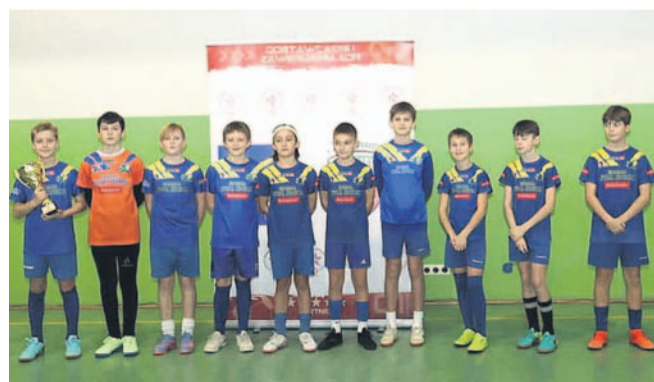
Drużyna Ekoballu z rocznika 2013 odniosła turniejowe zwycięstwo

Końcówka 2024 roku była bardzo udana dla naszych drużyn młodzieżowych. Zespoły Ekoballu Stal plasowały się na podium Turnieju ADR Kolejarz Zagórz Cup, natomiast Akademia Piłkarska na VI Bożonarodzeniowym Turnieju w Sieniawie.