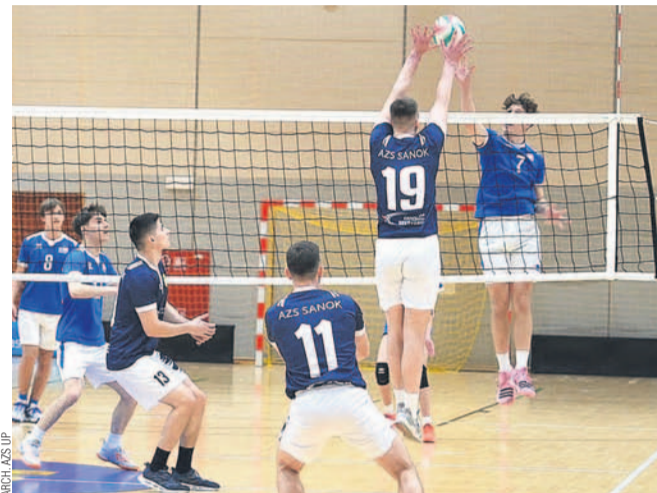
Siatkarze AZS UP odnieśli turniejowe zwycięstwo bez straty seta

Turniej pierwszy raz miał charakter międzynarodowy, bo startowała m.in. drużyna z Humenného na Słowacji. Mimo to dominowały nasze zespoły, zajmując całe podium – wygrała ekipa Uczelni Państwowej przed I Liceum Ogólnokształcącym i Zespołem Szkół nr 2.