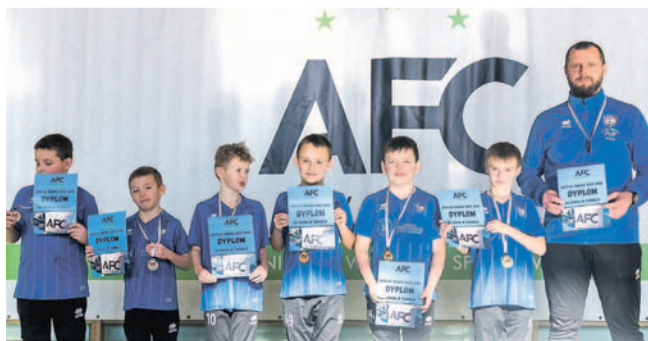
Drużyna AP na turnieju w Krośnie

Inne drużyny AP grały na CFT Winter Cup w słowackim Vranovie. Roczniak 2015 (trener Jakub Gruszecki) zajął 6. pozycję, natomiast rocznikowi 2017 (Marcin Siwiński) przypadła 7. lokata.