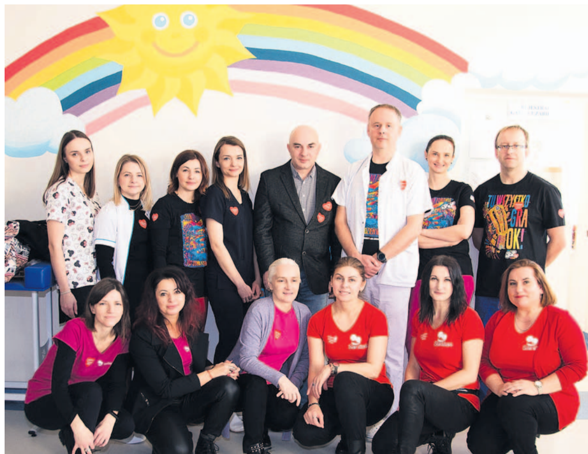
Orkiestra zagrała też w szpitalu