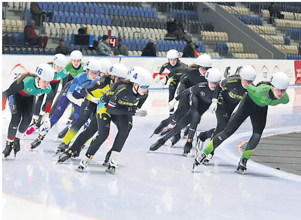
Kadr z biegu masowego, w którym startowały panczenistki Górnika