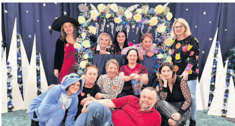
Organizatorzy Balu Karnawałowego