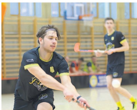
Jokerzy wygrali turniej unihokeja