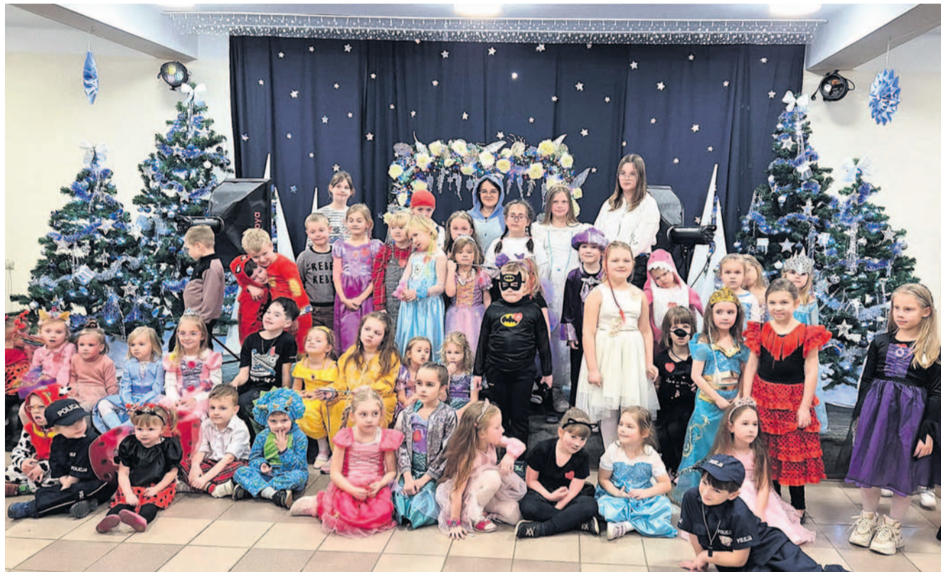
Na bal przyszło mnóstwo dzieci

W niedzielę ruszy 33. Finał Wielkiej Orkiestry Świątecznej Pomocy. Zbiórki i aukcje na onkologię i hematologię dziecięcą trwają już od jakiegoś czasu. Za nami kilka wydarzeń wpisujących się w akcję, m.in. Biała Sobota w Szpitalu Specjalistycznym, Bal Karnawałowy w Zespole Szkół nr 5 czy II Amatorski Turniej o Puchar Elikssiru w Uczelni Państwowej.