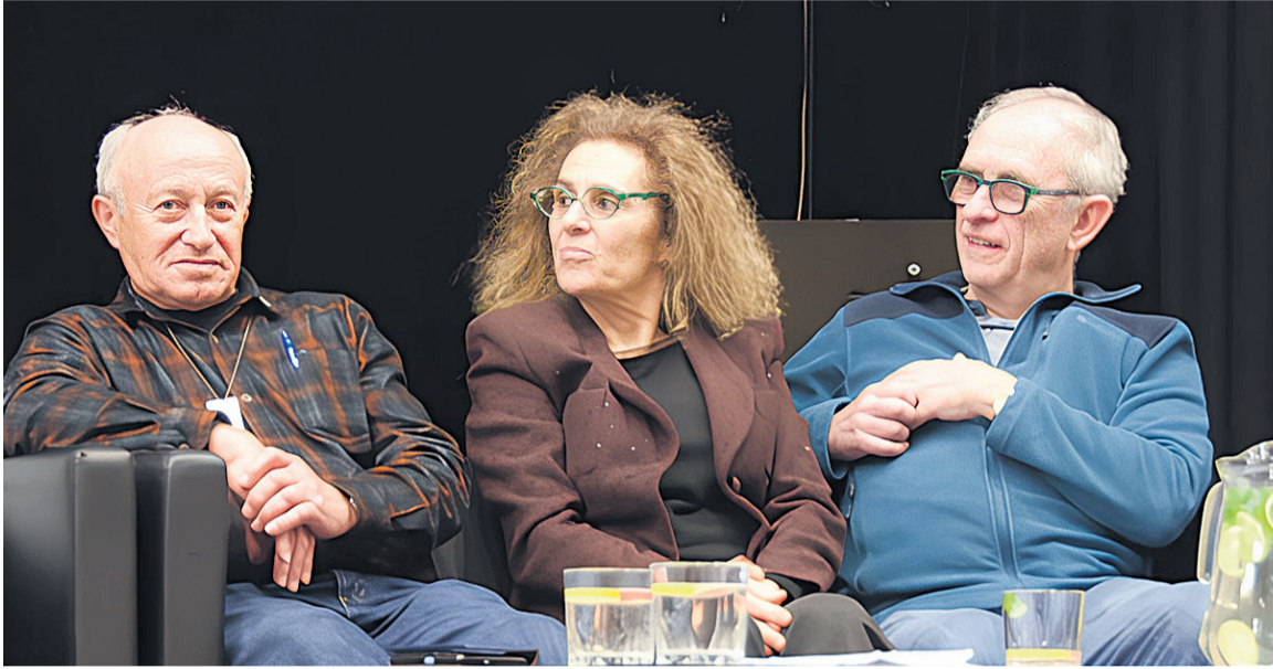
Przedstawiciele drugiego pokolenia ocalałych z Holokaustu

Po raz 17. obchodziliśmy Międzynarodowy Dzień Pamięci o Ofiarach Holokaustu na Podkarpaciu. Wydarzenie zgromadziło przedstawicieli władzy, instytucji kulturalnych, duchowieństwa, młodzieży szkolnej oraz gości z Izraela i Stanów Zjednoczonych. To podkreśliło międzynarodowy wymiar refleksji nad tragedią Szoah, jak inaczej nazywana jest zagłada Żydów.