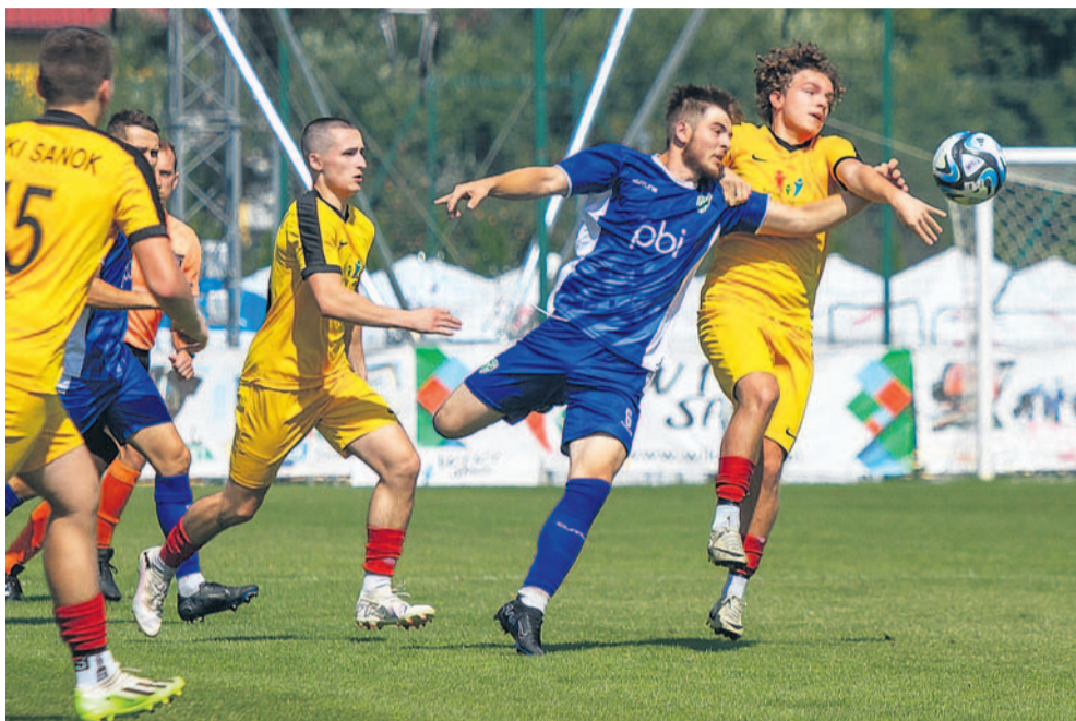
Piłkarze Wiki (żółte stroje) udanie rozpoczęli sparingi przed runda wiosenną