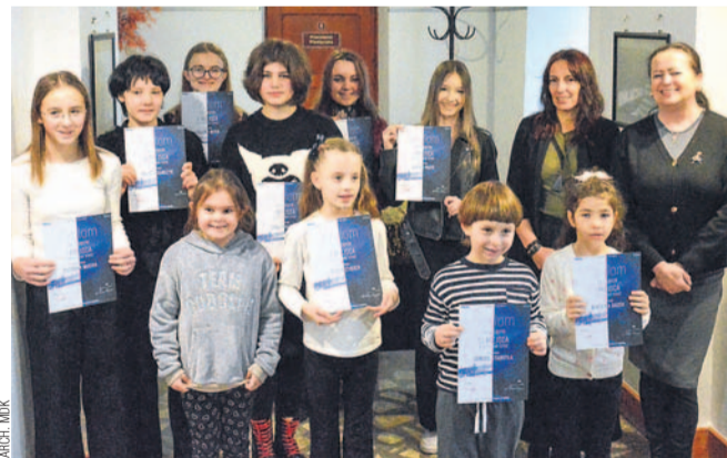
Laureatki wraz z organizatorkami