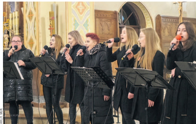
Cassiopeia podczas występu w kościele na Posadzie