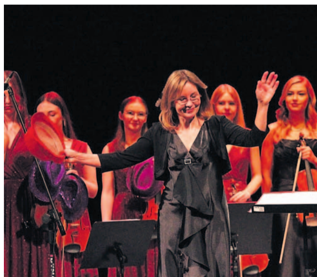
ARCH. SDK (2)

Sanocki Dom Kultury po raz kolejny stał się miejscem niezwykłych artystycznych przeżyć. W miniony weekend publiczność miała okazję podziwiać tam dwa wyjątkowe zespoły – bębniarski Kiwano oraz smyczkowy Con Amore.