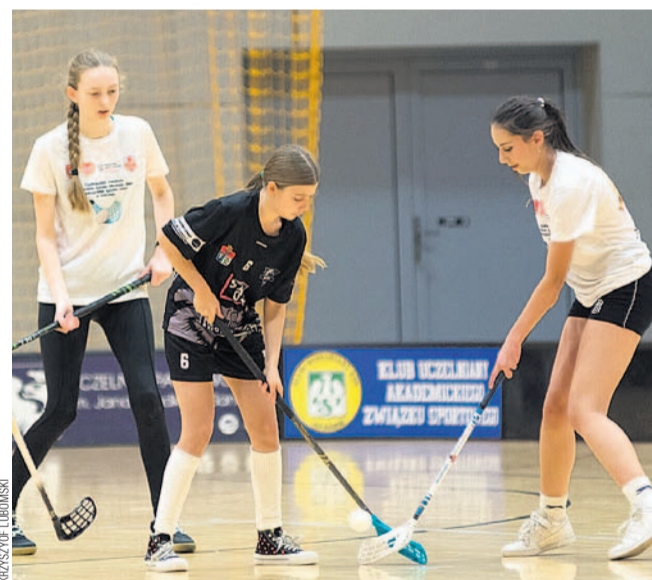
Unihokeistki Czubków (jasne stroje) wygrały obydwa mecze

Bramki: Kuc, Czubek, Hokska – Burnat, Balwierczak. (b)