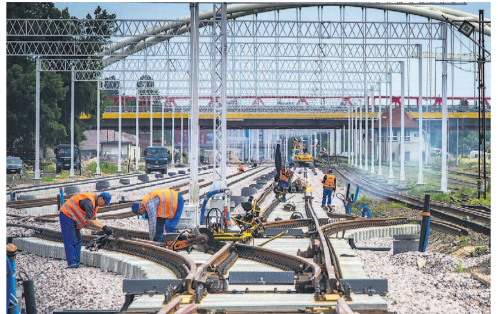
PKP PLK przymierza się do modernizacji linii nr 108. Zdjęcie ilustracyjne

Trwają przygotowania do rewitalizacji linii kolejowej nr 108 z Jasła do Zagórza oraz rozbudowy drogi krajowej nr 84 na odcinku Zagórz–Lesko. Ogłoszono przetargi na wykonawców, do których zgłosiło się w sumie 15 firm.