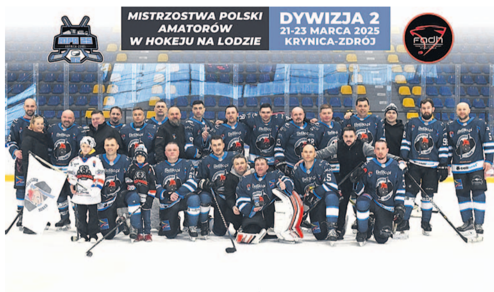
Drużyna Niedźwiedzi na lodowisku w Krynicy