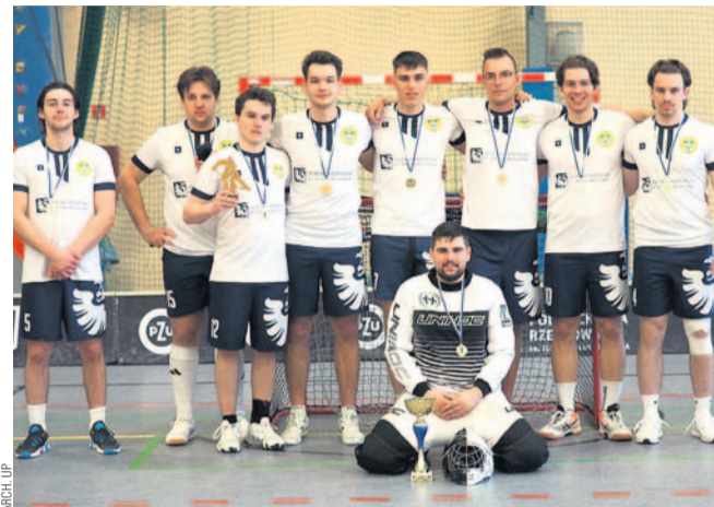
Zawodnicy UP zdobyli tytuł mistrzowski

Zespoły Uczelni Państwowej nie zawiodły, zdobywając dwa medale turniejów 3x3. Mężczyźni wywalczyli tytuł mistrzowski, a kobiety uplasowały się na najniższym stopniu podium.