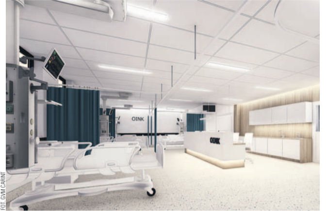
Wizualizacja Oddziału Intensywnego Nadzoru Kardiologicznego

Budowa Podkarpackiego Centrum Interwencji Sercowo-Naczyniowych GVM Carint wkroczyła w zaawansowany etap. Nowoczesny obiekt rośnie w błyskawicznym tempie.