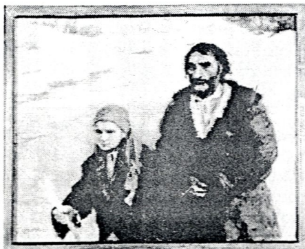
A. Axentowicz "Na Gromniczną"

Gdy na Gromnicę ciecze, zima się jeszcze przewlecze; Na Gromnicę jasno, to w stodole ciasno; Gdy na Gromnicę rozstaje, rzadkie będą urodzaje;