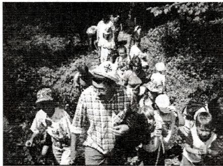
Rekolekcje wakacyjne w Zagorzycach

i łaski do wytrwania. Dziś wiem, że muszę zawierzać wszystko Tej, która nie opuściła mnie, gdy żyłam w ciemności i wciąż czuwa nad moją rodziną. Aby iść obroną drogą, musiałam zrezygnować z wielu rzeczy, które zniewalały moją duszę. Z pomocą Maryi pragnienia, które mnie otaczały, stały się teraz obojętne. Jedyną wartością, którą powinnam się zachwycać, jest Jezus Chrystus. Moje życie tak naprawdę zaczęło się dopiero wtedy, kiedy wstąpiłam do RRN. Dziękuję Panu Bogu za to wielkie Miłosierdzie, które spłynęło na mnie, za tę wielką łaskę, która skierowała moje kroki do Ruchu. Poprzez różne doświadczenia i cierpienia Bóg pokazuje, jak bardzo mnie kocha, jak bardzo Mu na mnie zależy. Dlatego będę starała się nie zawieść tego zaufania i trwać na drodze, na którą mnie wprowadził.