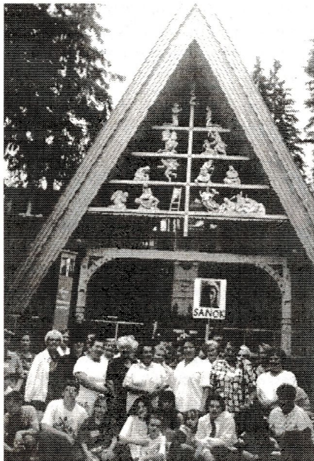
Zakopane - Kreptówki, lipiec'98

Dzieła życia o. Maksymiliana potwierdzają się w objawieniach maryjnych; uderzającą jest zbieżność z Fatimą.