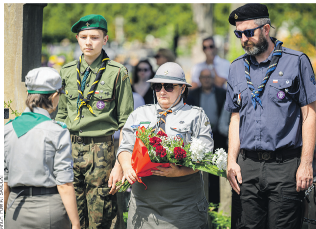
Uroczystości rozpoczęły się na Cmentarzu Centralnym

W uroczystościach wzięli udział wspomniani krewni pomordowanych, samorządowcy, przedstawiciele instytucji, służb mundurowych, środowisk pa-