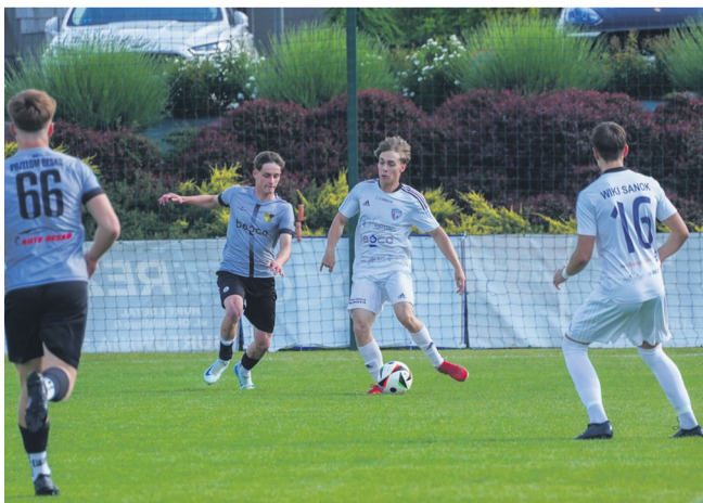
Przed zawodnikami Wiki (jasne stroje) kolejny sezon w okręgówce

Zespoły Ekoballu i Wiki rozpoczęły przygotowania do nowego sezonu, odpowiednio w IV lidze podkarpackiej i klasie okręgowej. Stalowcy startują ze sparingami już jutro (godzina 10, stadion w Bykowcach), a wikingowie za tydzień. Obydwa kluby zaplanowały po 4 mecze. Poniżej plan gier kontrolnych