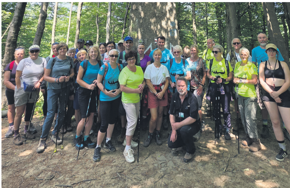
Wspólne zdjęcie uczestników pierwszej wycieczki