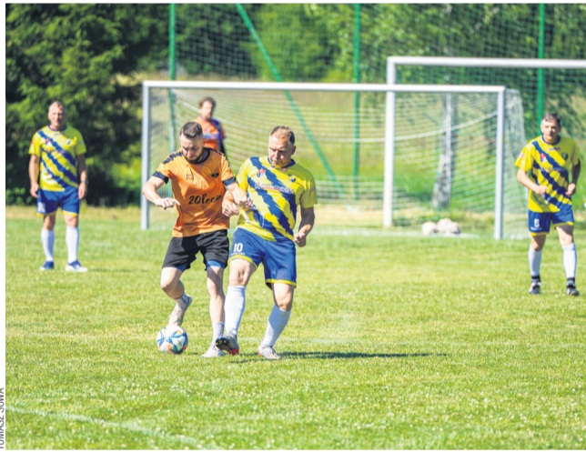
Oldboje Stali (żółte stroje) wciąż w wysokiej formie

STAL SANOK OLDBOYS – STALFRED I 0:0, karne 2:0