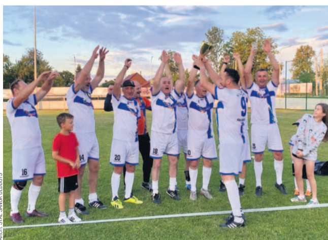
Piłkarze Stal Sanok Oldboys znów mieli powody do radości

– To był dzień pełen piłkarskich emocji i walki do samego końca. Nasza drużyna pokazała klasę i charakter! Zwłaszcza, że była jedną z najstarszych, ale i najbardziej zgranych. Pokazaliśmy, że Sanok gra do końca – czytamy na facebookowym profilu Stal Sanok Oldboys. (bb)