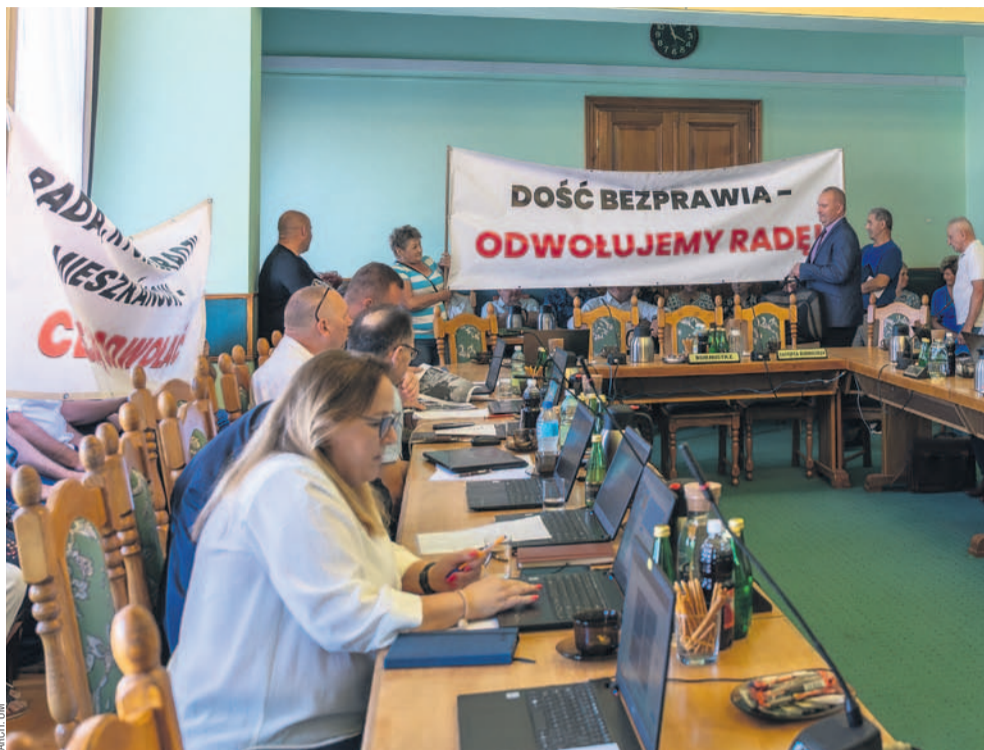
Na niedawnej sesji mieszkańcy pojawili się z plakatami informującymi o zamiarze odwołania RM

Rozpoczęła się zbiórka podpisów pod wnioskiem o referendum lokalne w sprawie odwołania Rady Miasta Sanoka przed końcem kadencji. To bezprecedensowa inicjatywa mieszkańców, wspierana również przez część radnych. Celem jest przywrócenie odpowiedzialności,ładu i współpracy w naszym samorządzie.