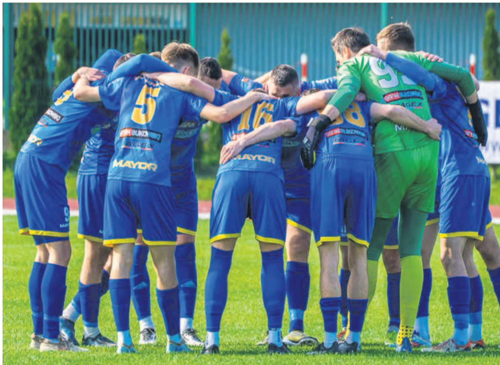
Stalowcy udanie rozpoczęli krótki cykl przedsezonowych sparingów, od wygranej ze Stalą Łącut