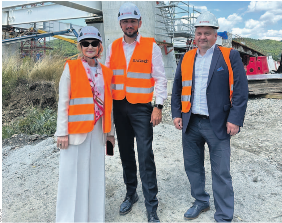
Posel Urszula Koszutska zobaczyła m.in. postępy prac przy budowie mostu na Sanie

Sanok odwiedziła Poseł na Sejm RP Urszula Koszutska, odbywając roboczą wizytę poświęconą najważniejszym inwestycjom realizowanym w naszym mieście. Spotkanie miało konkretny i merytoryczny charakter – skoncentrowane było na postępach przy budowie mostu na Sanie oraz na planowanej modernizacji systemu ciepłowniczego.