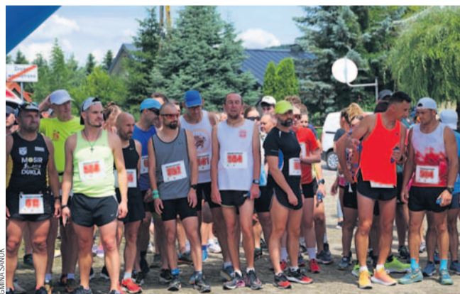
Odliczanie do startu biegu w Mrzygłodzie