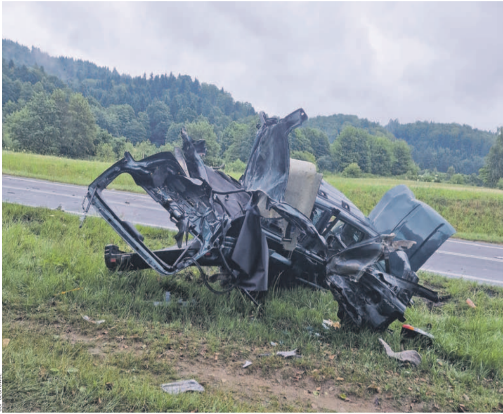
Tyle zostało z osobówki, która w Bykowcach zderzyła się z tirem

(bb) Tyle zostało z osobówki, która w Bykowcach zderzyła się z tirem