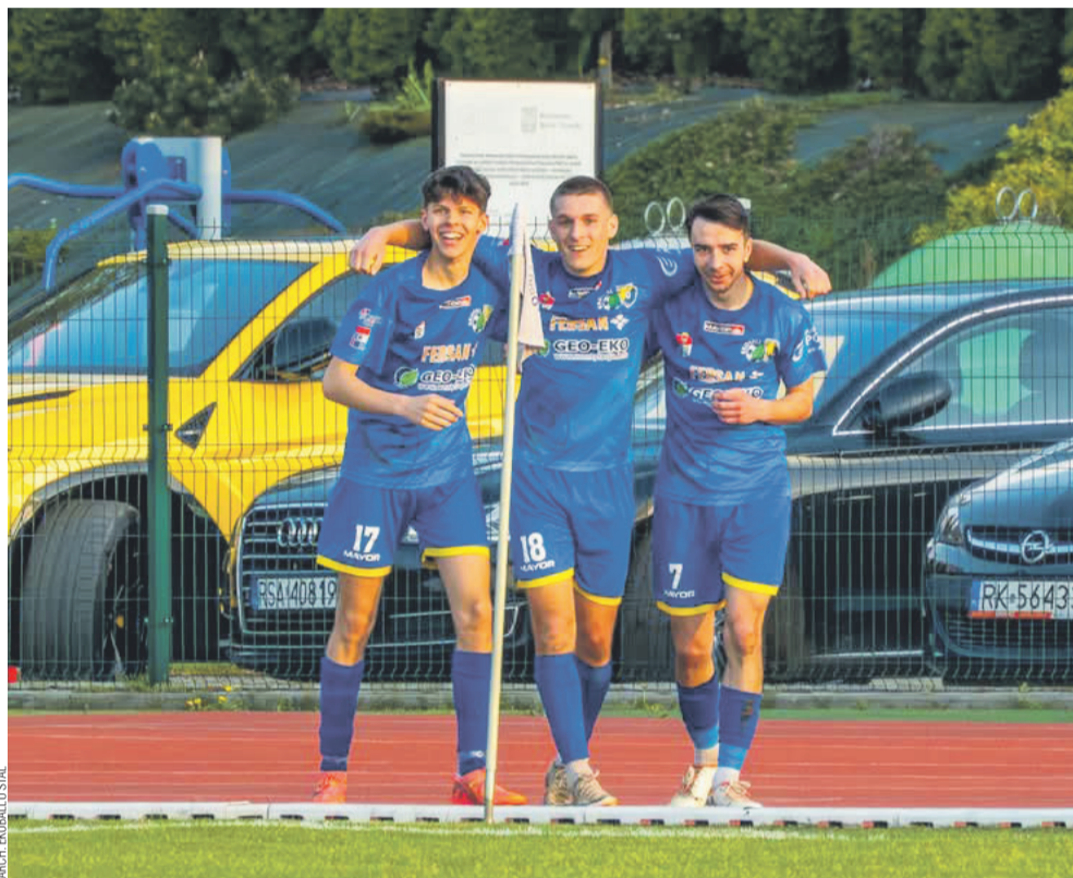
Stalowcy znów mogli cieszyć się ze zwycięstwa