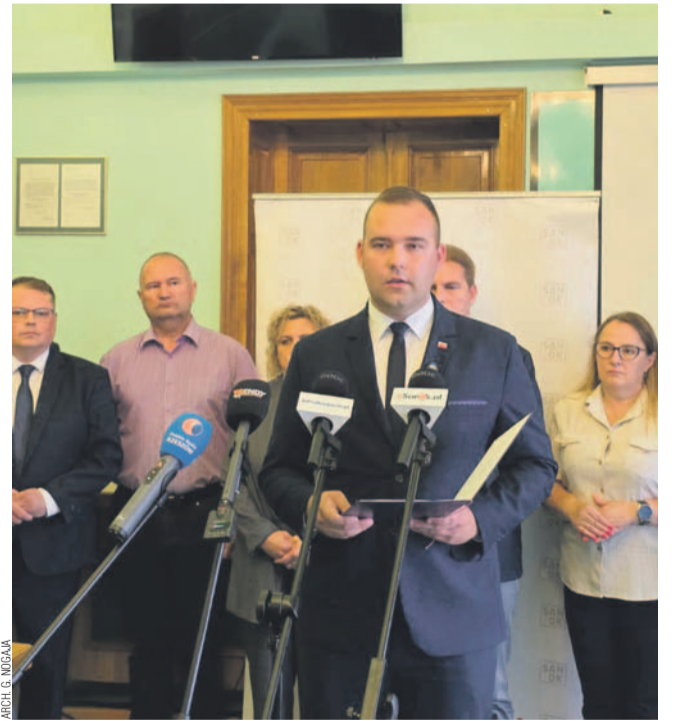
Kadr z konferencji

Sanocznianie zasługują na uczciwe i racjonalne zarządzanie miastem, a nie na władzę, która zarządza poprzez konflikty i oczernianie Radnych Miasta Sanoka, którzy do Rady wybrani zostali przez Mieszkańców, a nie przez Burmistrza.