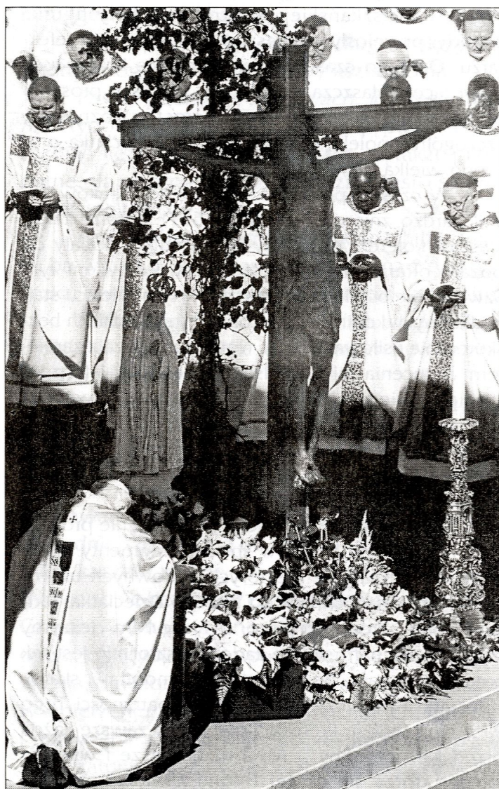
Jan Paweł II wspólnie z biskupami odczytuje Akt Zawierzenia...

Niech Duch otworzy serca na sprawiedliwość i miłość, niech prowadzi ludzi i narody ku wzajemnemu zrozumieniu i wzbudza w nich stanowczą wolę pokoju. Zawierzamy Ci wszystkich ludzi, poczynając od najslabszych: dzieci, które jeszcze nie przyszły na świat, oraz te, które narodziły się pośród ubóstwa i cierpienia, młodych poszukujących sensu, ludzi pozbawionych pracy,