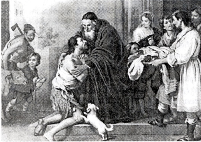
Rembrandt van Rijn, Przypowieść o synu marnotrawnym