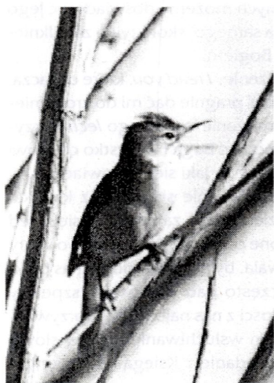
Cieniówka oznajmiająca swoje przybycie