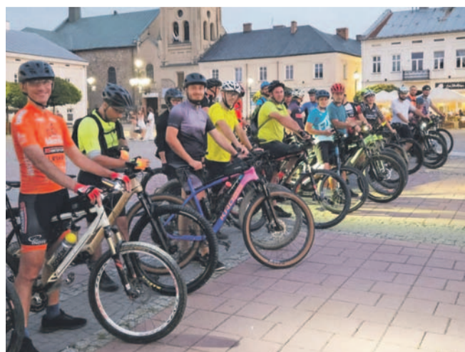
Rowerzyści na rynku przed nocną wyprawą prowadzącą m.in. przez już istniejący odcinek Velo Sanu

Radni wyrazili zgodę na zaciągnięcie zobowiązania finansowego wykraczającego poza rok 2025. Chodzi o opracowanie dokumentacji projektowo-kosztorysowej dla czwartego etapu budowy ścieżki pieszo-rowerowej Velo Sanu.