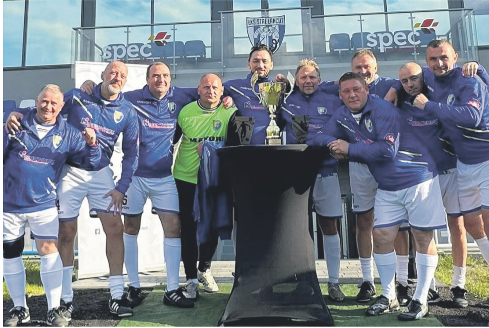
Oldboje Stali znów mogli fetować turniejowe zwycięstwo