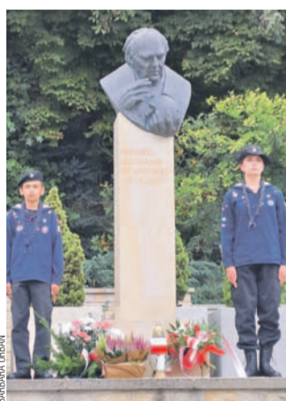
Warta przy pomniku księdza