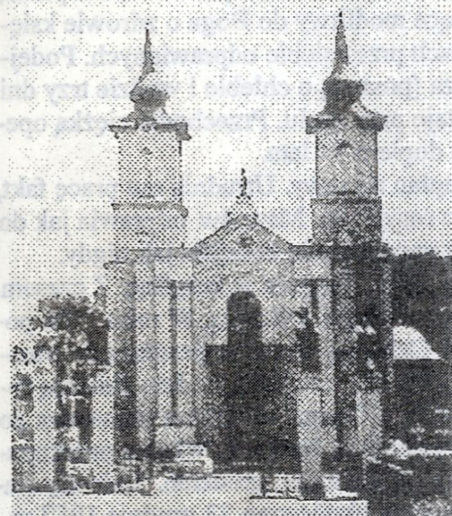
Kościół w Gródku

Ja chcę napisać jednak o swoim mieście, Gródku na Podolu, diecezja Kamieniecko-Podolska, Chmielnickie województwo.