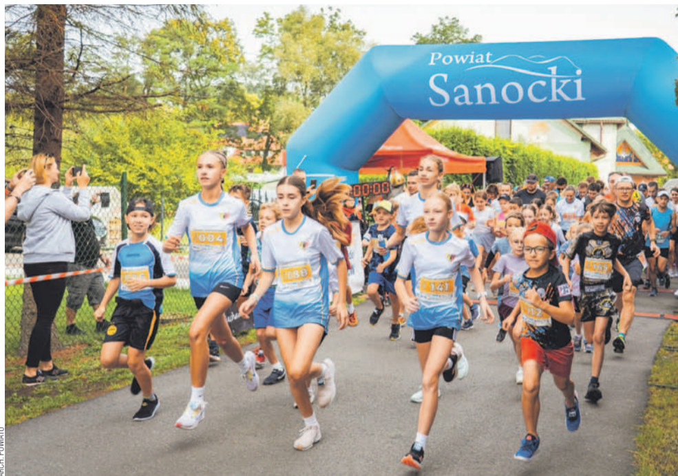
Start trzech dystansów – 2, 5 oraz 10 km

Rodzinna Pielgrzymka Biegowa Świętego Maksymiliana „Bieg na Maksa” po raz szósty wystartowała spod kaplicy przy ul. Zagrody. Tegoroczna edycja miała wyjątkowy wymiar, bo połączono ją z obchodami tysiąclecia Królestwa Polskiego. Obok zmagania na czterech dystansach przygotowano rekonstrukcję historyczną oraz liczne atrakcje.