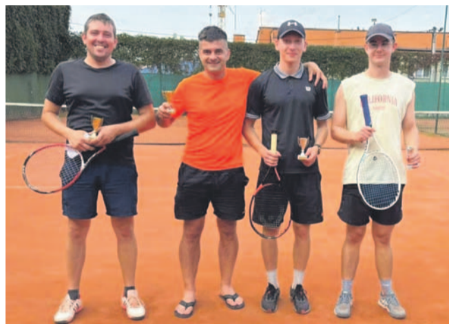
Finaliści rozgrywek z kategorii open amator