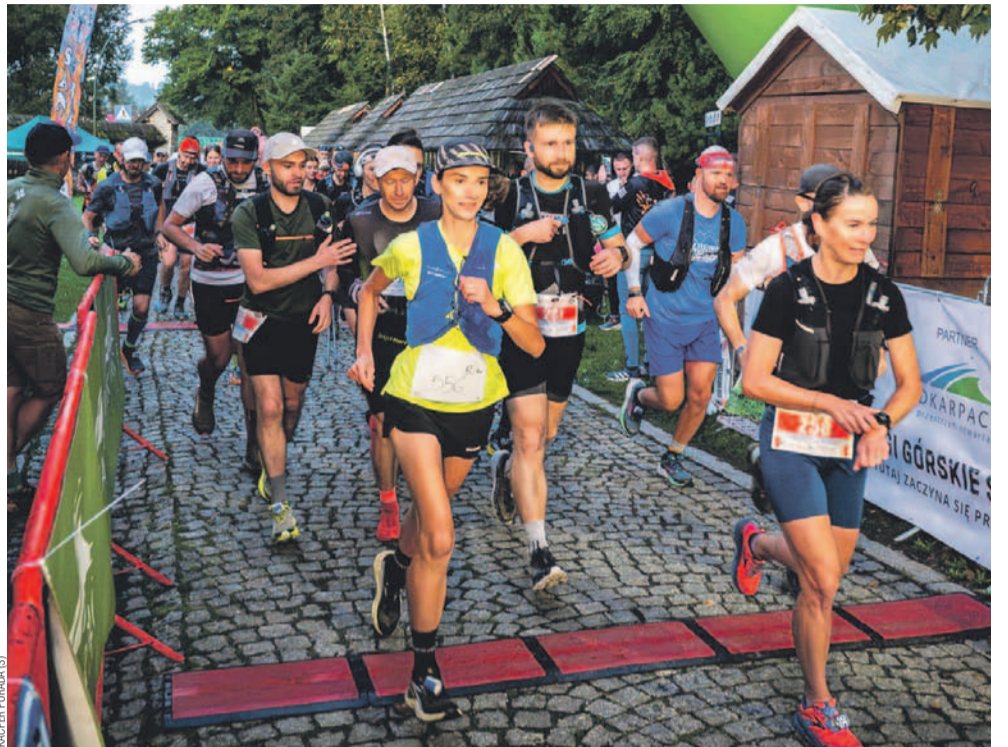
Start biegu na 50 kilometrów