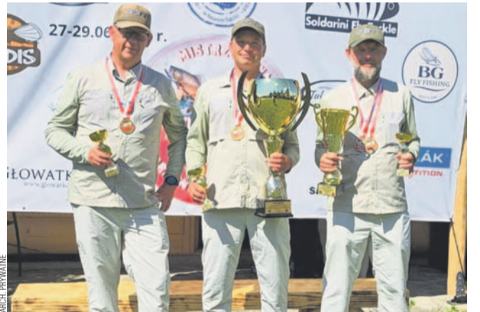
Drużyna Trapera zajęła 4. miejsce w klasyfikacji GP Polski