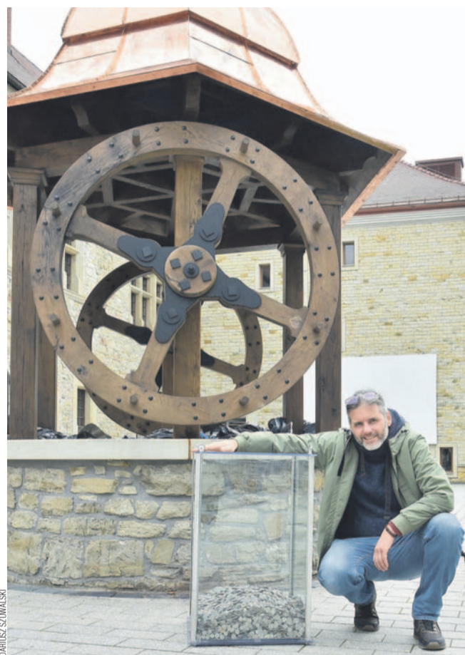
Ze studni „wylowiono” mnóstwo monet, wrzucanych tam na szczęście. Niedługo wrócą do jej wnętrza