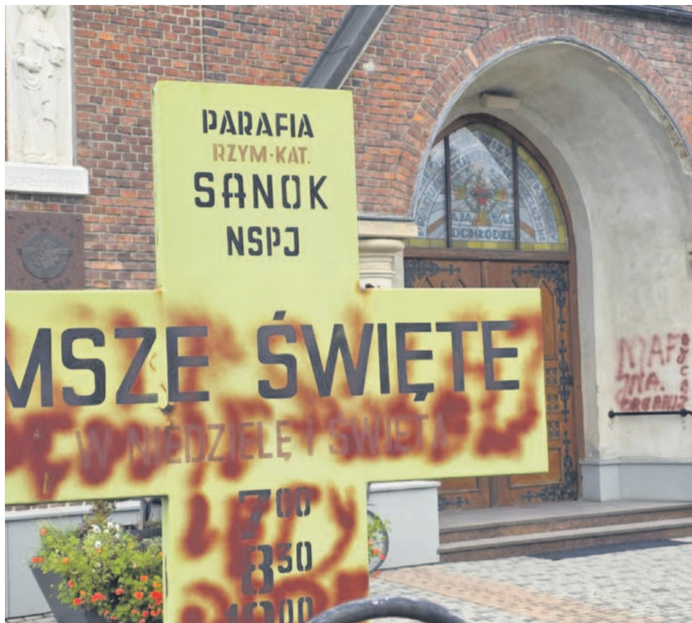
Kościół na Posadzie padł ofiarą aktu wandalizmu

Kościół pw. Najświętszego Serca Pana Jezusa na Posadzie padł ofiarą aktu wandalizmu. Czerwonym sprayem popisano elewację przy głównym wejściu oraz krzyż informujący o godzinach mszy. Policja zatrzymała podejrzanego.