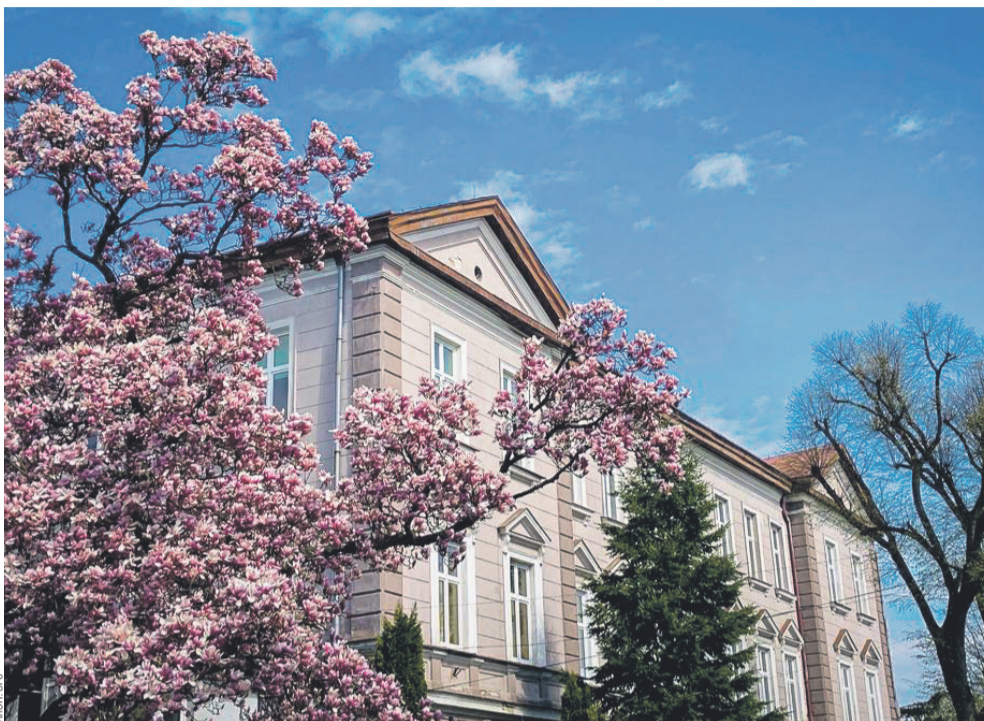
SP8 ma największy procent uczniów zapisanych na edukację zdrowotną

Od roku szkolnego 2025/26 w szkołach podstawowych wprowadzono nowy przedmiot – edukację zdrowotną. Decyzję podjęło Ministerstwo Edukacji Narodowej. Zajęcia realizowane są w klasach IV-VIII, a ich treści obejmują m.in. zagadnienia związane z funkcjonowaniem organizmu człowieka, zdrowiem fizycznym i psychicznym oraz profilaktyką.