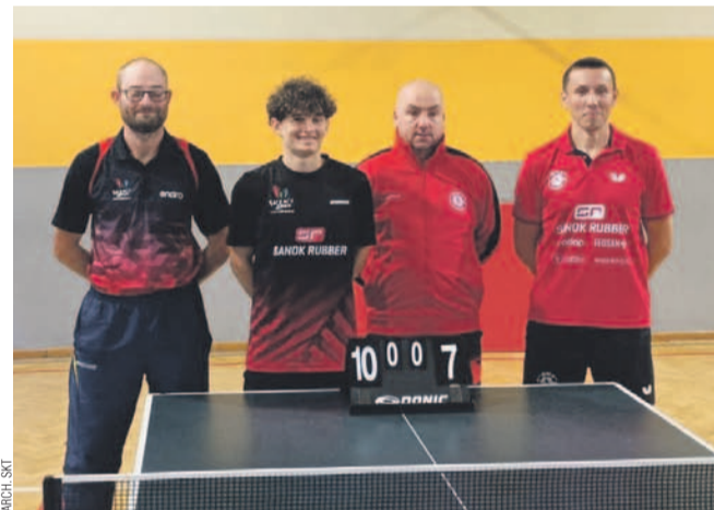
Pierwsza drużyna SKT Rubber rozpoczęła sezon od zwycięstwa

SKT V: W. Dębski 3,5, Mąka 3,5, Zacharski 3, Hydzik.