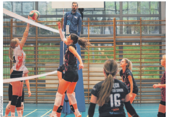
Porażkę z Karpatami juniorki TSV powetowały sobie wygraną z AOZ

Sanoczanka Sanok – UKS MOSiR II Dukla 2:0 (15, 14) Sanoczanka Sanok – UKS MOSiR I Dukla 0:2 (-16, -8) TSV Sanok – UKS MOSiR II Dukla 2:0 (19, 15) TSV Sanok – UKS MOSiR I Dukla 0:2 (-11, -24)