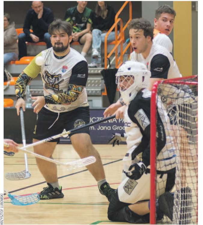
Unihokeiści Jokera wracają na zwycięską ścieżkę