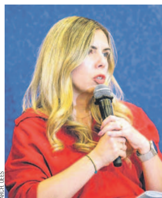
Prezesa spółki Hydro Sanok