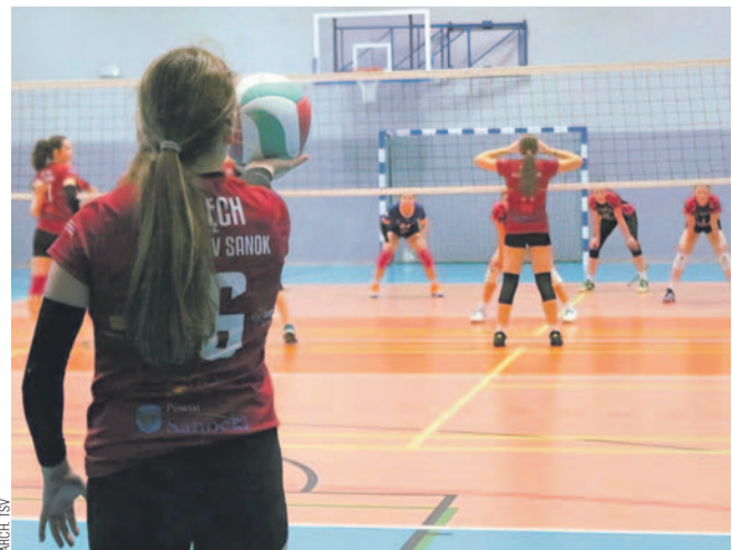
Siatkarki TSV prezentują bardzo wysoką formę