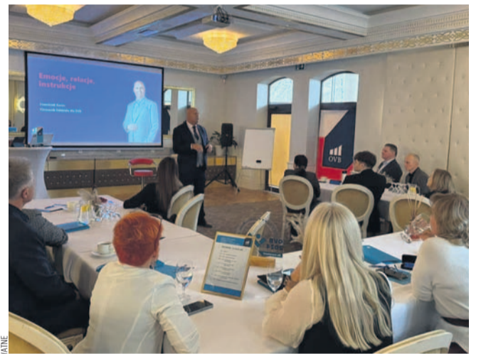
Kadr z konferencji w Royal Palace

Spotkanie było również okazją do wymiany doświadczeń oraz nawiązania nowych, wartościowych relacji biznesowych. Przedsiębiorcy biorący udział w wydarzeniu podkreślali, że wynieśli z niego nie tylko praktyczną wiedzę, ale również konkretne narzędzia, które mogą wdrożyć w swoich firmach. Zwracali uwagę na nowe możliwości optymalizacji finansów, zwiększenia bezpieczeństwa działalności oraz budowania kapitału w sposób świadomy i dopasowany do dynamicznie zmieniającego się rynku.