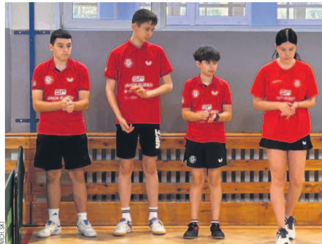
Piąta drużyna SKT Rubber rozegrała dwa mecze

SKT: Domaradzki, Trznadel, Zawiślan, Sobkowicz.