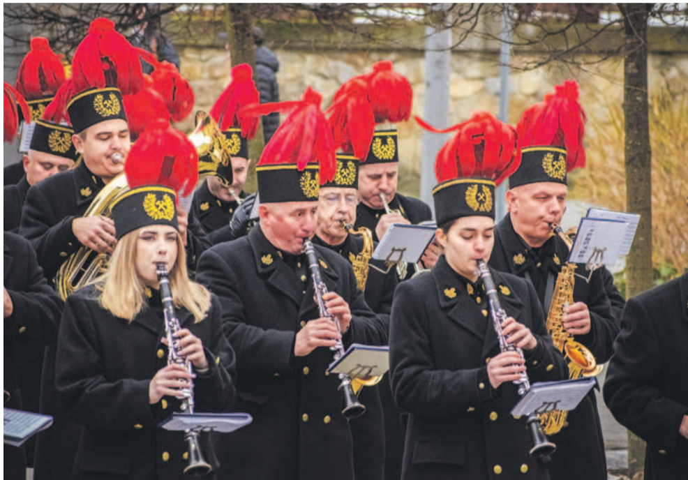
Górnicy pochód przeszedł spod kościoła farnego do Sanockiego Domu Kultury

Górnictwo naftowe i gazownictwo od wielu lat stanowią jeden z fundamentów rozwoju południowego Podkarpacia. To właśnie tu, m.in. w okolicach Sanoka, wydobycie gazu kształtowało lokalną gospodarkę, wspólnotę i codzienność całych pokoleń. Ta cicha, lecz potężna siła napędowa, przez dekady wpływała na nasze tradycje i tożsamość, tworząc wyjątkowy charakter tej ziemi. Tegoroczna Barbórka ponownie pokazała, jak mocno zakorzeniona jest ta społeczność i jak ważną rolę odgrywa w życiu regionu.