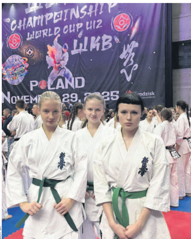
Zawodniczki SKK pokazały się na mistrzostwach w Grodzisku

Oba kluby podkreślają, że zawody stanowiły ważne doświadczenie dla młodych sportowców. Możliwość rywalizacji z mocnymi reprezentantami innych krajów była cenną lekcją i motywacją do dalszego rozwoju.