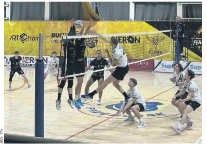
W dwóch pierwszych setach siatkarze TSV postawili się liderowi

W niedzielę (godzina 17) w Zespole Szkół nr 3 drużyna TSV podejmie siatkarzy Volley Gmina Wiązownica.