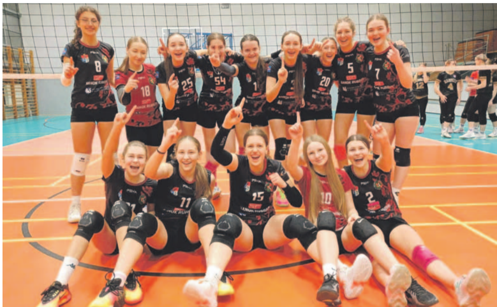
Drużyna junierek młodszych TSV wraca na najwyższy szczebel wojewódzkich rozgrywek

Z awansu do I ligi cieszyły się juniorki młodsze TSV. Starsze utrzymały fotel lidera. Do wyższej klasy rozgrywkowej trafiły młodziczki. Porażek doznali juniorzy starsi i młodszy.