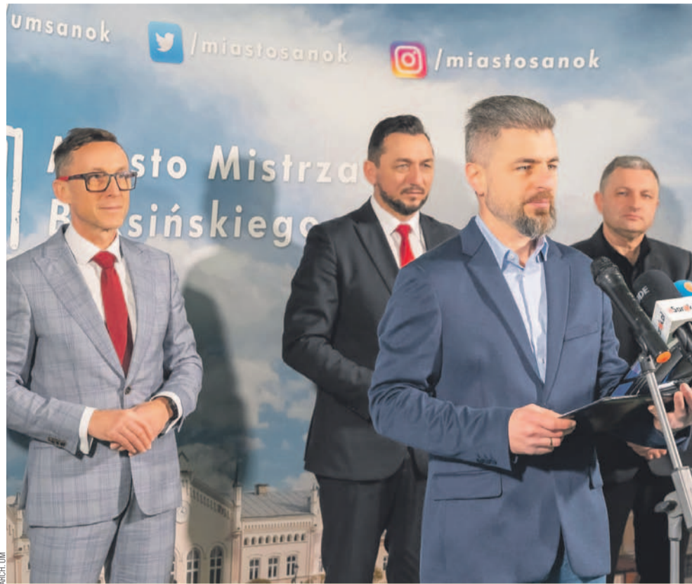
Podpisanie umowy połączone zostało z konferencją w Urzędzie Miasta

W Sali Herbowej Urzędu Miasta podpisano umowę na realizację jednej z najważniejszych inwestycji infrastrukturalnych ostatnich lat. Porozumienie zawarły spółki miejskie SPGK oraz SPGM z wykonawcą – firmą TERMORES Sp. z o.o. sp. k.. Projekt dotyczy rozbudowy miejskiej sieci ciepłowniczej i ma strategiczne znaczenie dla bezpieczeństwa energetycznego Sanoka.