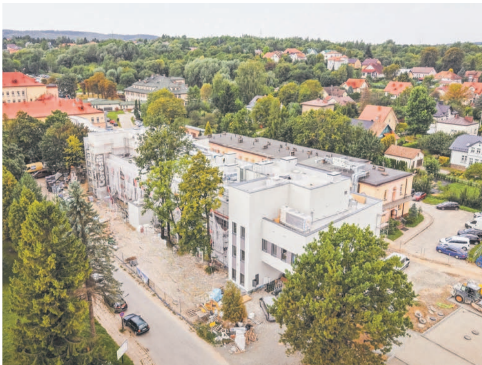
Budowa Podkarpackiego Centrum Interwencji Sercowo-Naczyniowych

Miniony rok był dla Powiatu Sanockiego czasem intensywnej pracy, licznych inwestycji oraz ważnych inicjatyw społecznych, edukacyjnych i kulturalnych. Samorząd realizował lub nadal realizuje – część zadań jest jeszcze w trakcie – szeroki zakres przedsięwzięć, które mają wpłynąć na jakość życia mieszkańców.