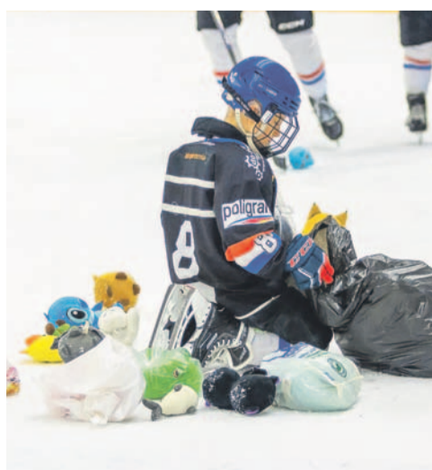
Kibice dopisali, pluszaki na lodzie, a STS wciąż bez zwycięstwa