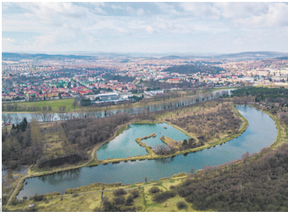
Czy stawy w „Sosenkach” zmieniają dzierżawcę?