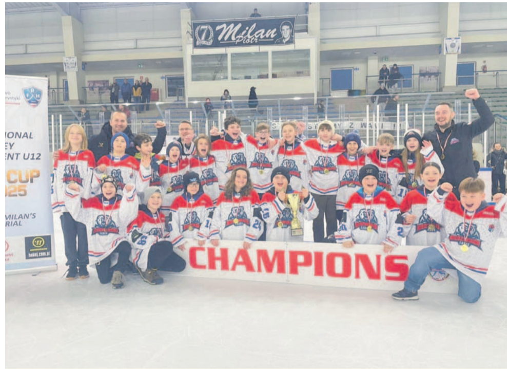
Młodzi sanoczanin z głównym trofeum ósmej edycji Milan Cup

sienką na torcie była wygrana z drugim z polskich zespołów biorących udział w memoriale – gdańskim Stoczniovcem. Puchar po raz pierwszy w historii naszego turnieju pozostał w Sanoku.