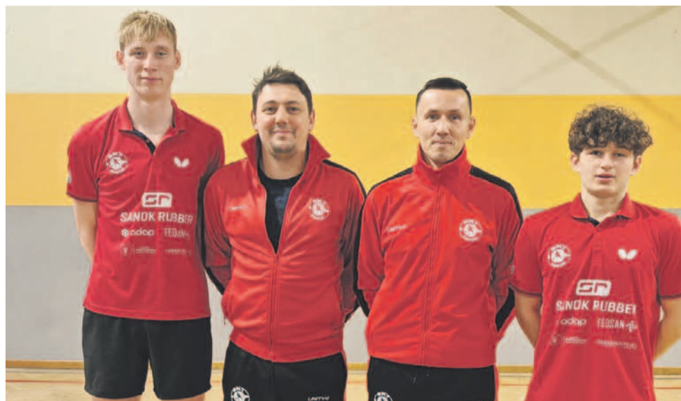
Pierwsza drużyna SKT zremisowała z Politechniką Rzeszów

Pierwsza drużyna po kolejnym zaciętym meczu podzieliła się punktami z Politechniką Rzeszów. Czwarta ekipa przegrała w Woli Komborskiej.