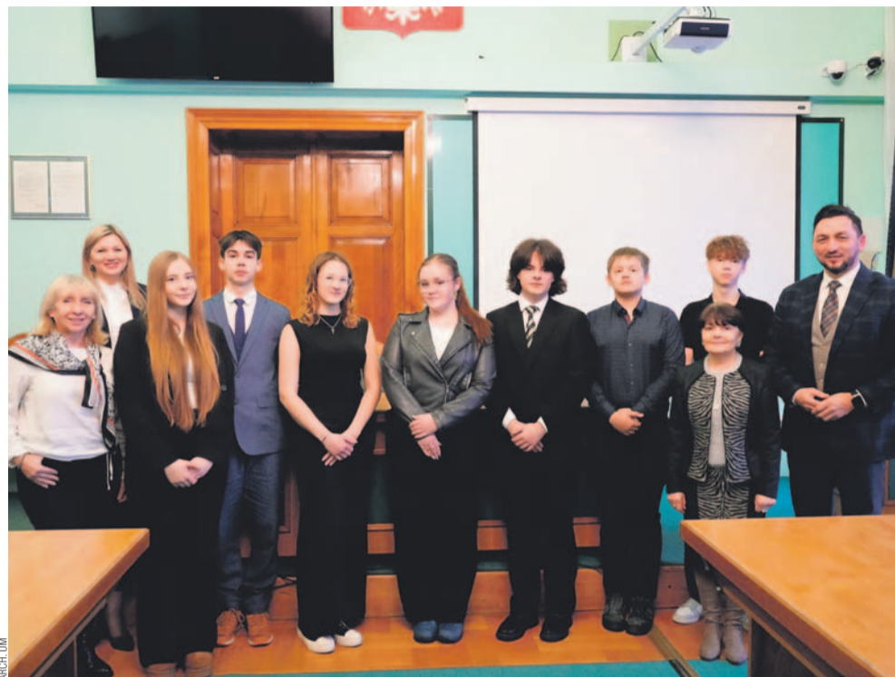
Trzecia kadencja Młodzieżowej Rady Miasta Sanoka dobiegła końca

W Sali Herbowej Urzędu Miasta odbyło się spotkanie podsumowujące działalność Młodzieżowej Rady Miasta Sanoka III kadencji. Była to okazja do wspólnego spojrzenia na czas pełen zaangażowania, pomysłów i pierwszych samorządowych doświadczeń młodych radnych, którzy przez ostatnie miesiące uczestniczyli w życiu miasta.