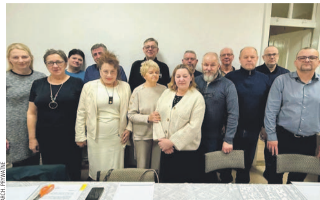
Rada Dzielnic Śródmieście

Rady wciąż nie ma dzielnica Posada, gdyż w wyznaczonym terminie nie udało się zebrać wystarczającej liczby kandydatów. Nowy termin wyborów ustali Rada Miasta.