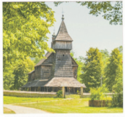
MUZEUUM BUDOWNICTWA LUDOWEGO W SANOKU