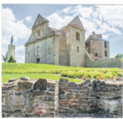
CENTRUM KULTURY FORESTERIUM W ZAGÓRZU