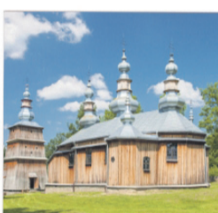
CERKIEW GREKOKATOLICKA W TURZAŃSKU - UNESCO