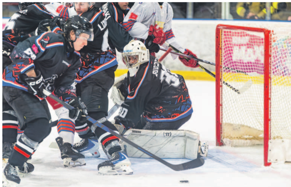
W meczu z Polonią nie raz kotłowało się pod bramką STS-u