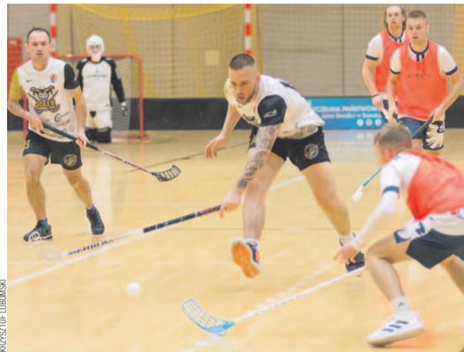
Zawodnicy Jokera w coraz wyższej formie