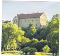
MUZEUUM HISTORYCZNE W SANOKU