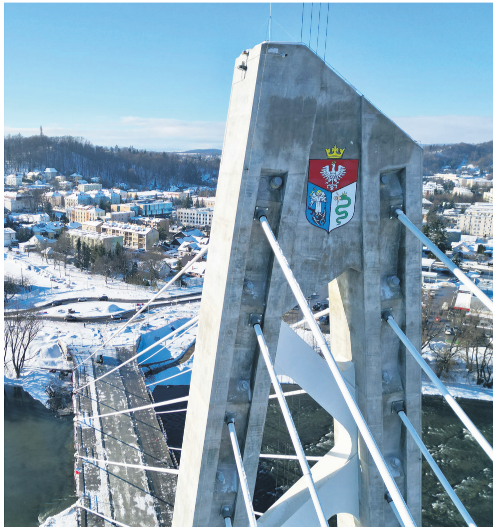
Nowy most stał się już częścią krajobrazu miasta

Na nowym moście nad Sanem widać wyraźny sygnał, że inwestycja wchodzi w końcową fazę. Od kilku dni prowadzone są intensywne prace związane z demontażem rusztowań na pylonie. Konstrukcja, dotąd częściowo zasłonięta, odsłania się w pełnej skali – wraz z herbem miasta, który jest już czytelny po obu stronach przeprawy.