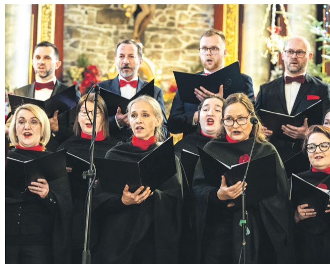
Kadr z występu Sanockiego Chóru Kameralnego