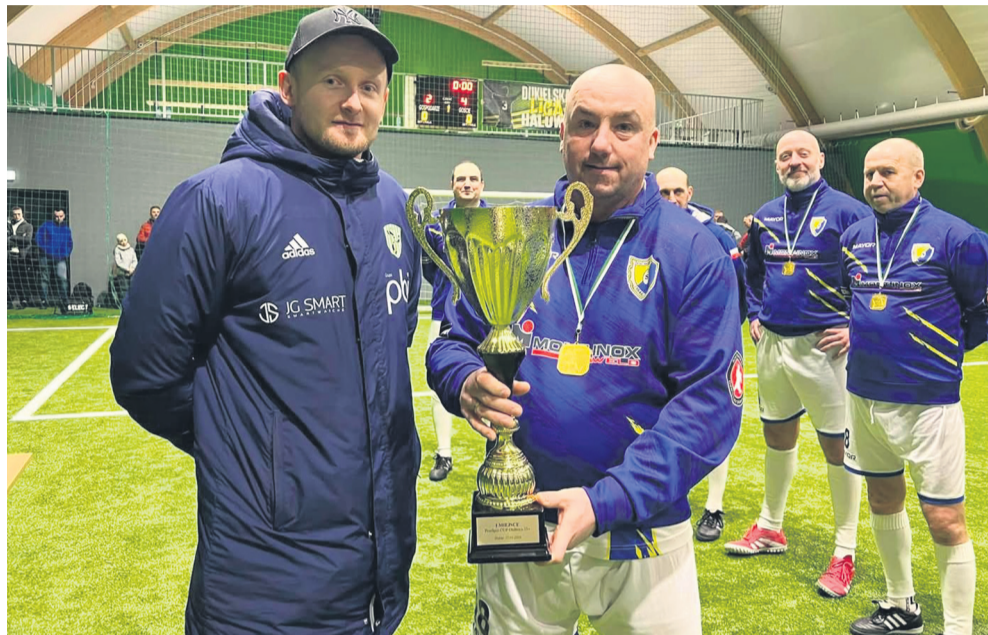
Oldboje Stali zdobyli kolejny puchar, jak przed rokiem wygrywając turniej w Dukli