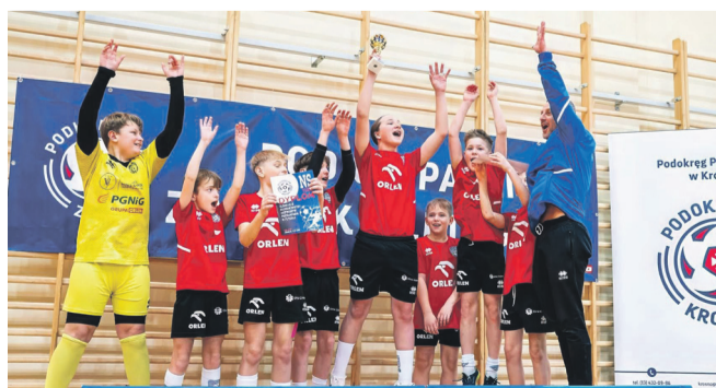
Młodzicy AP wygrali turniej eliminacyjny w Głowience

Gdy rocznik 2018 walczył w Memoriale Jerzego Pietrzakiewicza, inne drużyny AP grały na wyjazdach. Zawodnicy rok starsi odnieśli zwycięstwo w Boguchwale, zespół 10-latków uplasował się na podium w Kielnarowej, a młodzicy młodszy uzyskali awans finału Futsalowych Mistrzostw Podkarpacia.