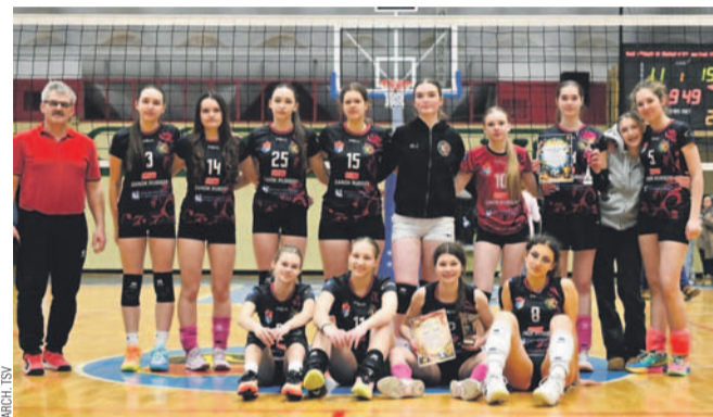
Drużyna junierek młodszych AZS UP TSV

– Sezon można uznać za udany, bo zrealizowaliśmy cel, jakim było zajęcie jednego z czterech miejsc premiowanych grą w turnieju finałowym. Szkoda tylko, że w trakcie rozgrywek zmniejszono dla naszego województwa liczbę zespołów – z 4 na 3 – które uzyskiwały awans do ćwierćfinałów mistrzostw Polski – powiedział trener Wiesław Semeniuk.