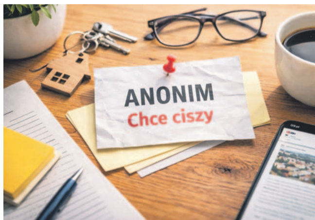
WYG. CHAP GPT

Cisza zawsze komuś służy. Historia uczy, że gdy w debacie publicznej pojawia się strach, to nie dlatego, że ktoś jest zbyt głośny. Tylko dlatego, że jego głos jest słyszany. Anonim nie świadczy o sile nadawcy. On świadczy o jego lęku. O bezsilności wobec cudzej sprawczości, odwagi i konsekwencji.