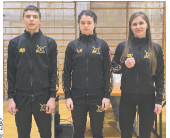
Samuraje zaliczyli komplet zwycięstw

– Nasi zawodnicy nie pozostawili żadnych złudzeń – w każdej walce pełna dominacja i kontrola. Kolejny start, który cieszy – napisano na profilu klubu w mediach społecznościowych.