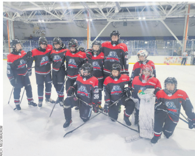
Nie mają sobie równych! Drużyna Młodzików po meczu w Dębicy