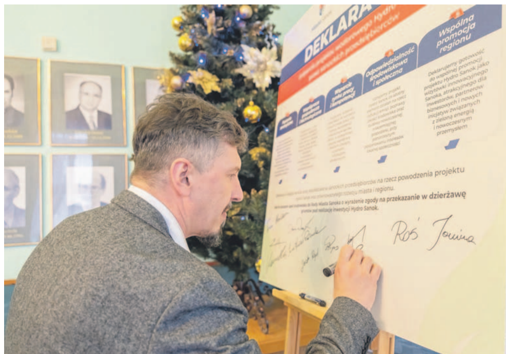
Deklarację poparcia projektu podpisało wielu lokalnych przedsiębiorców