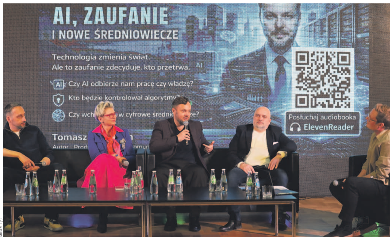
Kadr z panelu dyskusyjnego o wpływie sztucznej inteligencji na otaczający nas świat