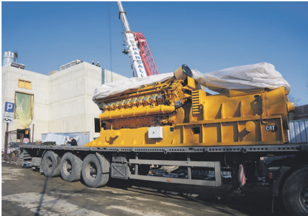
Agregat kogeneracyjny dojechał już do Elektrociepłowni Posada

Nastąpił kolejny etap inwestycji realizowanej przez Sanockie Przedsiębiorstwo Gospodarki Komunalnej. Do budynku powstającej Elektrociepłowni Posada wprowadzono jeden z najważniejszych elementów całego układu technologicznego – agregat kogeneracyjny, czyli urządzenie, które będzie jednocześnie produkować energię elektryczną i ciepło.