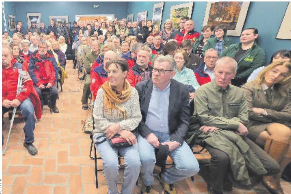
Frekwencja wykładu przeszła najsmielsze oczekiwania

Na północno-wschodnim zboczu góry zamkowej do dzisiaj widoczne są potężne fragmenty murów, które odebrały się od domu zamko-