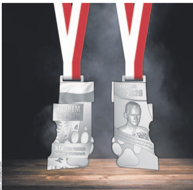
Awers i rewers tegorocznego medalu Biegu Tropem Wilczym

Poszczególne punkty na trasie są związane z lokalną historią. W miejscu obecnego stadionu 24 maja 1946 r. powieszono dwóch partyzantów z oddziału Antoniego Żubryda: Władysława Skwarca i Władysława Kudlika. W gmachu przy ul. Sienkiewicza mieściło się gestapo, a po II wojnie światowej działalność rozpoczął Powiato-