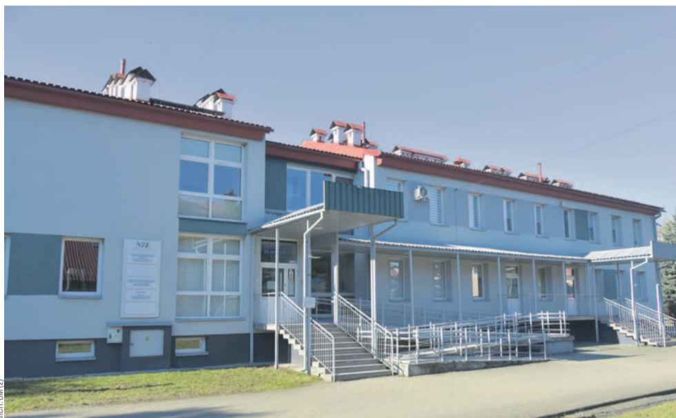
Miejska przychodnia w dzielnicy Błonie

Kontrola nie objęła realnej struktury kosztów, analizy kosztów osobowych, zależności przychodów od liczby deklaracji ani rzeczywistego profilu działalności jednostki. Nie przeanalizowano również w sposób pogłębiony umów najmu – istotnego źródła przychodów niemedyycznych. Audyt zewnętrzny wykazał w tym obszarze nieprawidłowości oraz opóźnienia w regulowaniu należności, które w protokole komisji nie zostały ujęte.