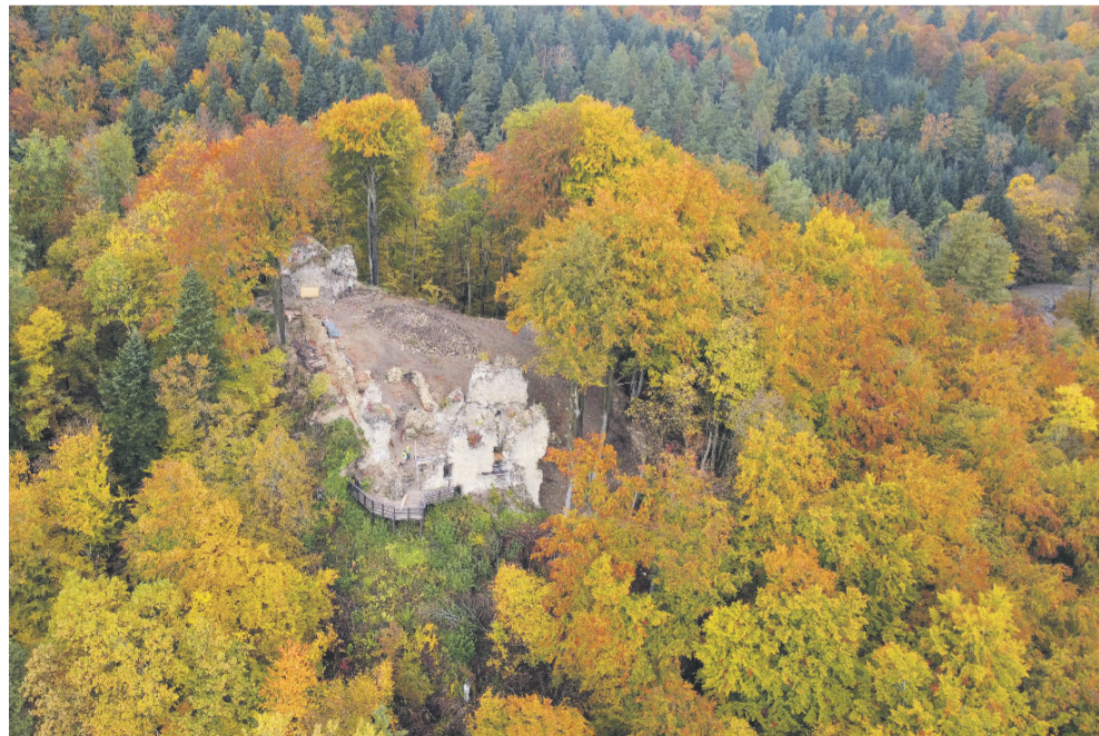
Obecny stan ruin na Sobieniu