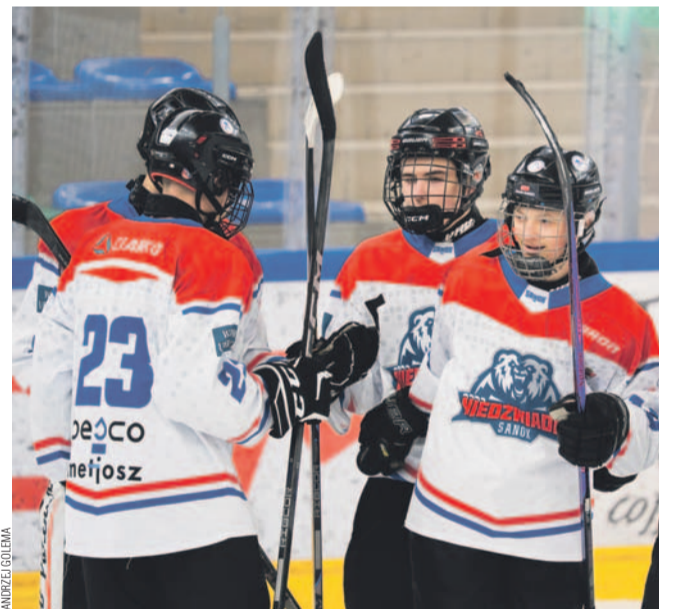
Hokeiści Niedźwiadków wygrali turniej na własnym lodzie

NIEDŹWIADKI SANOK – KÁRPÁTI FARKASOK 4:2 Bramki: Suchecki 2, Kłodowski, Paszkiewicz.