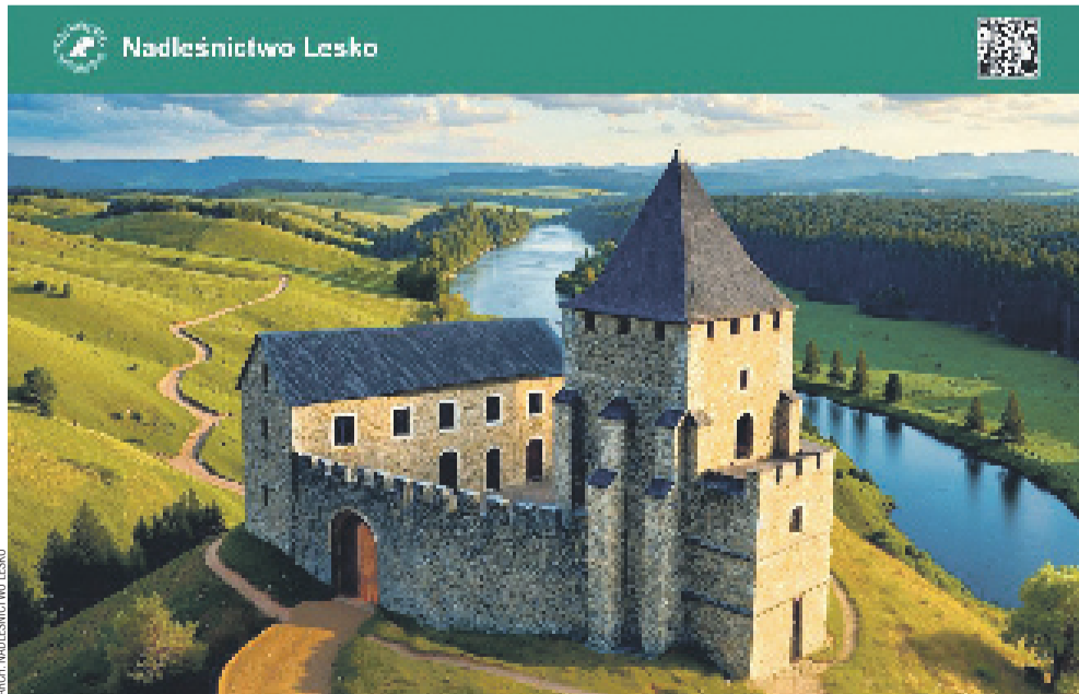
Wizja Zamku Sobień w okresie jego świetności (XIV w.) na podstawie dostępnych materiałów historycznych oraz przeprowadzonych badań archeologicznych w 2025 r.