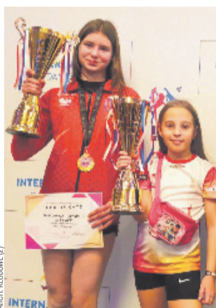
Spartanki z pucharami