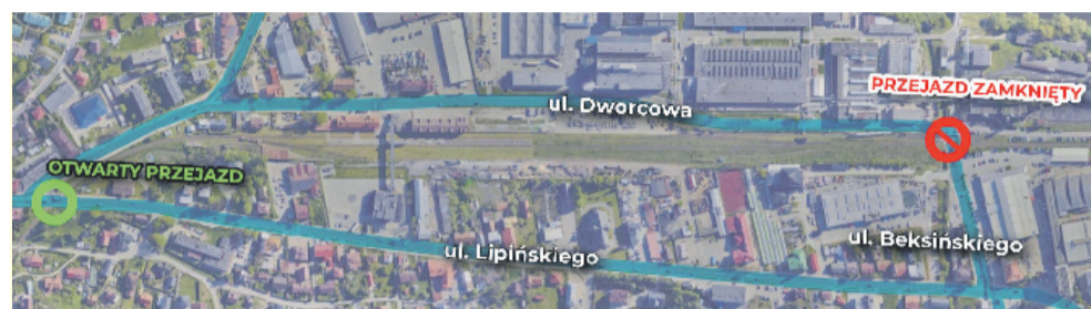
RUCH DWUKIERUNKOWY NA ULICACH LIPIŃSKIEGO, KOLEJOWEJ I DWORCOWEJ