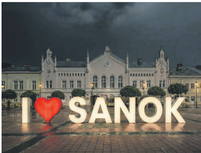
Wstępna wizualizacja projektu

Rozpoczęła się społeczna inicjatywa mająca na celu stworzenie podświetlanego napisu „I ♥ SANOK”, który ma stać się nowym punktem spotkań i pamiątkowym tłem do zdjęć dla mieszkańców oraz turystów. Pomysłodawcami przedsięwzięcia są lokalni społecznicy, którzy chcą zrealizować projekt dzięki wsparciu mieszkańców i przedsiębiorców.