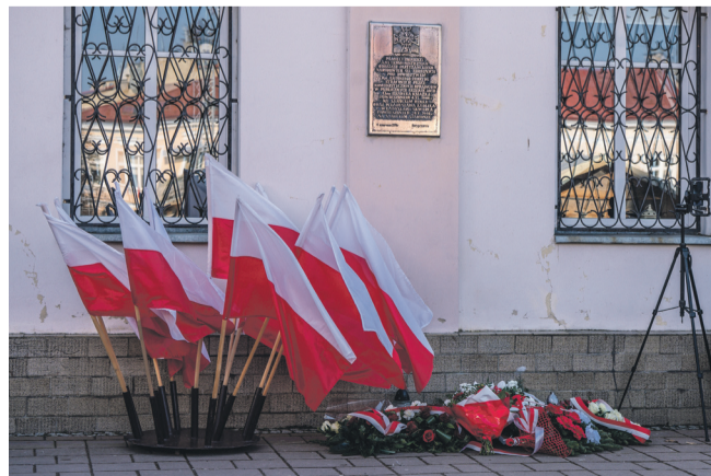
Tablica upamiętniająca Żołnierzy Wyklętych