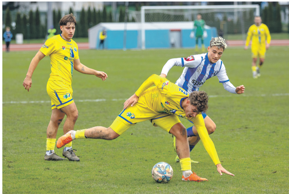
Stalowcy są już gotowi do rundy wiosennej