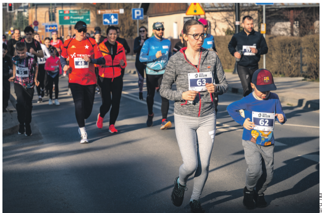
Trasa biegu prowadziła przez centrum miasta