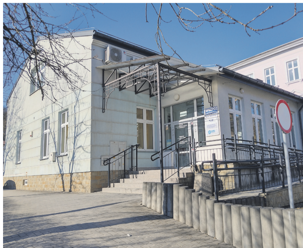
Przychodnia w Śródmieściu