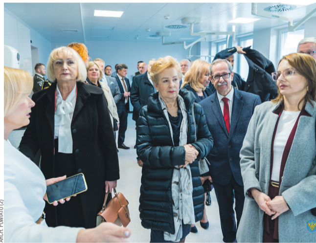
W uroczystym otwarciu wzięli udział m.in. samorządowcy

Podsumowanie „Karpackiego Zwierciadła Kultur”