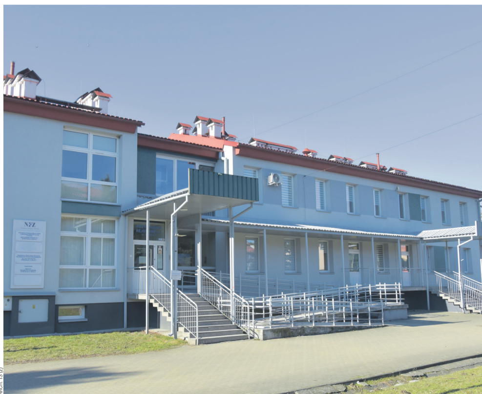
Przychodnia w Błoniach