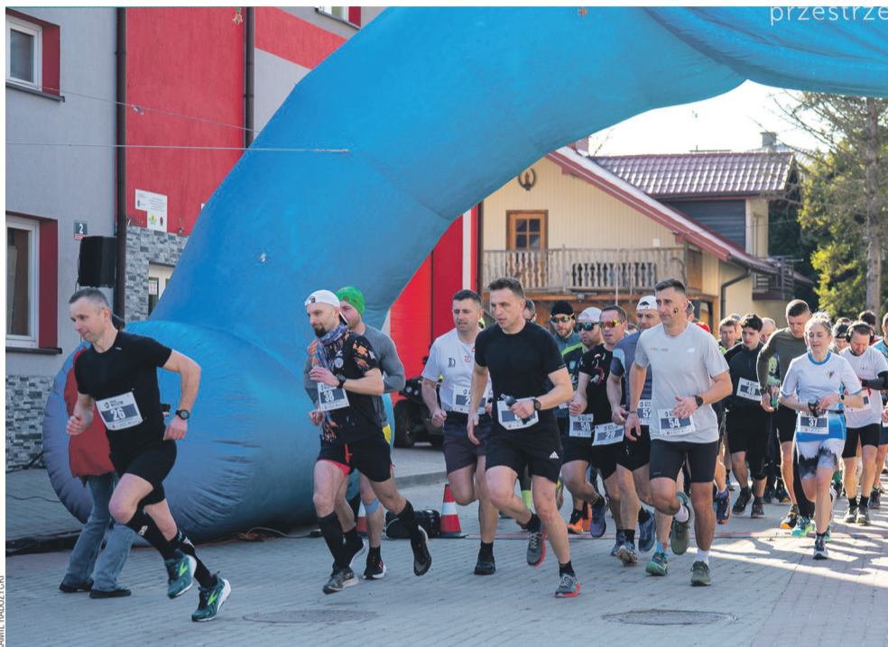
Start biegu w Bukowsku

Długodystansowcy ścigali się w różnych lokalizacjach w ramach akcji „Tropem Wilczym” (bieg w Sanoku miał nieco inny wymiar, o czym na str. 6), a także w górskich zmaganiach. Wpadło sporo lokat na podium – w tym na najwyższym stopniu.