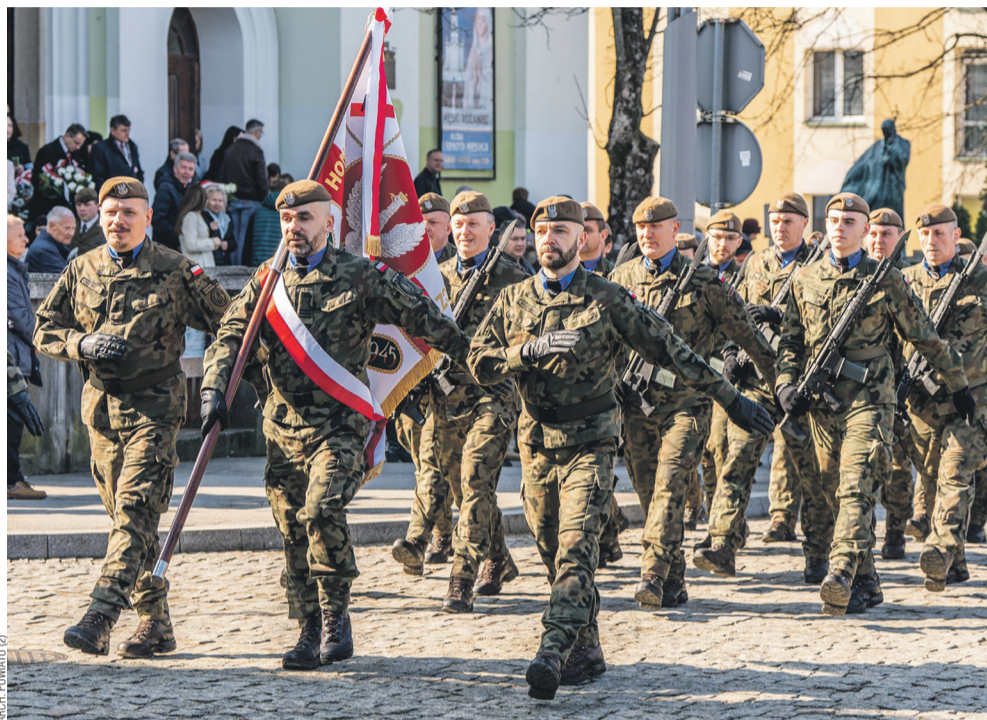
W uroczystościach uczestniczyli m.in. żołnierze 203. Batalionu Obrony Pogranicza