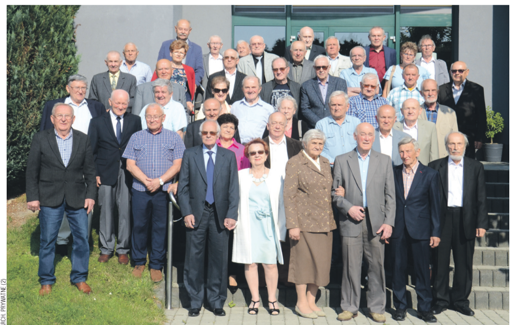
Klasy A, B i C – X zjazd (12 czerwca 2025 roku)