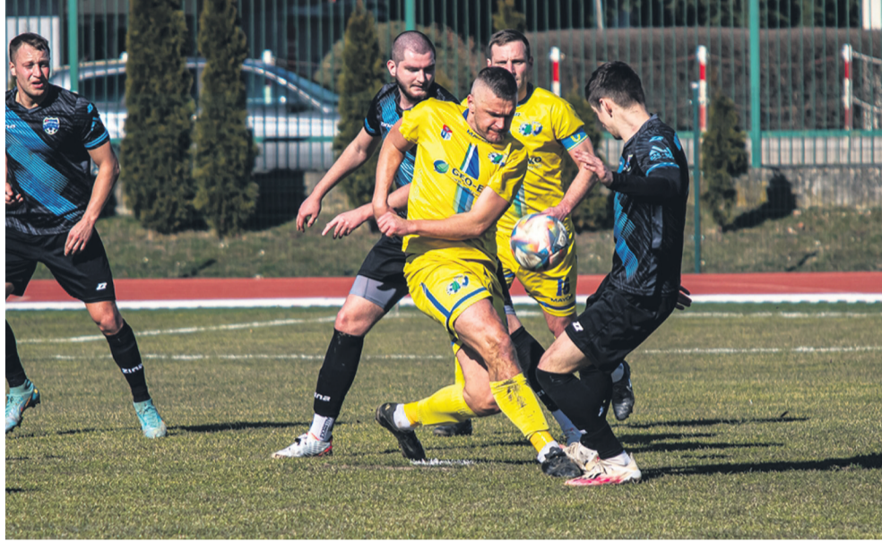
Wiosenne rozgrywki stalowcy rozpoczęli od podziału punktów