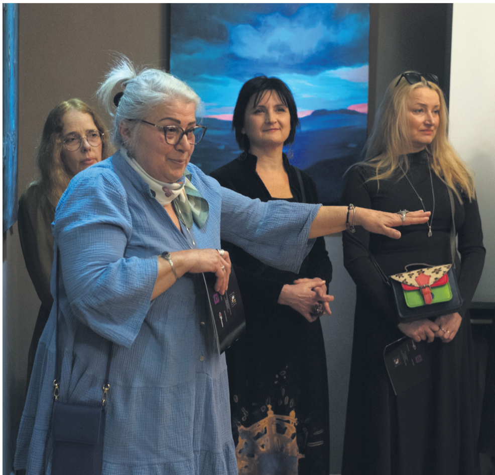
Wydarzenie w MBP było symbolicznym świętem kobiecej wrażliwości, talentu i twórczej energii

W MBP odbył się wernisaż wystawy „Który minąłem”, inspirowanej twórczością wybitnego sanockiego poety Janusza Szubera. Spotkanie miało szczególny charakter – zorganizowano je w przeddzień Dnia Kobiet, dlatego stało się również symbolicznym świętem kobiecej wrażliwości, talentu i twórczej energii.