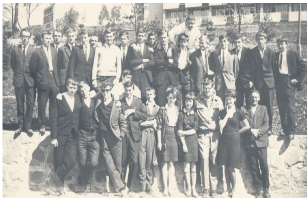
Klasy A, B i C – wycieczka na Solinie w budowie

Członkowie Komitetu Organizacyjnego XI Zjazdu Koleżeńckiego – Matura 1966