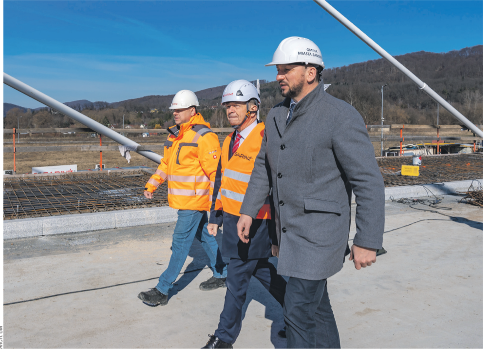
Ostatnio postępy prac przy moście osobiście sprawdzał wojewódzki marszałek Władysław Ortyl

Dzięki temu Sanok stał się ważnym ośrodkiem politycznym i kulturalnym. I właśnie