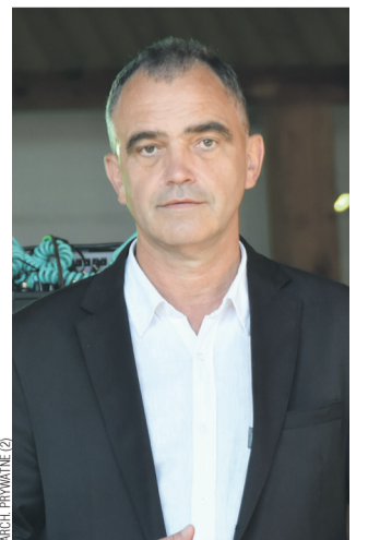
Historyk Andrzej Romaniak uważa, że Zofia była najbardziej „sanocką” z polskich królowych