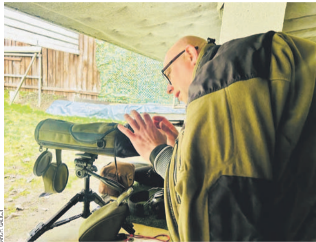
Strzelec Galicji podczas zawodów

wynik w dwuboju i trójboju strzeleckim. Drużyna „jedynek” zdominowała konkurencję karabinu (zwycięstwo) oraz pistoletu (2. lokata).