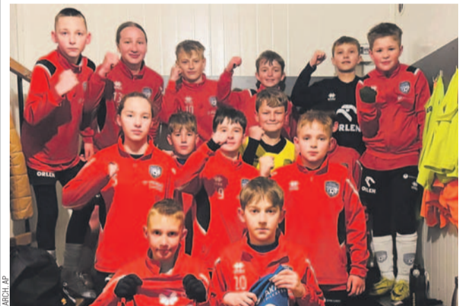
Drużyna młodzików młodszych AP

DYNOVIA DYNÓW – EKOBALL STAL SANOK 3:0 (0:0)