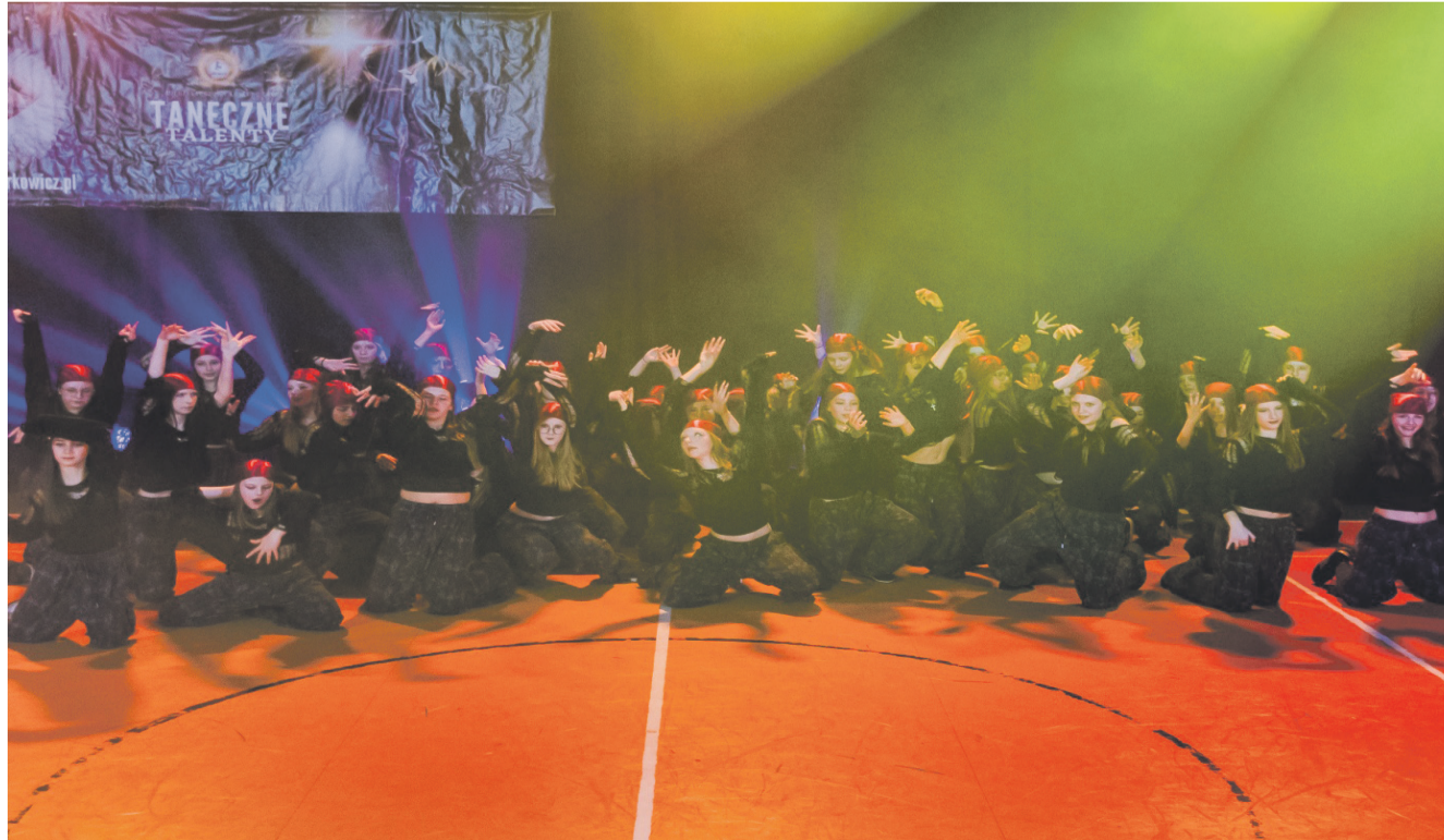
W kategorii 12-16 lat zespół Zenith Junior wygrał rywalizację w stylu Street Dance Show